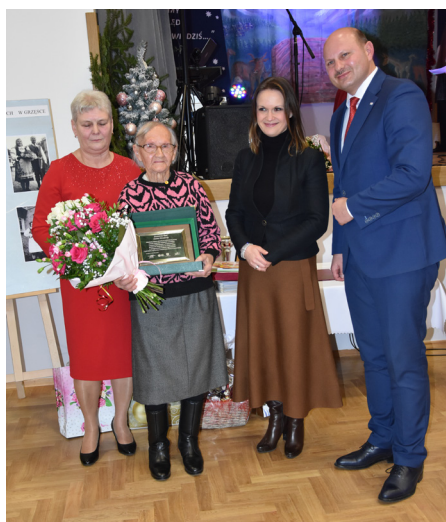
Podziękowania i gratulacje z okazji Jubileuszu 20-lecia działalności KGW w Grzędze

W tym roku zaszczyt zorganizowania Gminnego Wieczoru Kolęd przypadł Kołu Gospodyń Wiejskich z Grzędzi, które obchodziło również jubileusz 20-lecia działalności. Był to okazja do podsumowania dotychczasowej działalności KGW oraz złożenia gratulacji i wyrazów uznania za trud włożony w krzewienie rodzimych kultury.