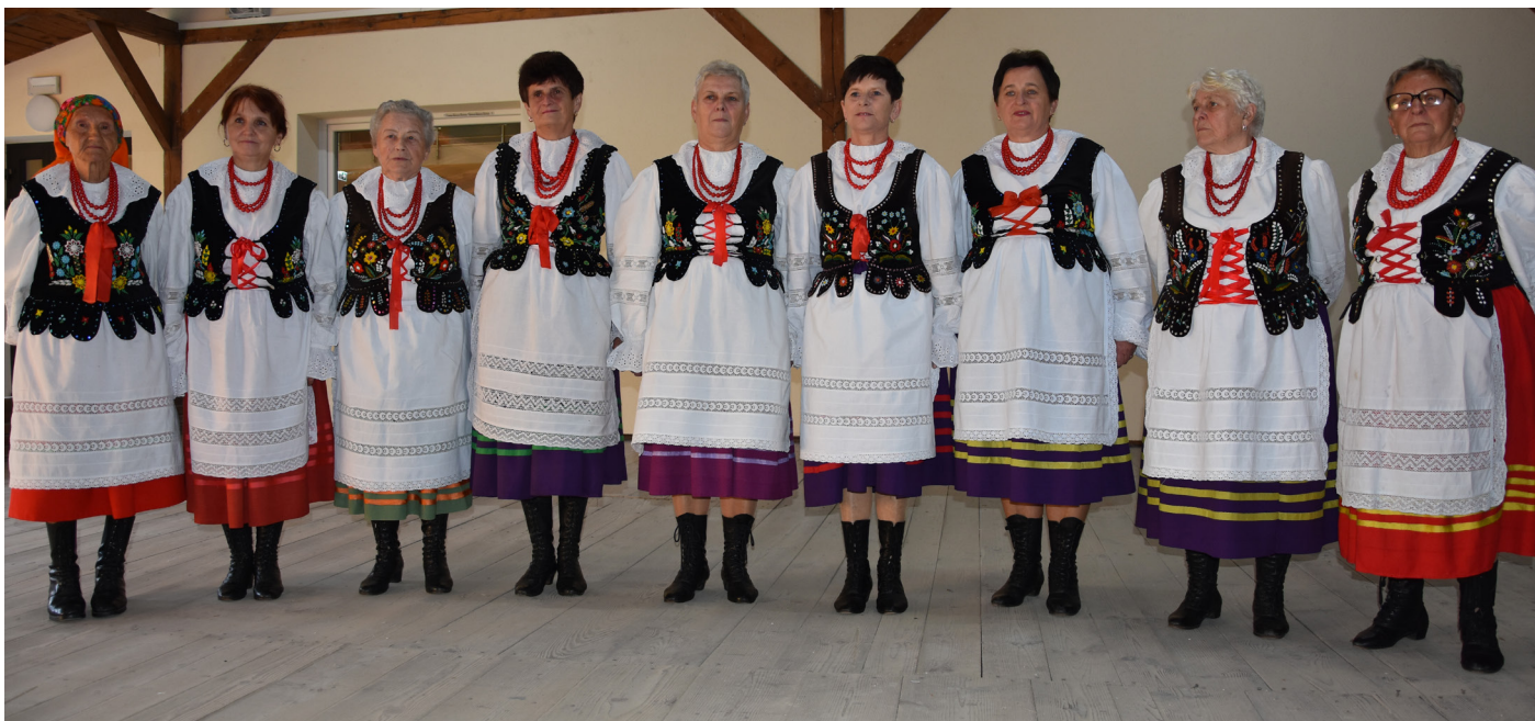
Fot. Członkinie KGW z Grzęski