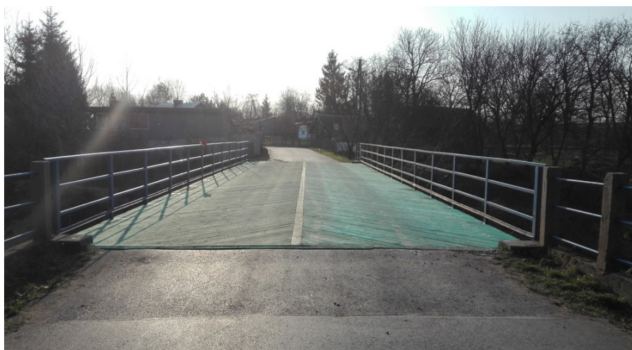
Fot. Wyremontowany most w Gorliczynie

wykonano nowe ustroje niosące mostów z belek poprzecznych oraz pokład dolny i jezdnię z bali drewnianych. Całkowita wartość robót wyniosła ponad 109 000,00 zł.