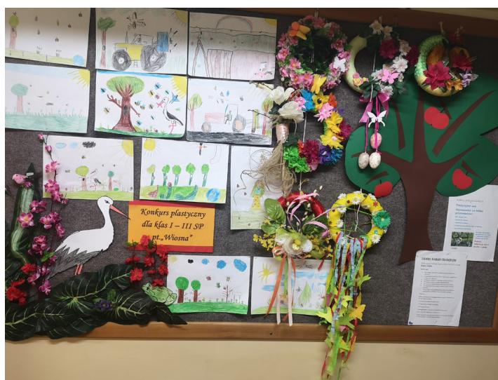
Fot. Wiosenne wianki

skiego, które miało przekonać naszych uczniów, że 21 marca nie warto wagarować, tylko przyjść do szkoły i świetnie się bawić. Następnie klasy IV-VIII i III G wraz z wychowawcami przystąpiły do „Międzyklasowego Turnieju Wiosennego”. Rywalizując w konkurencjach, w tym, m.in. układając poprawnie wiosenne cytaty, szukając nazw wiosennych