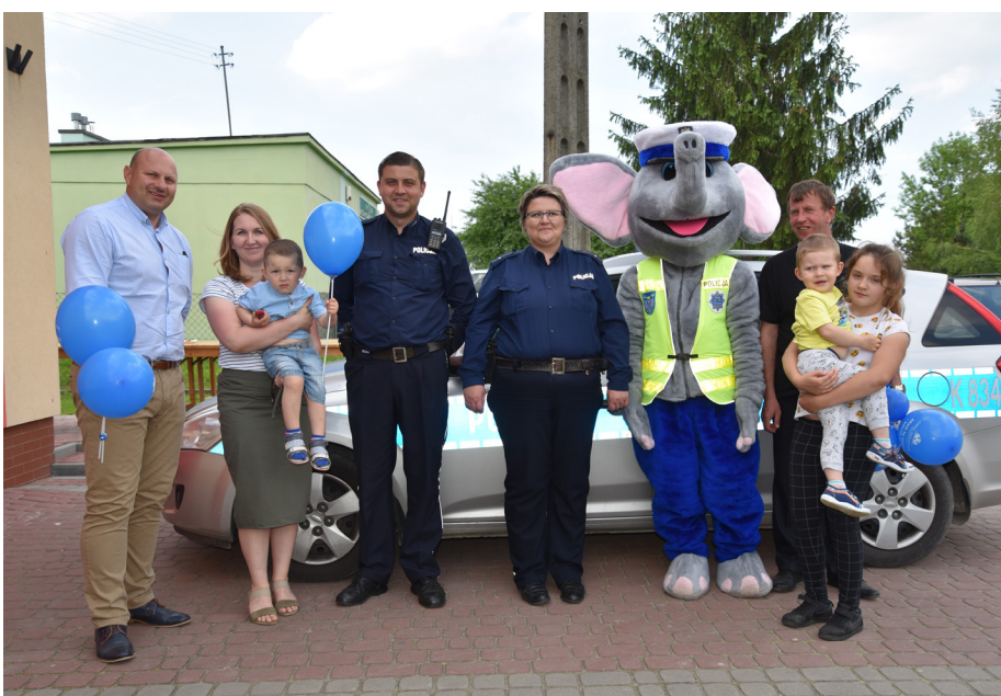
Fot. Piknik Rodzinny

prezentacji jako „dobra praktyka” dla innych samorządów w kraju, podczas spotkania podsumowującego inicjatywę podejmowane w 2019 roku, które odbędzie się w Ministerstwie.