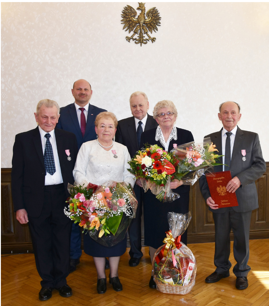
Fot. Jubilaci 50-lecia i 60-lecia pożycia małżeńskiego