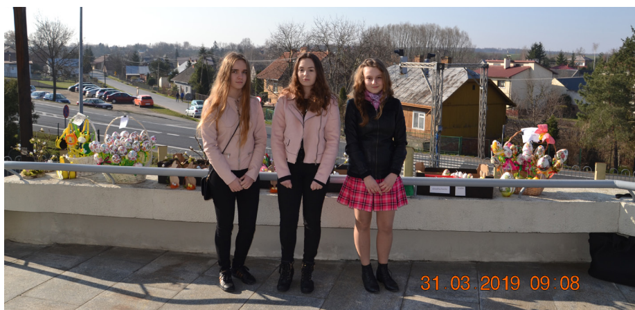
Fot. Z sercem na dłoni