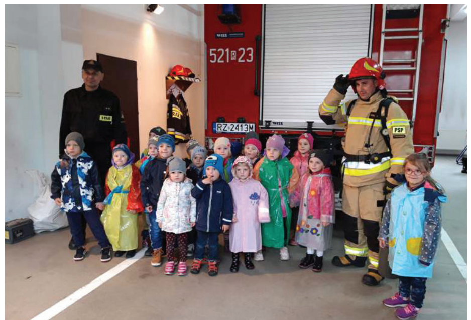
Fot. Spotkanie ze strażakami

Wszystkie przedszkolaki brały udział w bezpłatnych zajęciach języka