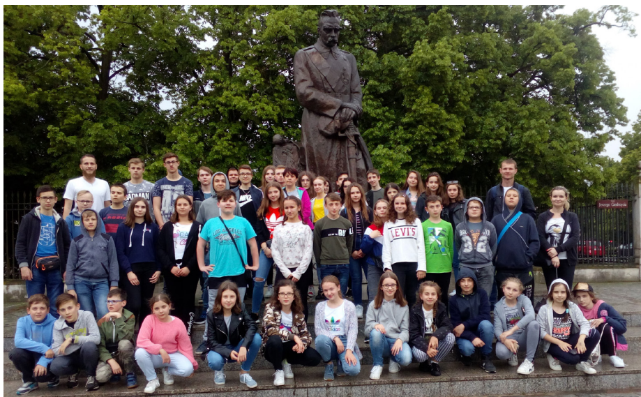
Fot. Wycieczka do Warszawy