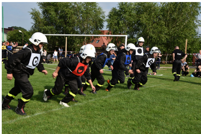
Fot. Konkurencje podczas zawodów