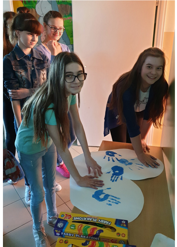
Fot. Światowy Dzień Świadomości Autyzmu

2 kwietnia w Szkole Podstawowej w Chałupkach obchodziliśmy Światowy Dzień Świadomości Autyzmu. Społeczność szkolna już kilka dni wcześniej zaczęła przygotowywać się do jedności z osobami dotkniętymi autyzmem i Zespołem Aspergera. Wspólnie przygotowana dekoracja składająca się z wielkich serc zawierających słowa, które mogą kierować do nas osoby z autyzmem stanowiła lekcję refleksji i empatii. Znakiem solidarności były odcisnięte w niebieskiej farbie dłonie – „pieczątki”. Prezentacja multimedialna oraz krótki film pozwoliły na poszerzenie wiedzy oraz zastanowienie się nad trudnościami z jakimi borykają się te osoby. Zwróciliśmy również uwagę na niezwykle umiejętności i codzienne funkcjonowanie wśród nas.