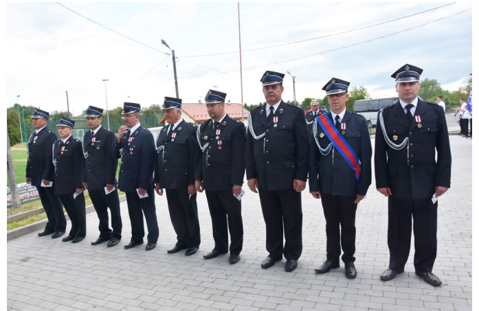
Fot. Odznaczeni zasłużeni Druhowie z terenu Gminy