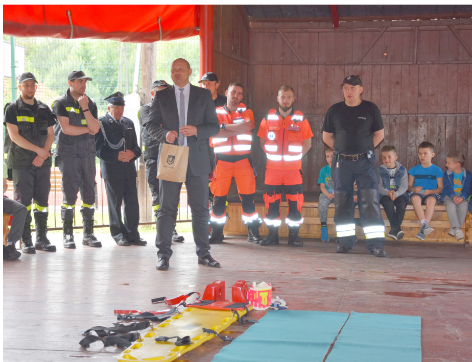
Fot. Dzień dziecka w Mirocinie