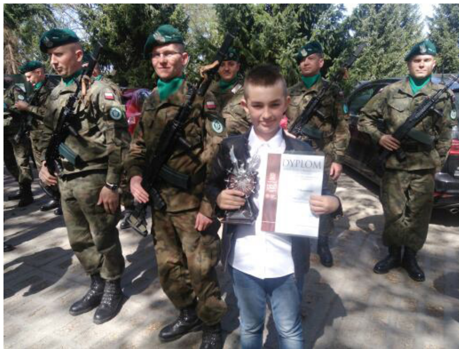
Fot. Laureat XVIII edycji konkursu Złot Gwiazdzisty. Śladami Przeszłości”

W kwietniu na terenie opactwa ss. benedyktynek w Jarosławiu odbyło się uroczyste podsumowanie XVIII edycji konkursu „Złot Gwiazdzisty. Śladami Przeszłości”. Uroczystość rozpoczęła się Mszą Św. w kościele pw. Św. Mikołaja i Stanisława.