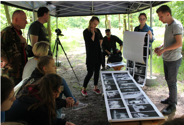
Fot. Warsztaty w Dębrzynie

Projekt realizowany jest przez Fundację na Rzecz Psychoprofilaktyki Społecznej PRO-FIL. A pozyskana dotacja to kwota 7 000, 00 zł.