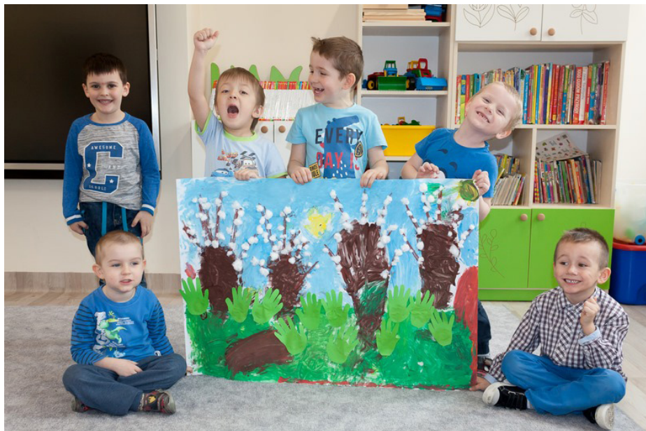
Fot. Piękna nasza Polska cała

W kwietniu odbyła się projekcja filmowa „W starym kinie”. Dzieci poznały dawne bajki i dobranocki np. „Krecik”, „Miś Uszatek”, „Bolek i Lolek”, na których wychowali się ich rodzice. Kolejnym z zadań było założenie ogródka wiosennego pn. „Ziemia – zielona wyspa”, w którym nasi mali ogrodnicy posadzili nie tylko kwiaty, ale także warzywa, rzeżuchę i posiali owies. Zorganizowany został także Kącik Książki Patriotycznej z możliwością wypożyczenia egzemplarzy do domu. W kwietniu Starszaki wzięły udział w Narodowym Czytaniu Legend Polskich, które odbyło się w bibliotece przy Szkole Podstawowej im. Józefa Piłsudskiego nr 3 w Przeworsku, gdzie pani bibliotekarka czytała dzieciom stare zapomniane już bajki i legendy polskie. W