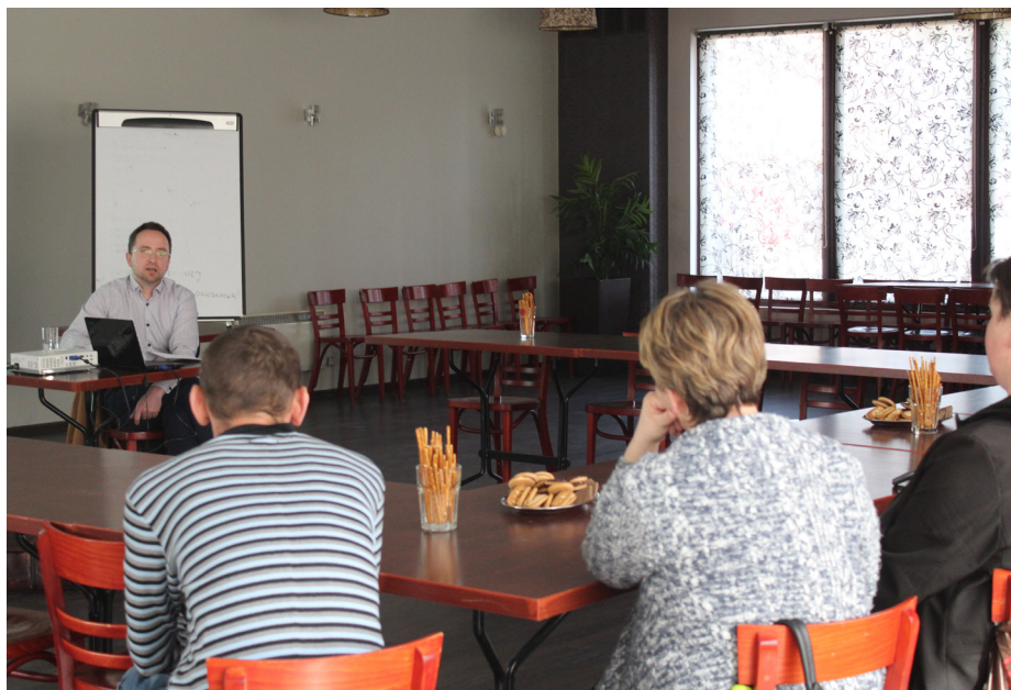
Fot. Warsztaty profilaktyczne.

Od września 2018 roku Gmina Przeworsk/Gminny Ośrodek Pomocy Społecznej w Przeworsku w partnerstwie z Liderem Fundacją na Rzecz Psychoprophylaktyki Społecznej PRO-FIL, realizuje projekt konkursowy „Z pomocą rodzinie” współfinansowany z środków Europejskiego Funduszu Społecznego - w ramach Regionalnego Programu Operacyjnego Województwa Podkarpackiego na lata 2014-2020, Oś priorytetowa VIII Integracja społeczna Działanie 8.4 Poprawa dostępu do usług wsparcia rodziny i pieczy zastępczej. Celem głównym projektu jest objęcie wsparciem 40 rodzin w tym minimum 120 uczestników dorosłych i dzieci z terenu Gminy Przeworsk, przeżywających problemy w życiu zawodowym, społecznym i rodzinnym (w tym również problemy związane z chorobą i niepełnosprawnością) poprzez zwiększenie dostępu do usług społecznych w szczególności usług środowiskowych, opiekuńczych oraz usług wsparcia rodziny. Projekt realizowany jest w okresie 24 miesięcy dla 2 grup po 60 osób w każdej. Wsparcie uczestników odbywa się