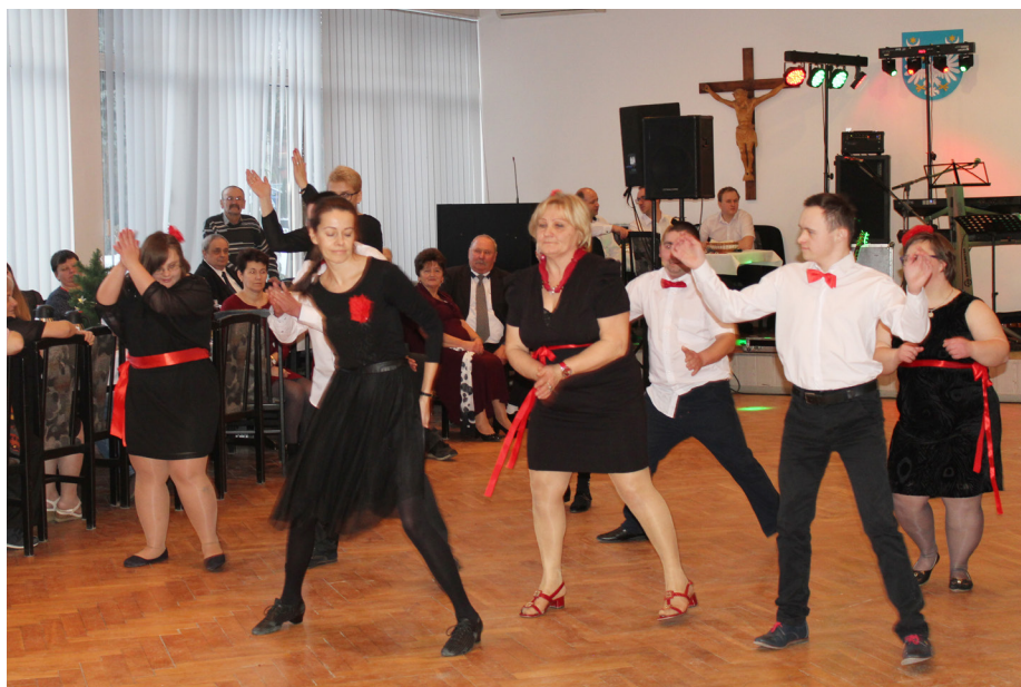
Fot. Pokaz taneczny w wykonaniu uczestników warsztatów tanecznych w roku 2018 wraz z instruktorką

Całkowita jego wartość to ponad 31 tysięcy złotych. Oferentami zadania są Fundacja na Rzecz Psychoprofilaktyki Społecznej PRO-FIL oraz Stowarzyszenie Inspiracji i Rozwoju PERSPEKTYWA. Projekt oferuje uczestnikom warsztaty artystyczno-kreatywne, tańeczno-rytmiczne, naukę gry na gitarze i kurs grafiki komputerowej. Zajęcia rozpoczynamy już w sierpniu.