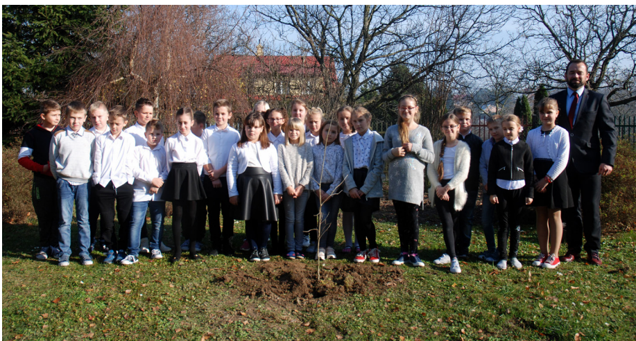
Fot. Sadzenie drzew