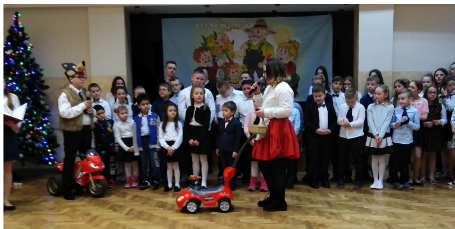
Fot. Dzień seniora

Dzień ten rozpoczęliśmy od przedstawienia pt. „Wiosenne rozterki” w wykonaniu członków Samorządu Uczniow-