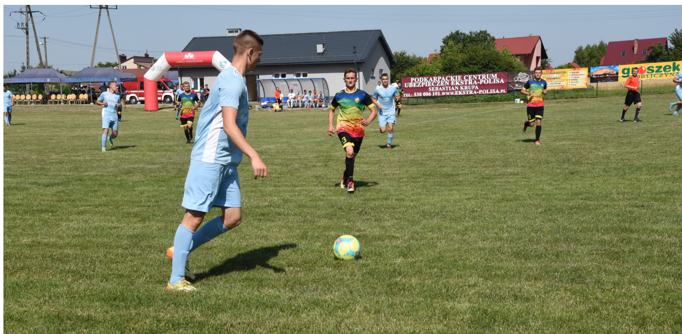
Fot. Mecz pomiędzy drużynami Urzejowic i Grzęski