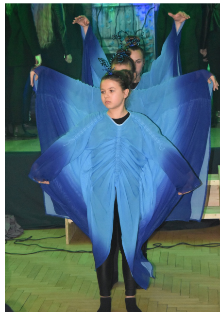
Fot. Kadr ze spektaklu w reżyserii Anny Bieniasz-Markowicz i oprawie muzycznej Marcina Szylara

Społeczność Gminy Przeworsk natomiast miała możliwość uczestniczenia w cyklu spektakli, które w prezentowały czym jest autyzm i zespół Aspergera, pozwoliły lepiej zrozumieć codzienne funkcjonowanie rodzin.