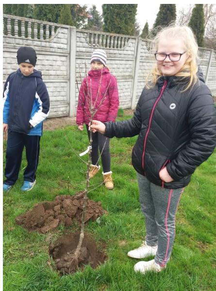
Fot. Sadzenie drzew

Od wieków Polska była potęgą sadowniczą opartą o drzewa dawnych odmian. Stare odmiany funkcjonowały we wszystkich regionach Polski i były doskonale przystosowane do panujących tam warunków. To głównie jabłonie były głównym elementem krajobrazu i stanowiły podstawę zaopatrzenia naszych gospodarstw. W ostatnich 50-ciu latach wyginęło 80% zasobów starych drzew owocowych. Powstały nowe „przemysłowe” odmiany. Przystosowane są one do zwiększonej produktywności. Ceną za sukces wydajności jest to, że drzewa muszą być przyskane około 30 razy w ciągu sezonu wegetacyjnego! W dobie zwiększającej się świadomości skażenia środowiska, społeczeństwo interesuje się produktami uprawianymi bez nadmiernej chemizacji. Stąd konieczność powrotu do dawnych odmian, które przez dziesięciolecia radziły sobie świetnie w rodzimych warunkach. Stało się to motywem przewodnim do realizacji projektu sadzenia drzew owocowych, którymi opiekują się uczniowie. W tym roku szkolnym posadzono: jabłoń Złota reneta i Red boskop oraz Śliwkę węgierską i Gruszę konferencję. Upamiętniono w ten sposób tegoroczne obchody Dnia