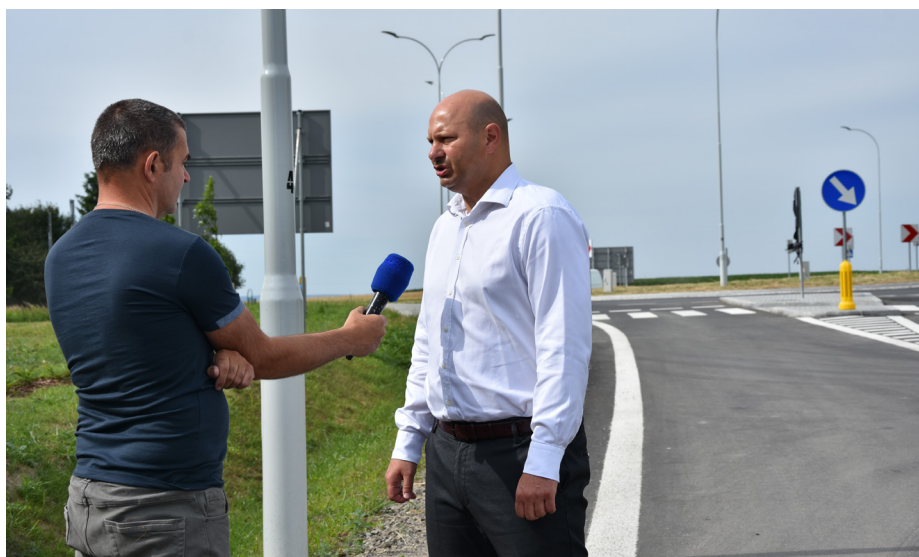
Fot. Otwarcie łącznika autostradowego

Zakończono prace związane z budową drogi „łącznika” od węzła autostrady A4 Przeworsk do drogi krajowej nr 94 w Gwizdaju. Inwestycja w większości położona jest na terenie Gminy Przeworsk. Koszt budowy łącznika to kwota ponad 23 mln zł, z czego prawie 20 mln pochodzi z Regionalnego Programu Operacyjnego Województwa Podkarpackiego na lata 2014 - 2020, a 3,5 mln z budżetu