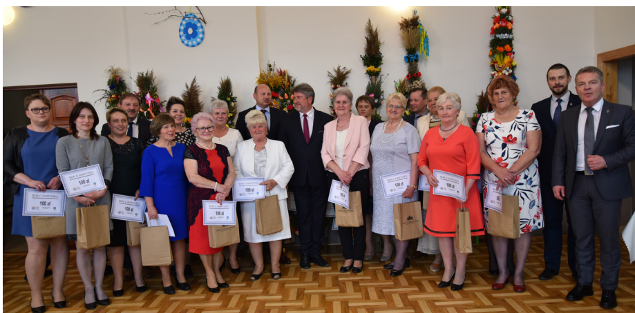
Fot. Wyróżnieni uczestnicy Przeglądu Palm Wielkanocnych

z terenu Gminy Przeworsk oraz trzy ze Stowarzyszenia Aktywna Gorliczyna, Stowarzyszenia Na Rzecz Rozwoju Wsi Gorliczyna, Stowarzyszenia Przyjaciół Szkoły w Świętoniowej i Stowarzyszenia Przyjaciół Ziemi Nowosieleckiej.