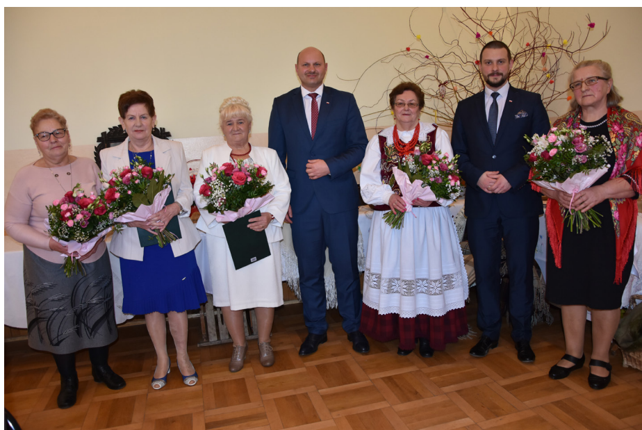
Fot. Gratulacje z okazji Jubileuszu 60-lecia działalności KGW w Gorliczynie

Ten piękny Jubileusz uświetnił swoim występem Zespół Śpiewaczy „Cantus” z Gorliczyny. Część oficjalna zwieńczona została odśpiewaniem tradycyjnego „Sto lat”. Panie zadbały o każdy szczegół uroczystości. Nie za-