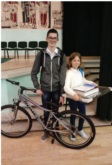
Fot. Laureaci diecezjalnego Konkursu Biblijnego

Hasło edycji tegorocznego konkursu brzmiało: „Jezusowa szkoła ucznia