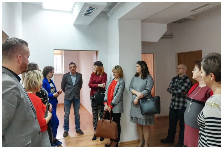
Fot. Wizyta pracowników pomocy społecznej z terenu województwa podkarpackiego w Ośrodku

demia Innowacji Społecznych jest możliwe za pośrednictwem ośrodka pomocy społecznej właściwego ze względu na ostatni stały adres zameldowania osoby kierowanej.