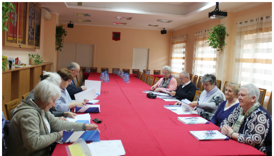
Fot. Warsztaty komputerowe

poznania atrakcji turystycznych czy kulinarnych, dostępu do tańszych i zdrowotnych produktów spożywczych); finansów (m.in. do zakładania konta bankowego, prowadzenia Inwestycji Online, zakupy/sprzedaż online); spraw codziennych (m.in. w celu zaplanowania podróży, zakupu biletów, sprawdzenia rozkładu jazdy publicznych środków transportu, załatwiania spraw obywatelskich). Projekt „Podkarpacki E-senior” współfinansowany jest z działania 3.1 Działania szkoleniowe na rzecz rozwoju kompetencji cyfrowych Programu Operacyjnego Polska Cyfrowa na lata 2014 – 2020. Celem ogólnym projektu jest nabycie i utrwalenie kompetencji cyfrowych osób niepełnosprawnych w wieku 65+.