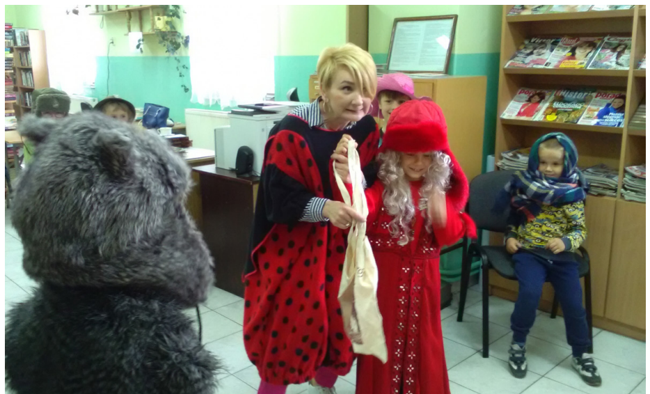
Fot. Uczestnicy zajęć w inscenizacji bajki Czerwony Kapturek