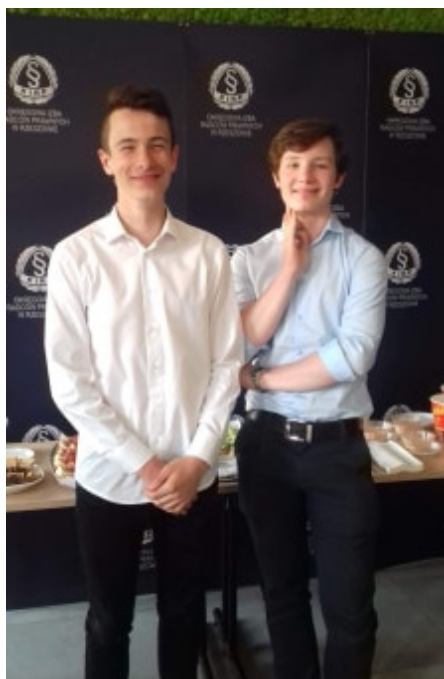
Fot. Laureaci IV Edycji Ogólnopolskiej Akademii – Konkursu Wiedzy o Prawie

W I etapie był do wypełnienia test on-line, na II etapie (poziom okręgowy siedzibie OIRP w Rzeszowie) należało