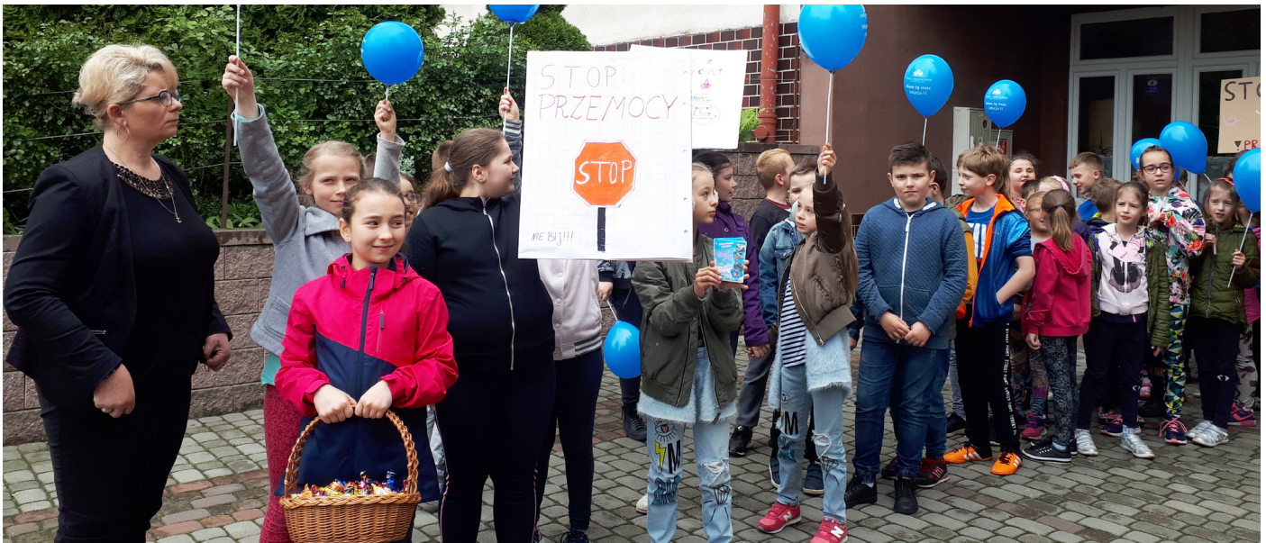
Fot. Happening w Nowosielcach z udziałem dzieci zapraszających mieszkańców na Piknik