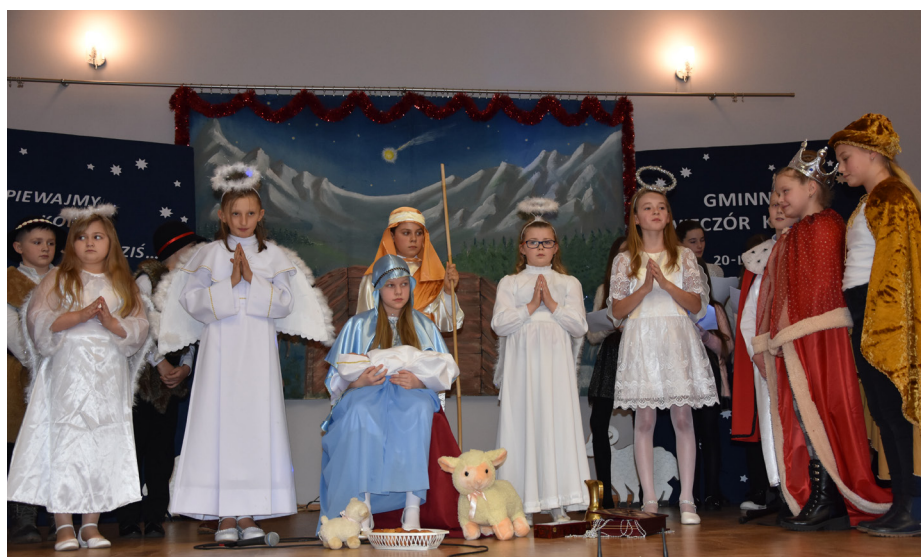
Fot. Część artystyczna w wykonaniu uczniów SP w Grzędze

Magiczny nastrój Świąt Bożego Narodzenia wprowadziły dzieci i młodzież ze Szkoły Podstawowej w Grzędze prezentując program artystyczny „Spotkanie przy Żłóbku”. Po nim nastąpił uroczysty moment wspólnej modlitwy, którą poprowadził ksiądz prałat Stanisław Ozga, był opłatek i życzenia. Na wszystkich