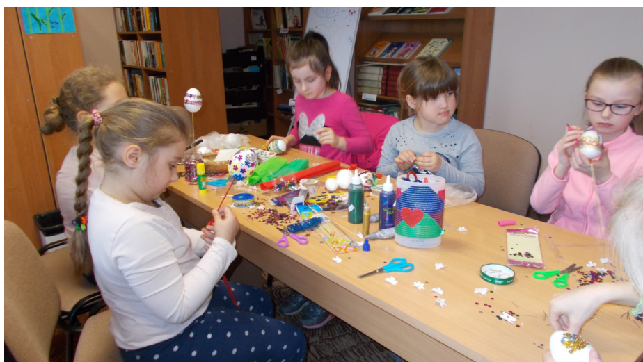
Fot. Warsztaty artystyczne

Ponadto biblioteka organizuje dla dzieci różnego rodzaju zajęcia plastyczne i manualne, które często tematycznie związane są z przypadającymi w tym czasie świętami lub uroczystościami. Wprowadzeniem do zajęć jest przybliżenie uczniom tradycji i zwyczajów które są związane z tymi wydarzeniami np. Święta Wielkanocne czy Święto Konstytucji 3-go Maja.