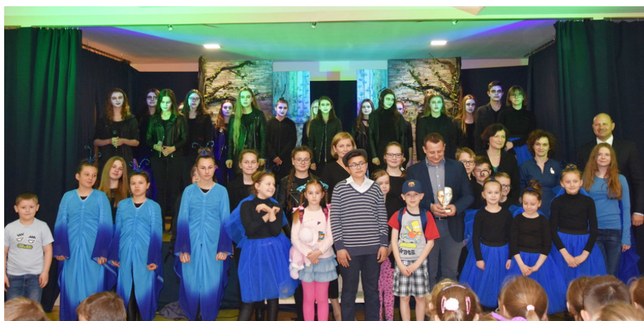
Fot. Uczestnicy spektaklu