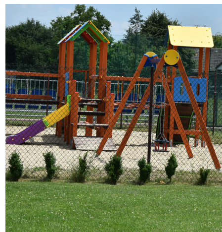
Fot. Urządzenia zabawowe na placu zabaw w Gorliczynie

Na placach zabaw przy przedszkolach w miejscowościach Gorliczyna, Grzęska, Świętoniowa i Urzejowice pojawiły się nowe urządzenia sprawnościowe dla maluchów. Koszt montażu urządzeń to 85 705,81 zł. Zadanie w całości zostało sfinansowane ze środków unijnych Regionalnego Programu Operacyjnego Województwa Podkarpackiego na lata 2014-2020 w ramach projektu „Mali odkrywcy”.