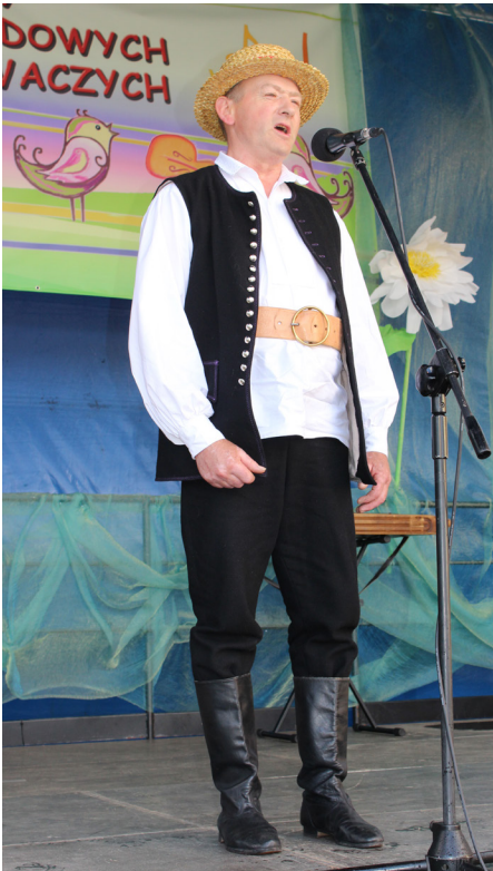
Fot. Kazimierz Rzymek laureat I nagrody W Regionalnym Przeglądzie Kapel Ludowych i Zespołów Śpiewaczych w Nienadowej

Podczas XX Regionalnego Przeglądu Grup Śpiewaczych Kołedy i Pastoralki,