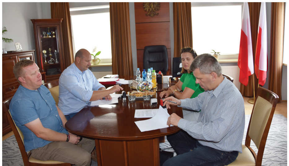
Fot. Podpisanie umowy na budowę Sali przy szkole w Studzianie

dlowa Akar, Grzegorz Piel, ul. Zawiszy Czarnego 26A, 35-082 Rzeszów. Wartość robót ustalona w procedurze przetargowej wynosi 3 320 432,56 zł. W ramach tego wniosku uzyskano również dofinansowanie na budowę wielofunkcyjnego boiska sportowego o nawierzchni poliuretanowej w Chałupkach. W ramach inwestycji planuje się wykonanie: boiska wielofunkcyjnego, ogrodzenia, kanalizacji deszczowej, chodników, obiektów małej architektury: oraz wydzielenie 10 stanowisk postojowych w tym jedno przystosowane dla osób niepełnosprawnych. Koszt budowy opiewa na kwotę 500 000,00 zł z czego 240 000,00 zł. pochodzić będzie z dofinansowania. Termin zakończenia prac to wrzesień 2019 r.