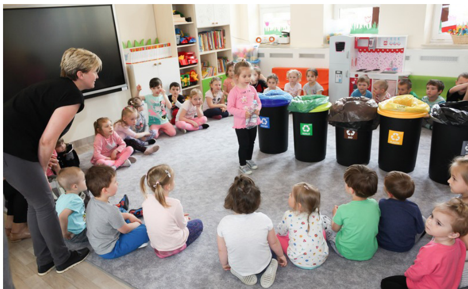
Fot. Akcja ekologiczna Listy dla Ziemi

W ramach obchodów Światowego Dnia Ziemi przypadającego w kwietniu dzieci z Przedszkola Samorządowego „Mali odkrywcy” w Gorliczynie wzięły