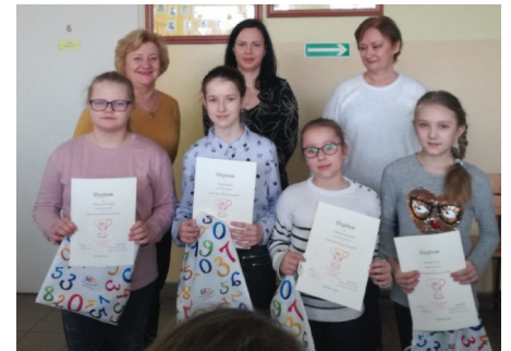
Fot. Zwycięzcy konkursu SKO

Szkoła Podstawowa w Ujeznej od wielu lat współpracuje z bankiem PKO BP prowadząc Szkolną Kasę Oszczędności. W tym roku podjęliśmy działania celem zachęcenia uczniów do zakładania kont w SKO, jak również do aktywnego z nich korzystania. Został założony blog, na którym publikowaliśmy informacje. W lutym odbył się konkurs pt. „Dlaczego warto oszczędzać.” Warto podkreślić, że często korzystaliśmy z materiałów dydaktycznych, przygotowując sondy, ankiety pogadanki i projekty. Okazały się one bardzo ciekawe i pomocne w omawianiu z uczniami zagadnień tj. cyberprzemoc, ekologia, bezpieczeństwo, jak również planowanie.