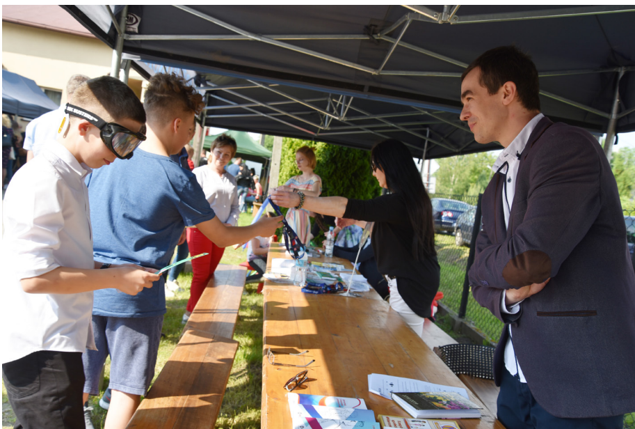
Fot. Stoiska profilaktyczne