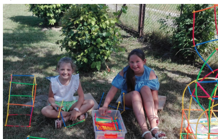
Fot. Konkursy i zabawy podczas Gminnego Święta Sportu w Gorliczynie

To tytuł projektu jaki realizuje na terenie Gminy Przeworsk Parafia Rzymskokatolicka p.w. Matki Bożej Fatimskiej w Rozborzu wspólnie z Akademią Innowacji Społecznych. Projekt obejmuje 8 kampanii informacyjno – edukacyjnych z profilaktyki przeciwdziałania alkoholizmowi i uzależnieniom w formie zabaw i konkursów z nagrodami. Są to po dwie akcje w każdej z Gmin uczestniczących w projekcie tj. Gmina: Przeworsk, Dubiecko, Pruchnik i Wielkie Oczy. Łącznie to 8 kampanii. Działania towarzyszą cyklicznym imprezom organizowanym w poszczególnych Gminach. W Gminie Przeworsk będzie to Gminne Święto Sportu oraz Dożynki Gminne. Kampanie