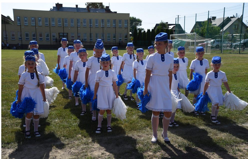
Fot. Parada Mażoretek podczas Gminnego Święta Sportu w Goliczynie