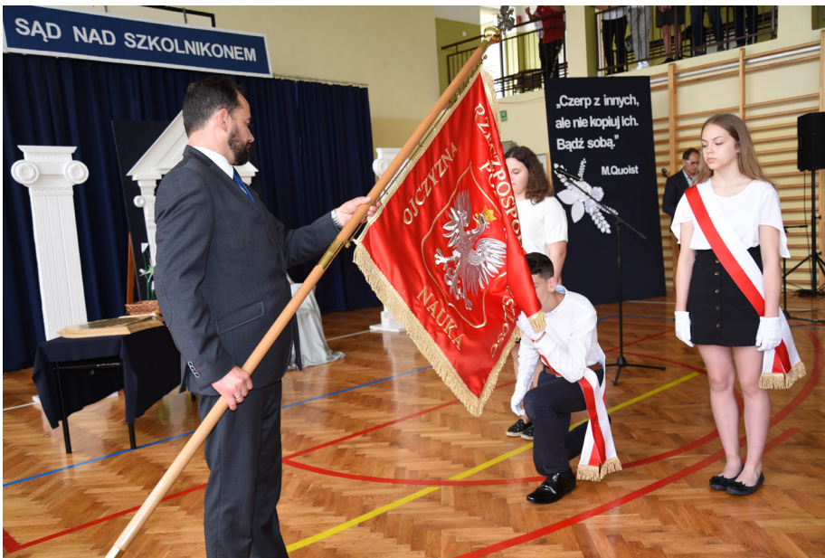
Fot. Przekazanie sztandaru społeczności szkolnej