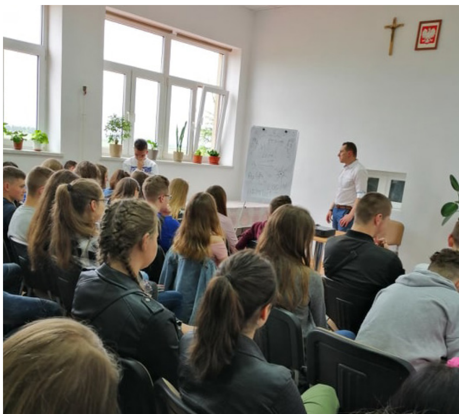
Fot. Rozmowa o wolontariacie - spotkanie młodzieży w siedzibie Stowarzyszenia Akademii Innowacji Społecznych

Przez najbliższy rok młodych ludzi w wieku 15 – 29 lat będzie miało okazję skorzystać ze szkoleń, doradztwa i innych ciekawych form aktywności dzięki którym zwiększą swoją atrakcyjność na rynku pracy oraz poznają specyfikę funkcjonowania sektora ekonomii społecznej. Poza cyklem spotkań budujących kompetencje interpersonalne, młodzież będzie miała okazję spotkać się z ludźmi pełniącymi ważne społecznie i zawodowo funkcje. Uczestnicy wyjadą również na wizytę studyjną do Bałtowa, gdzie poznają idee partnerstwa trójsektorowego i ekonomii społecznej w powsta-