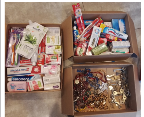
Fot. Zbiórka darów na misje w Afryce

W okresie Wielkiego Postu Szkoła Podstawowa w Urzejowicach włączyła się w akcje prowadzone przez Księży Werbistów z Pieniężna – zbiórkę znaków wiary, środków czystości oraz kluczy. Mnóstwo dzieci włączyło się w akcję. Zebrane produkty zostały przekazane do poznańskiej wspólnoty księży Werbistów skąd trafią na misje w Afryce.