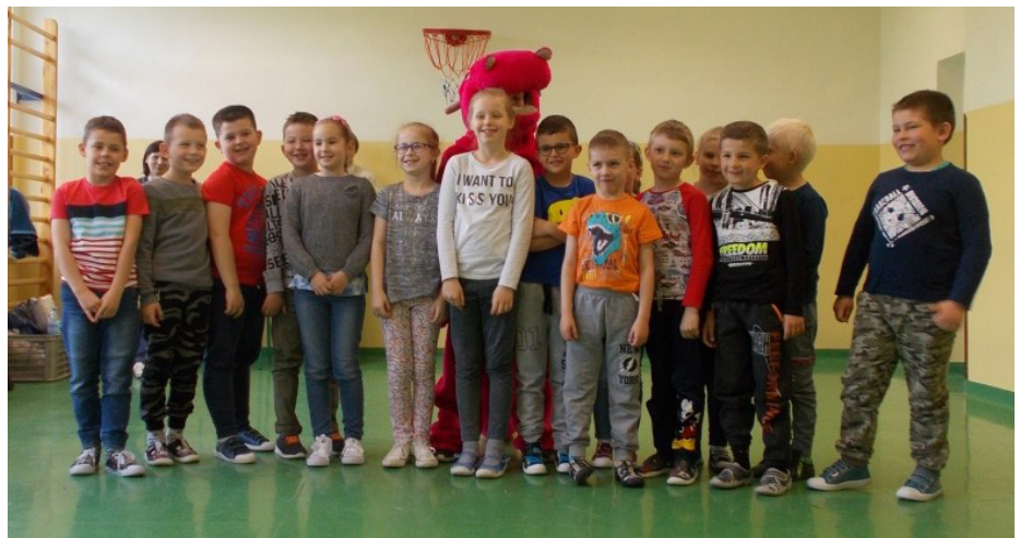
Fot. Uczestnicy spotkania

Dzieci żywiołowo reagowały i choć spotkanie trwało ponad godzinę, nie było nudy czy ziewania. Mamy nadzieję, że Dzień Bibliotekarza i Bibliotek w przyszłym roku będzie równie udany.