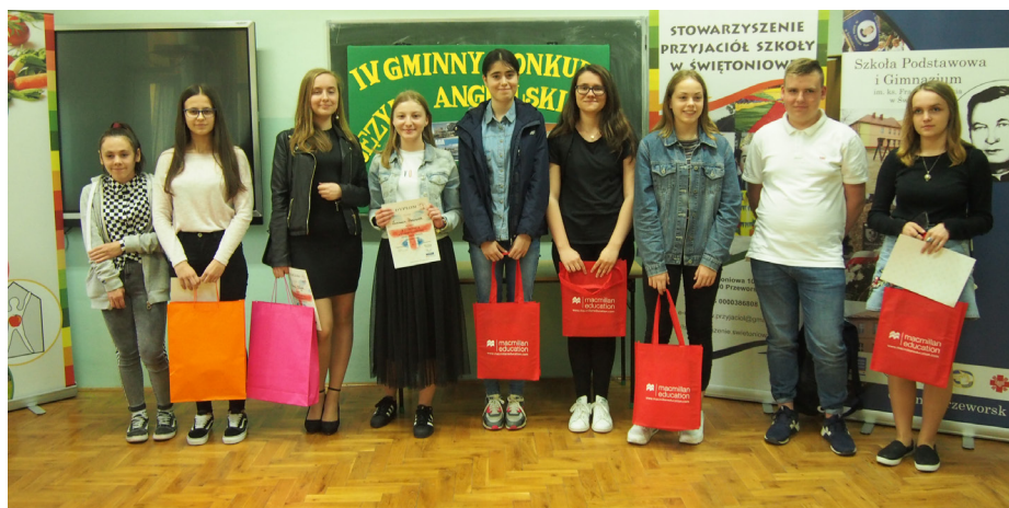
Fot. Gminny Konkurs z języka angielskiego