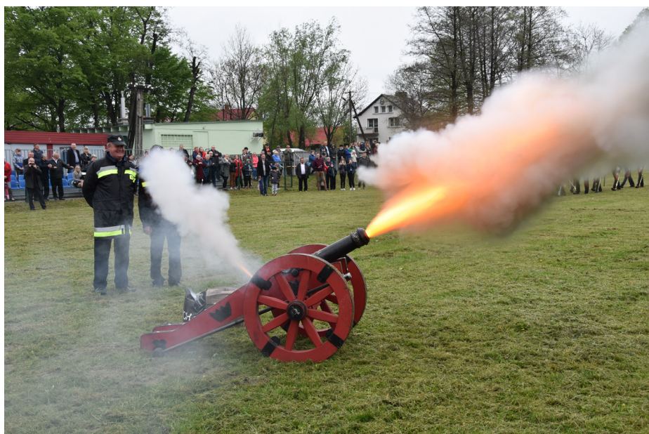
Fot. Strzał z armaty na rozpoczęcie Parady