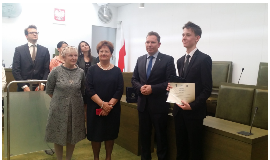
Fot. Finalista IV Edycji Ogólnopolskiej Akademii – Konkursu Wiedzy o Prawie