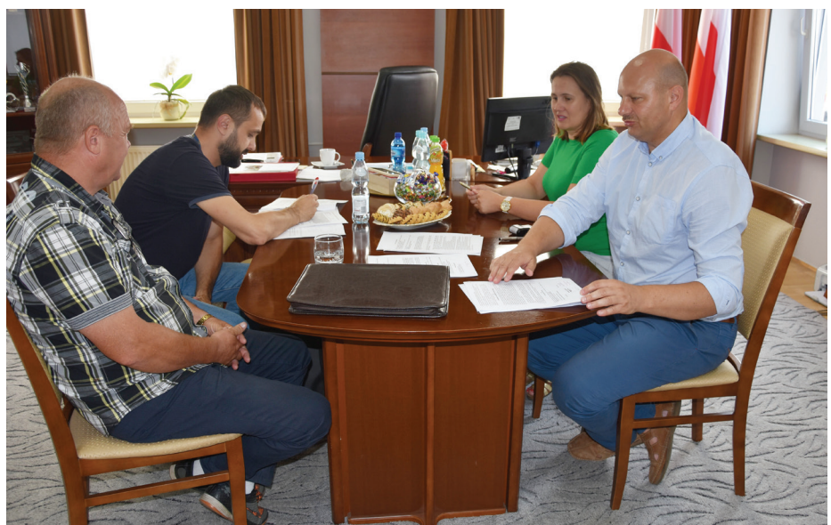
Fot. Podpisanie umowy na wielofunkcyjne boisko sportowe w Chałupkach