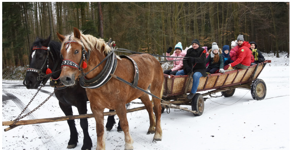
Fot. Uczestnicy kuligu

Ferie z Biblioteką Publiczną Gminy Przeworsk i GOK-em rozpoczęły się wycieczką do Helusza. Pięćdziesięciosobowa grupa dzieci i młodzieży z Zespołu Tańca Ludowego w Urzeżowicach i Zespołu Mażorettek w Grzędzie uczestniczyła w kuligu po ośnieżonych drogach wiodących przez pola i uroczyste leśne zakątki. Po pełnej wrażeń przejażdżce uczestnicy ogrzali się przy ognisku piekąc kiełbaski. Następnie nadszedł czas na zabawę taneczną, przeplatana różnymi konkursami.