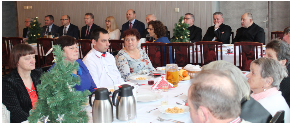
Fot. Spotkanie noworoczne