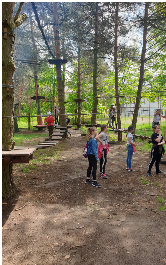
Fot. Park linowy

Odwiedziliśmy „Czarną kaplicę”, gdzie poznaliśmy niezwykłą historię tego miejsca. Duże wrażenie wywarła na nas Sala Papieska, która jest największą na Podkarpaciu kolekcją związaną z osobą Papieża Polaka. Po strawie duchowej udaliśmy się do kawiarenki na pyszną szarlotkę, która ucieszyła nasze podniebienia i dodała energii. Następnym punktem programu była Radawa, a tam czekała na nas park linowy i paintball. Zabawa była przednia, a wszystko to przeplatane wspólnym grillowaniem. Pełni wrażeń wróciliśmy do Chałupki.