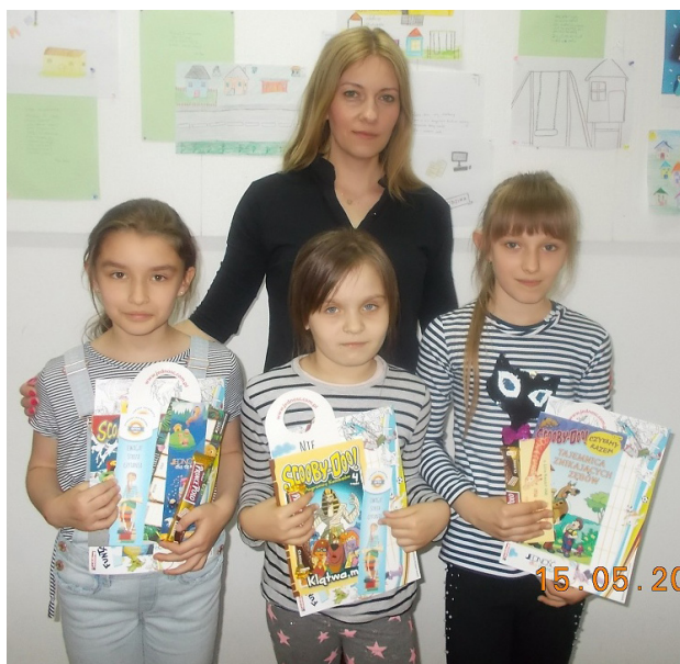
Fot. Nagrodzone czytelniczki

Inspiracją do naszych poczynań manualno-