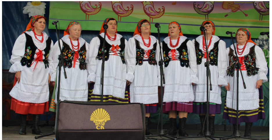
Fot. Zespół Śpiewaczy „Grzęszczanie z Grzęski”