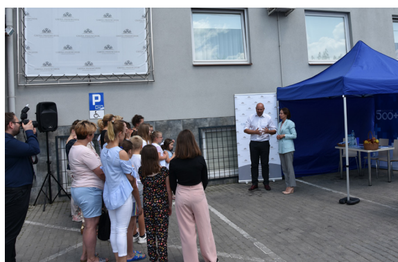
Fot. Spotkanie informacyjne z Wicewojewodą Podkarpackim Lucyną Podhalicz

Ponadto, dzięki zmianie ustawy rodzic nowonarodzonego dziecka będzie miał 3 miesiące na złożenie wniosku o świadczenie wychowawcze bez obawy, że 500 plus za ten okres nie zostanie wypłacone. W maju 2019 roku w Gminie Przeworsk ponad 1700 dzieci otrzymało świadczenie 500 plus. Kwota wypłaty majowej wyniosła 880 000 tysięcy złotych. Po zmianach lipcowych szacują się, że świadczenie obejmie około 2900 dzieci na terenie Gminy.