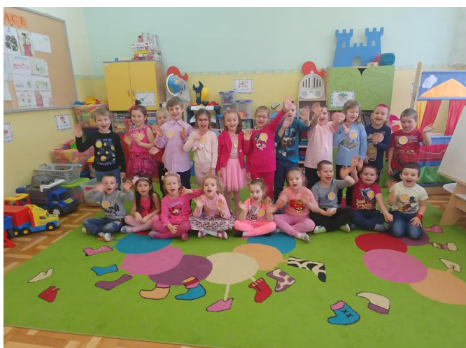
Fot. Przedszkolaki z Urzejowic

w inicjatywie „Listy dla Ziemi”. Jest to ogólnopolską akcją edukacyjną, mającą na celu promowanie wśród dzieci i młodzieży zachowań proekologicz-