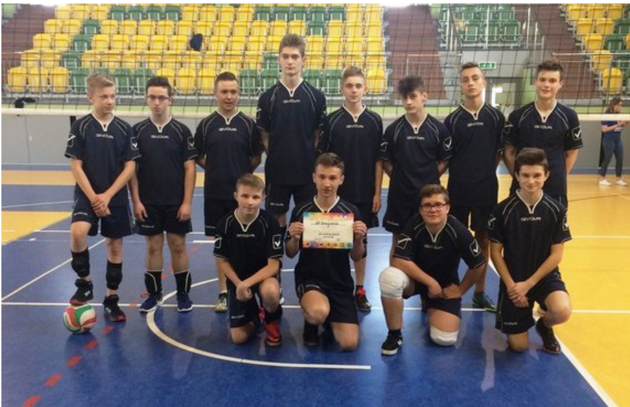
Fot. Szkolny Klub Sportowy

wodniczyli w zawodach organizowanych przez GLAPS i ZS. W zawodach siatkarskich w rywalizacji gminnej zajęli I miejsce, podobnie w powiecie jak i w zawodach rejonowych. Dochodząc do półfinałów wojewódzkich uplasowali się w końcowej kwalifikacji na miejscu III. szeregi Szkolnego Klubu Sportowego z każdym dniem się poszerzają, a do sekcji poza chłopcami, zgłaszają się także dziewczęta.