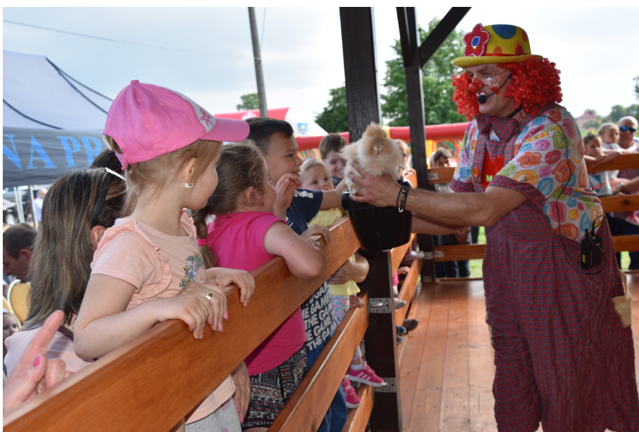
Fot. Animacje dla dzieci

Jest nam niezmiernie miło, iż projekt ten został wskazany przez Wojewodę Podkarpacką jako najlepszy projekt w województwie i zaproponowany do