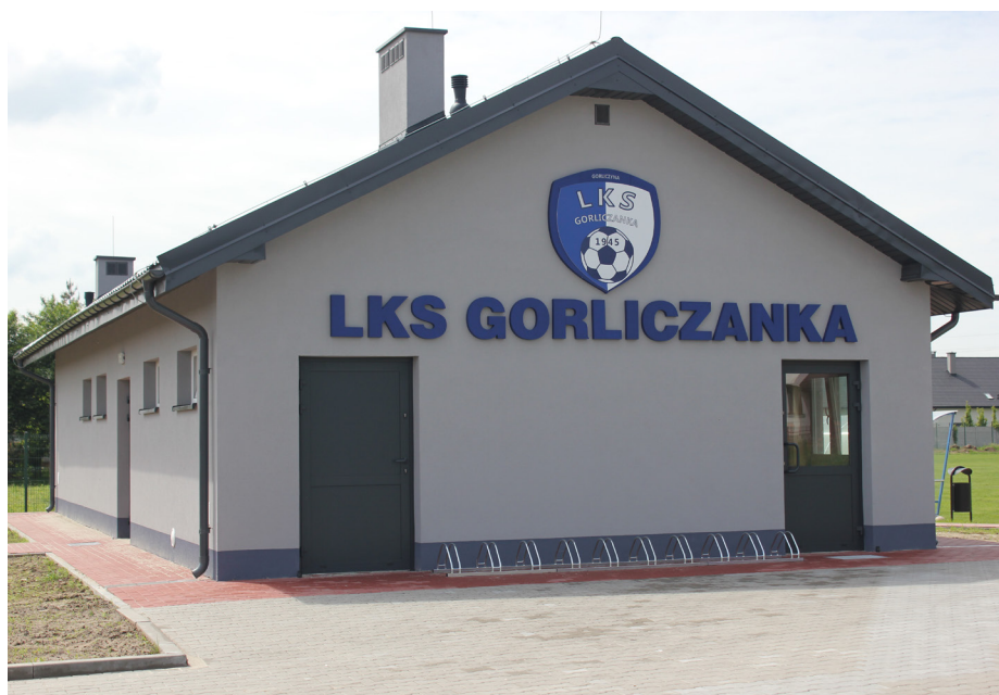
Fot. Nowy budynek szatni w Gorliczynie

mach operacji dostosowano istniejący teren przy przedszkolu samorządowym w Gorliczynie do wszelkiego rodzaju potrzeb integracyjnych, rekreacyjnych i kulturalnych. Wybudowano budynek socjalno-szatniowy z przeznaczeniem dla sportowców, wymieniono zniszczone ogrodzenie terenu, powstały nowe boksy dla drużyn biorących udział w zawodach sportowych oraz widownia dla mieszkańców uczestniczących w organizowanych imprezach.