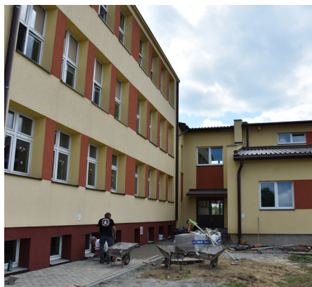
Fot. Prace wykończeniowe na zewnątrz budynku

Dobiegają końca prace związane z budową przyszłolnej sali gimnastycznej w Świętoniowej. Wartość robót to 2 940 000,00 zł, termin zakończenia 31 lipca 2019 r. Zadanie dofinansowane jest ze środków Ministerstwa Sportu i Turystyki w kwocie 1 450 000,00 zł. Wykonano praktycznie wszystkie roboty wykończeniowe wewnątrz budynku. Trwa wyposażanie w urządzenia sportowe oraz prace związane z zagospodarowaniem terenu wokół budynku.