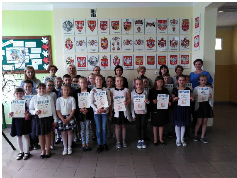
Fot. Uczestnicy konkursu czytania ze zrozumieniem