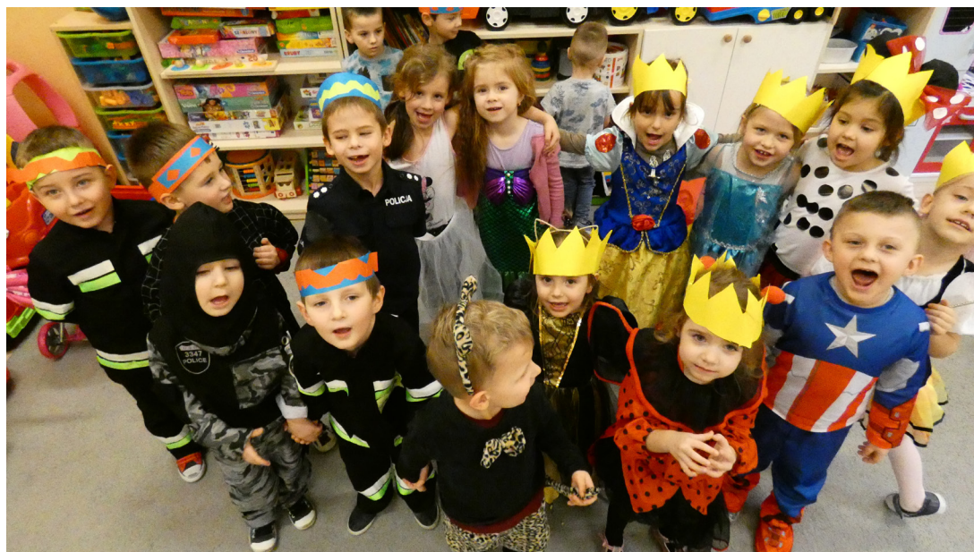
Fot. Dzieci z przedszkola w Grzęsce

tyczne wzbogacane są wizytami ciekawych gości, np. leśnicy, policjanci, adwokat, pielęgniarka, żołnierz oraz wyjazdami poza teren przedszkola. W ramach projektu „Mali odkrywcy” dzieci miały możliwość wzięcia udziału w wielu wycieczkach również finansowanych z budżetu projektu. Nasi podopieczni odwiedzili: Fabrykę Bombek w Rzeszowie, Osadę Kresową w Baszni Dolnej, obejrzały