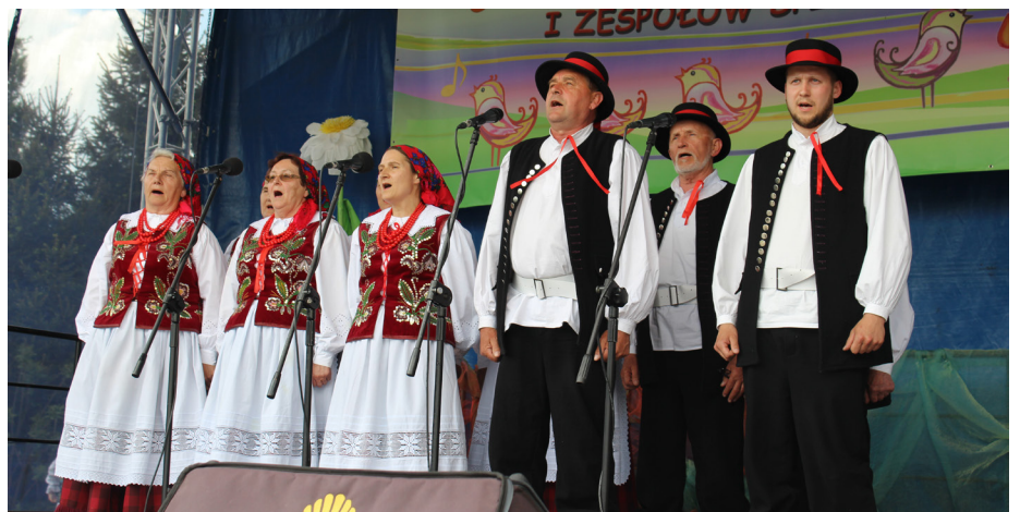
Fot. Zespół Śpiewaczy „Cantus” z Gorliczyny

który odbył się w Pawłosiowie, Zespół Śpiewaczy „Grzęszczanie” z Grzęski oraz „Studziencki” ze Studziana wyśpiewał III nagrodę. Komisja konkursowa przyznała również wyróżnienie I stopnia dla Zespołu Śpiewaczego „Cantus” z Gorliczyny oraz Zespołu Śpiewaczego działającego przy Kole Gospodyń Wiejskich w Ujeznej.