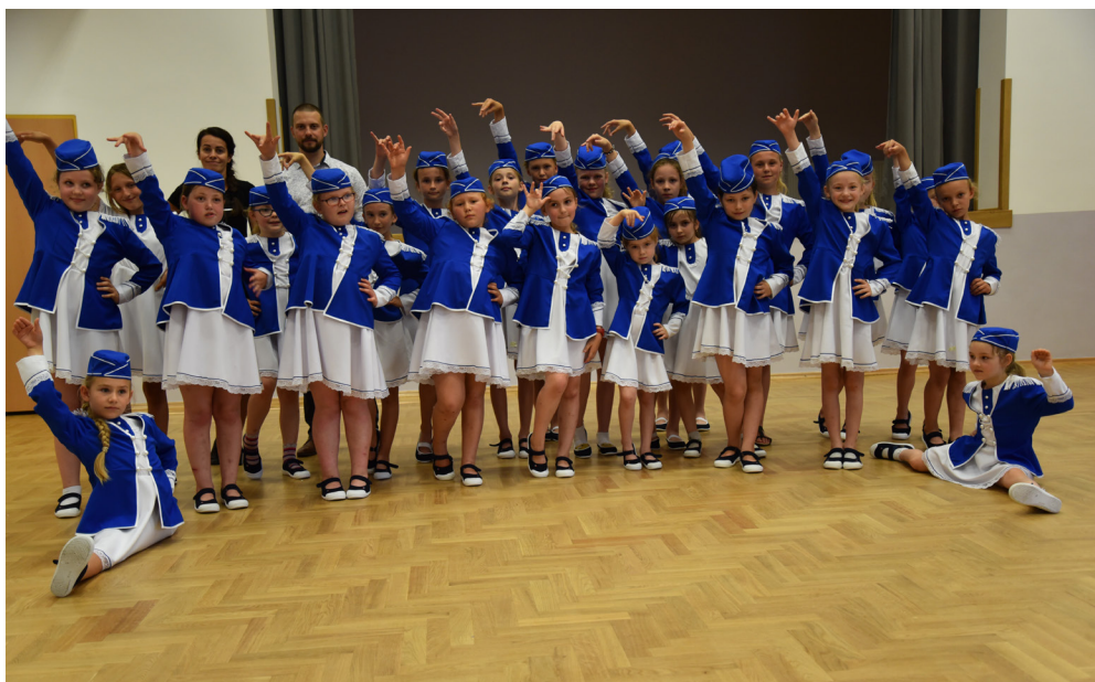
Fot. Zespół Mażoretek z Grzęski