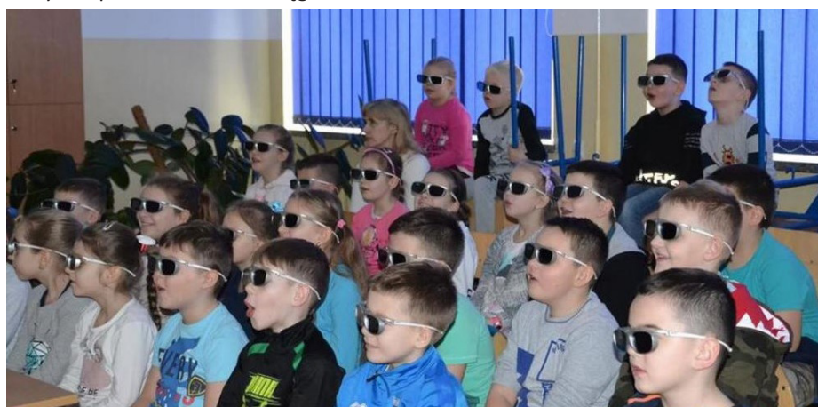
Fot. Projekcja filmu Wspaniały ocean

w Przeworsku. Dzieci aktywnie uczestniczyły w przedstawieniu „Czerwony Kapturek”, zapoznały się z działaniami proekologicznymi, które są tak ważne dla przyszłości naszej planety oraz zabrały się w łapaczy piorunów używając tzw. kuli plazmowej. Zajęcia były bardzo ciekawe, a ich różnorodność tematyczna sprawiła, że każdy mógł znaleźć coś dla siebie. Skrzynia różności stanowiła dopełnienie owocnych warsztatów, które połączyły zdobywanie nowej wiedzy ze świetną zabawą.