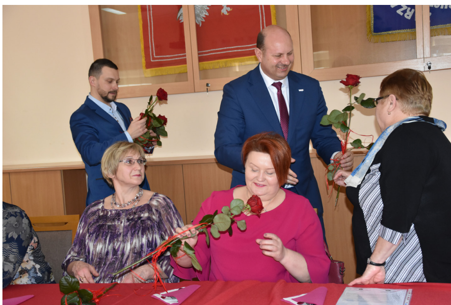
Fot. Życzenia dla naszych Pań z KGW

8 marca przedstawicielki Kół Gospodyń Wiejskich z terenu Gminy przybyły do Urzędu, by wspólnie świętować Dzień Kobiet.