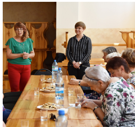
Fot. Spotkanie konsultacyjne z fryzjerką i kosmetyczką

Projekt ten jest działaniem partnerskim Fundacji na Rzecz Psychoprofilaktyki Społecznej PRO-FIL oraz Gmin Przeworsk i Dubiecko. Pozyskana na ten cel dotacja to prawie 20 tysięcy złotych.