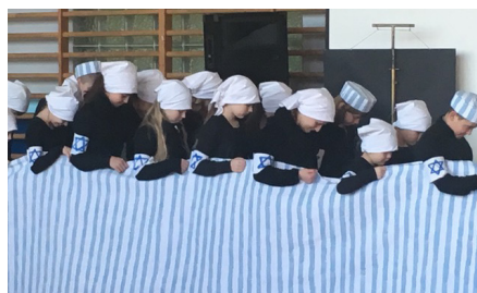
Fot. : Spektakl pt. Czynić dobro w czasie, gdy panuje zło. O Irenie Sendlerowej i nie tylko

Rok 2018 był rokiem Ireny Sendlerowej, która w czasie II wojny światowej uratowała życie tysiącom żydowskich dzieci. Wystawienie spektaklu zbiegło się również z 75. rocznicą śmierci rodziny Ulmów z Markowej oraz Narodowym Dniem Pamięci Polaków ratujących Żydów.