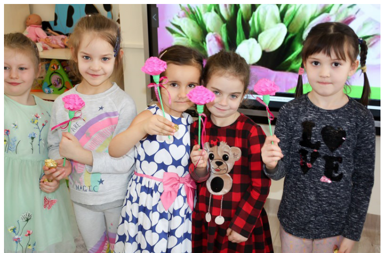
Fot. Aktywne przedszkolaki Dzień Kobiet

chowe przy muzyce podczas zajęć z rytmiki i zajęcia taneczne znacznie uatrakcyjniają pobyt dzieci w przedszkolu. Nauka poprzez zabawę wspiera całościowy rozwój dzieci, doskonali ich koordy-