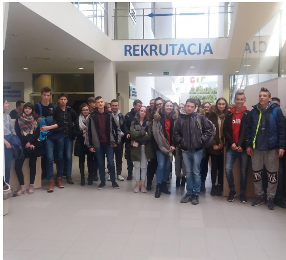
Fot. Z wizytą na Uniwersytecie Rzeszowskim