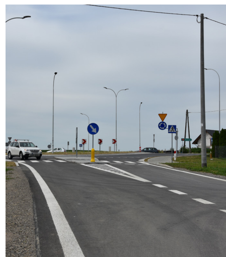
Fot. Wjazd na łącznik od strony miejscowości Gwizdaj

państwa. Gmina Przeworsk również udzieliła wsparcia finansowego przy realizacji w/w zadania z przeznaczeniem na wykonanie przejścia dla pieszych przez drogę krajową nr 94 wraz z chodnikiem w obrębie skrzyżowania budowanej drogi nr 835 z drogą krajową nr 94 w miejscowości Gwizdaj. Odbiór końcowy drogi miał miejsce 5 lipca.