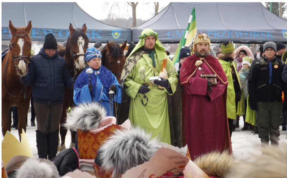
Fot. Trzej Królowie w Świętoniowej

Gorliczyna i Świętoniowa by spotkać się przy stajence na placu przy kościele pw. Matki Bożej Nieustającej Pomocy w Świętoniowej i złożyć pokłon Dzieciątku.