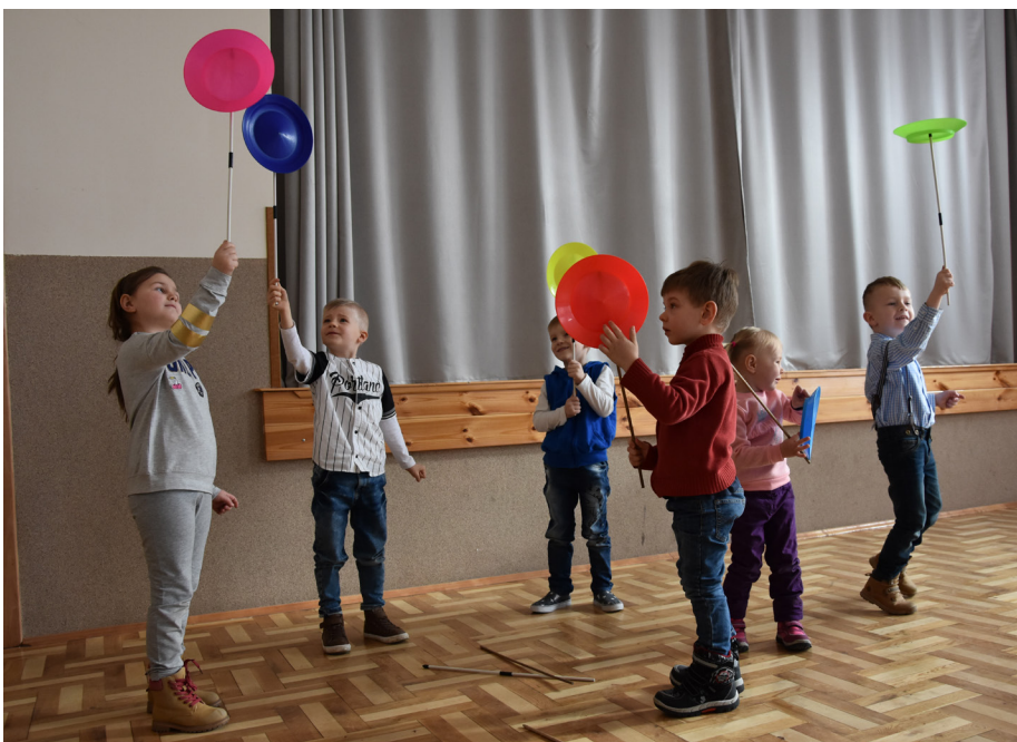
Fot. Najmłodszy spróbowali swoich sił podczas warsztatów cyrkowych

Podczas ferii najmłodszy mieli też okazję uczestniczyć w warsztatach cyrkowych, które odbywały się we wszystkich Wiejskich Domach Kultury. Uczestnicy zajęć próbowali swoich sił w żonglowaniu piłeczkami, kręceniu talerzy, wyrzucaniu obręczy, wprawianiu w ruch silikonowych jo-jo. Łącznie w warsztatach wzięło udział ponad 150 dzieci.