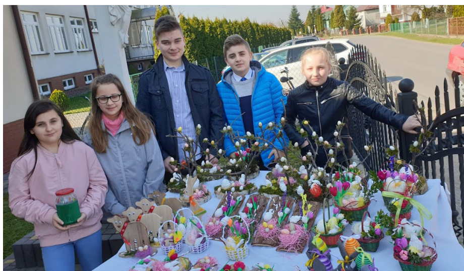
Fot. Kiermasz wielkanocny

Współpracując z mieszkańcami Chałupek, Domem Pomocy Społecznej i Kaplicą Matki Bożej Śnieżnej w Przeworsku zebraliśmy ponad 250 różańców i 700 medalików i krzyżyków, które za pośrednictwem Księży Werbistów trafiły do polskich misjonarzy w Afryce.