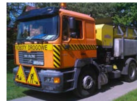
Fot. Prace remontera

W ramach systematycznej poprawy oznakowania dróg gminnych zamontowano nowe znaki drogowe oraz lustra w miejscach szczególnie niebezpiecz-