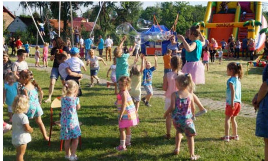
Fot. Zabawy z animatorem