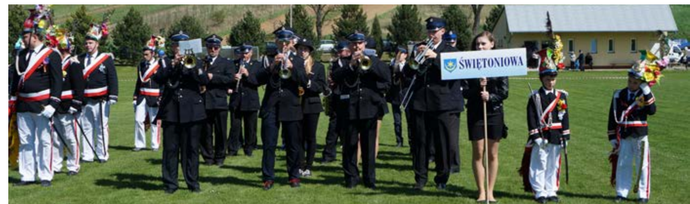
Fot. Orkiestra Dęta ze Świętoniowej podczas XI Gminnej Parady Straży Grobowych