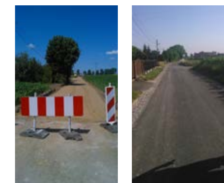
Fot. Etapy prac remontowych drogi: Grzęska Plebanka – ul. Korczaka.

wspólnej z Miastem Przeworsk drogi: Grzęska Plebanka – ul. Korczaka . Staraniem Wójta i Burmistrza remont przeprowadziło i sfinansowało Polskie Górnictwo Naftowe i Gazownictwo w ramach rekompensaty za szkody powstałe na przedmiotowej drodze w wyniku jej użytkowania podczas prowadzonych prac wiertniczych na tym terenie. Nowa nawierzchnia bitumiczna wykonana została na ok. 1300 m tej drogi . Część drogi o istniejącej nawierzchni bitumicznej zyskała nową nakładkę, na pozostałej wykonano od podstaw konstrukcję drogi i nawierzchnię bitumiczną. Wykonawcą prac było Miejskie Przedsiębiorstwo Dróg i Mostów w Rzeszowie.