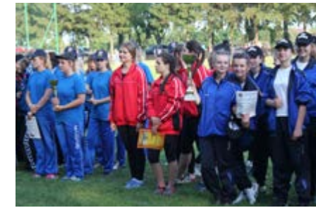
Fot. Uczestnicy zawodów