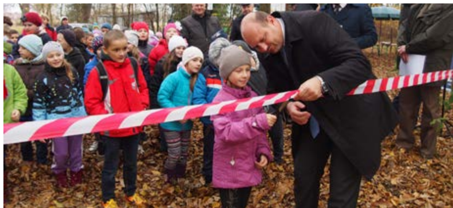
Fot. Uroczyste przecięcie wstęgi

Bieżący rok szkolny to również czas popularyzacji sztuk pięknych – teatru. W celu propagowania tej formy kultury Stowarzyszenie Przyjaciół Szkoły i szkoła realizowali projekt „Spacer z Talią i Melpomeną” w ramach programu „PZU z kulturą”. Przedsięwzięcie obejmowało kilka bezpłatnych wyjazdów na spektakle dla każdego ucznia szkoły. Po nich odbyły się lekcje teatralne dotyczące historii teatru, rodzajów lalek w teatrze lalkowym oraz animacji teatralnych. Od kilku lat Stowarzyszenie Przyjaciół Szkół w Świętoniowej i Zespół Szkół realizuje razem z przeworską