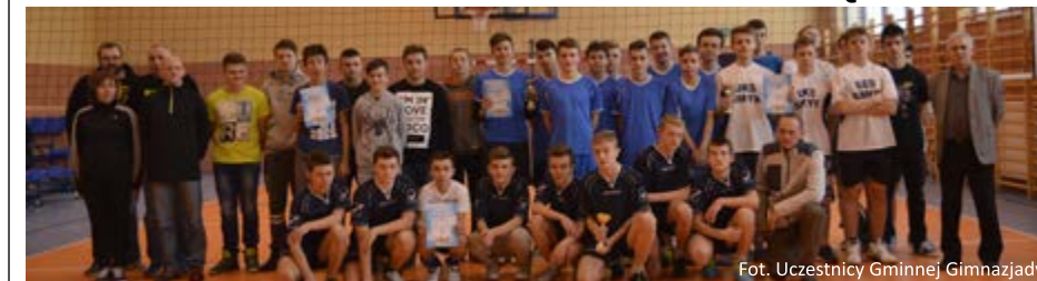
Fot. Uczestnicy Gminnej Gimnazjady