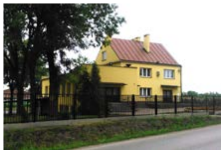
Fot. Ogrodzenie WDK w Studzianie

W Chałupkach wykonano remont garażu i pomieszczeń w budynku OSP oraz zadaszenie nad wejściami do piwnic i na parter. Łączny koszt inwestycji to 24 315,00 zł.