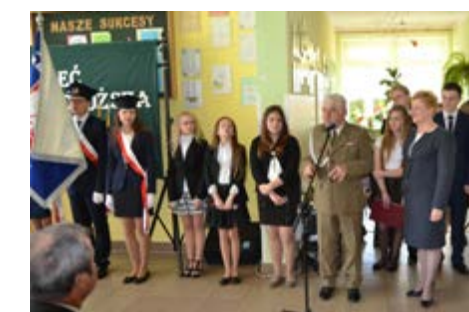
Fot. Uroczyste otwarcie Izby Pamięci

W kwietniu jako że obchodzimy Dzień Ziemi, uczniowie byli na wycieczce w pobliskim lesie, gdzie mogli podziwiać piękno przyrody, jak też przejechać się bryczką czy spróbować swoich sił w jeździe konnej. Kulminacyjnym jednak wydarzeniem, do którego długą drogę przygotowaliśmy było otwarcie Szkolnej Izby Pamięci.