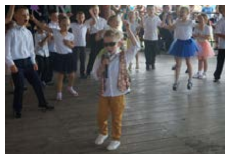
Fot. Występ artystyczny uczniów