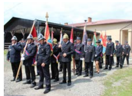
Poczty sztandarowe OSP z terenu gminy