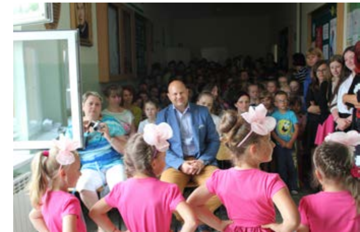
Fot. Podsumowanie Projektu Listy do Ziemi