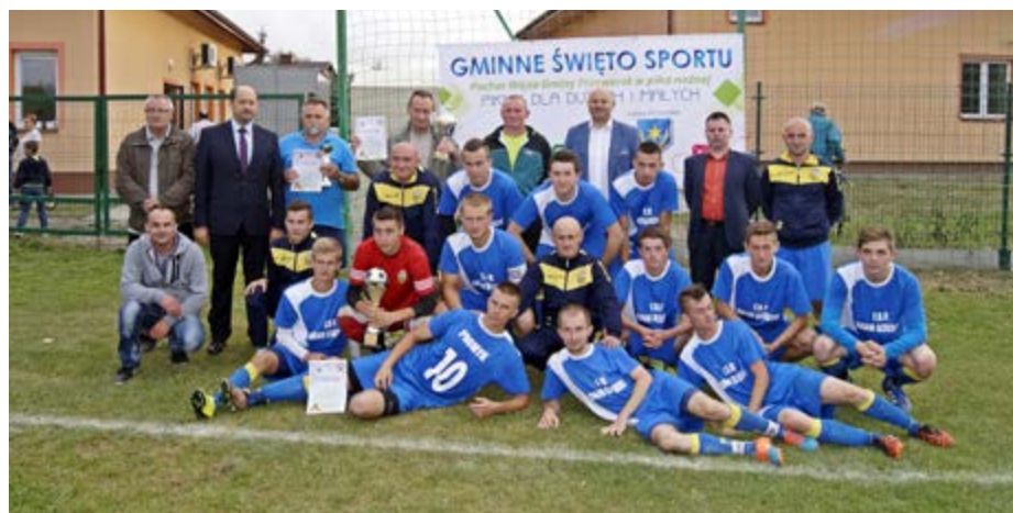
Fot. Zwycięska drużyna wraz z przedstawicielami samorządu

Dorośli również mogli spróbować swoich sił w przeciąganiu liny. Rywalizowały ze sobą drużyny: Pań z KGW