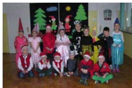
Fot. Mali aktorzy

Z okazji Dnia Babci i Dziadka Szkoła w Mirocinie zorganizowała w styczniu niezwykłą uroczystość. Była ona dniem pełnym radości, uśmiechów i wzruszeń. Dzieci przedszkolne i klas I – III pod opieką swoich pań, przygotowały piękny program artystyczny. W misternie udekorowanej sali uczniowie przedstawili swój program złożony z wierszy, piosenek oraz tańców. W ten sposób podziękowali za bezgraniczną miłość, dobroć i ciepło, jakie okazują im dziadkowie. Po części artystycznej dzieci wręczyły im upominki. Wszyscy podjęci zostali słodkim poczęstunkiem przygotowanym przez mamy. Ten wspólnie spędzony czas dostarczył uczestnikom wielu wrażeń i pozostanie na długo w pamięci.