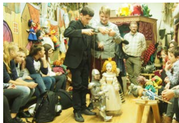
Fot. Spotkanie z teatrem