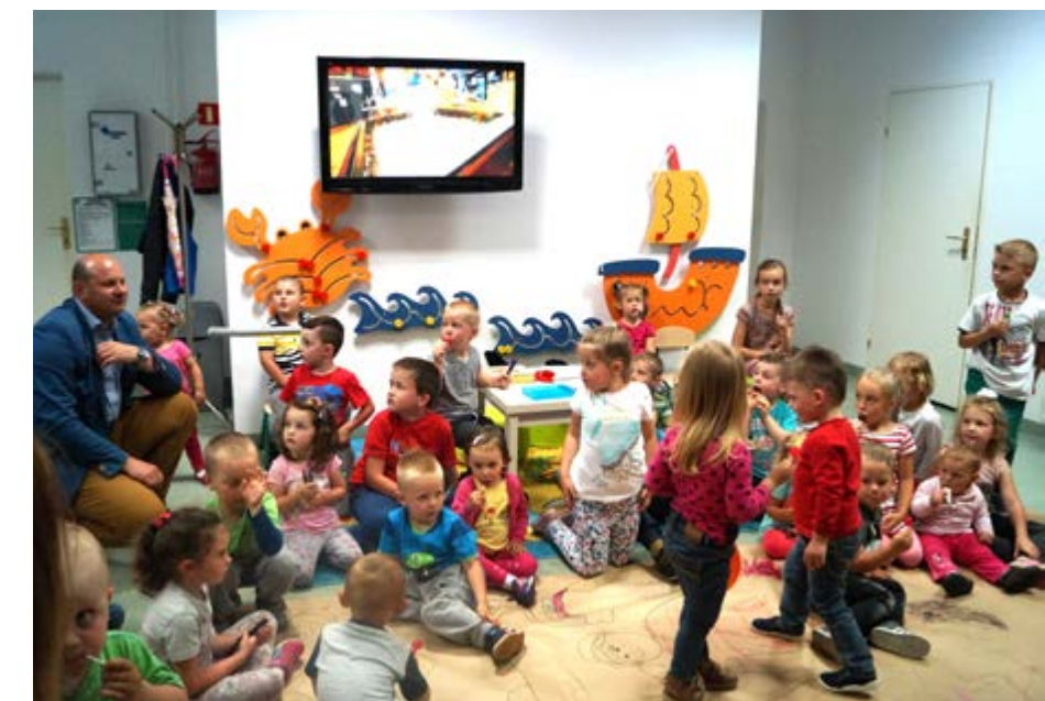
Fot. Zabawy w kąci „Wyspa Piratów”

• W marcu przedstawiciele Gminy Przeworsk uczestniczyli w wizycie studyjnej w norweskiej gminie Bodø. Nasi reprezentanci zapoznali się z systemem opieki i edukacji małych dzieci, który działa w gminie Bodø oraz zapre-