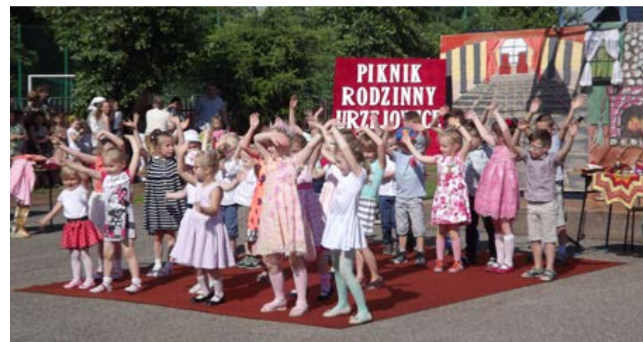
Fot. Występ artystyczny uczniów