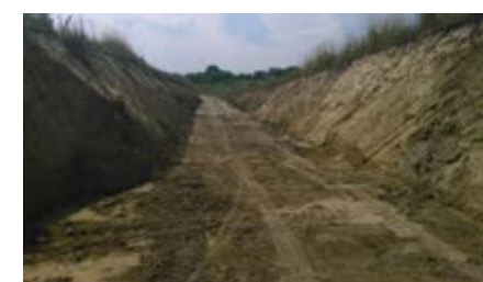
Fot. Roboty ziemne na drodze w Grzęsce

gminnych w miejscowości Mirocin ”. Wykonawcą robót w obu przypadkach jest firma Strabag. Wartość robót po przetargu: Grzęska – 433 854,89 zł, Mirocin – 118 154,67 zł . Termin realizacji inwestycji: Grzęska - 31 sierpień br., Mirocin -31 lipiec br. W chwili obecnej rozpoczęto już prace w terenie.