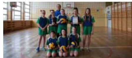
Fot. Zwycięska drużyna ze swoim trenerem

Nasi uczniowie godnie reprezentowali szkołę w licznych konkursach na szczeblu gminnym, powiatowym, czy wojewódzkim, odnosząc tam niemałe sukcesy (konkurs literacki, krasomówny, plastyczny). Także w sporcie możemy pochwalić się osiągnięciami. Drużyna dziewcząt ze szkoły podstawowej zajęła I miejsce w rozgrywkach powiatowych i zdobyła tytuł Mistrza Powiatu Przeworskiego w mini piłce siatkowej.