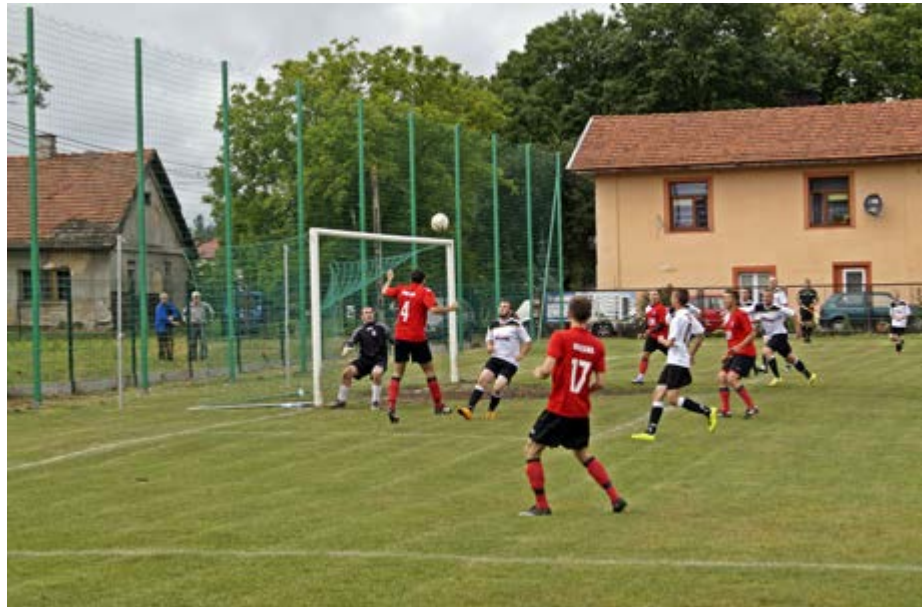
Fot. Rywalizacja w półfinale

Organizatorzy nie zapomnieli również o najmłodszych. Na dzieci czekały bezpłatne atrakcje: dmuchana zjeżdżalnia i kącik plastyczny. W przerwach między