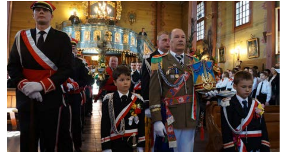
Fot. Uroczysta Msza Święta