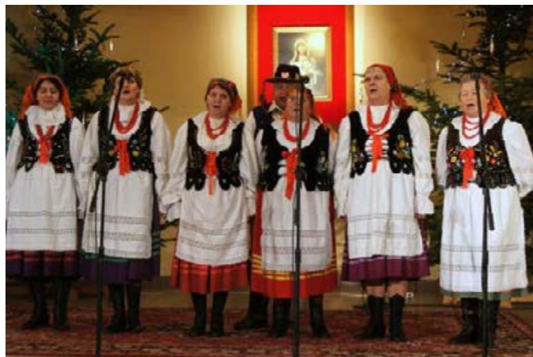
Fot. Zespół Śpiewaczy „Grzęszczanie” z Grzęski podczas XVII Regionalnego Przeglądu Grup Śpiewaczych - Kolęd i Pastorałek w Pawłosiowie, gdzie wyśpiewała I nagrodę.

Zespół Śpiewaczy „Cantus” z Gorliczyny w tym samym konkursie zdobył II nagrodę. (Fot. poniżej)