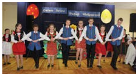
Fot. Występ taneczny uczniów

programu artystycznego uczniowie piosenką i słowem przybliżyli sylwetkę Patrona Szkoły, wprowadzając zebranych w chwilę zadumy nad słowami Ojca Świętego. Swój występ uczniowie uświetnili tańcem.