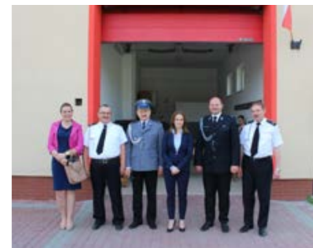
Fot. Przedstawiciele OSP i samorządu podczas uroczystego poświęcenia i oddania do użytku wyremontowanych pomieszczeń

Na potrzeby społeczności Świętoniowej wykonano remont grzybka tarczowego na kwotę 20 570,00 zł i zakupiono komorę chłodniczą do kaplicy cmentarnej za 14 000,00 zł.