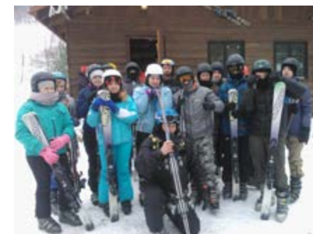
Fot. Uczestnicy wyjazdu na narty

widlowy rozwój kondycji fizycznej naszych uczniów. Dowodem tego jest ich udział w rajdach rowerowych (rowerowa pielgrzymka im. Jana Pawła II do Jodłówki), wyjazdach na narty (Puławy Dolne – stok Kiczera), zajęciach kółka wędkarskiego.