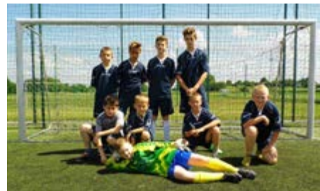
Fot. Zwycięska drużyna

• Turniej Piłki Nożnej Szkół Podstawowych rozgrywanych w ramach obchodów VIII Europejskiego Tygodnia Sportu - I miejsce