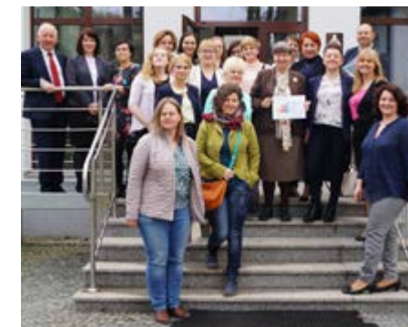
Fot. Uczestnicy Konferencji w Konstancinie-Jeziornie

zentowali, tożsame działania realizowane w naszej gminie.