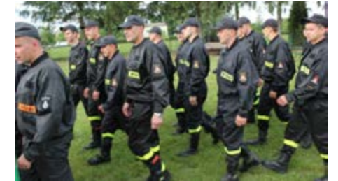
Fot. Uczestnicy zawodów

W tym momencie nie sposób też nie wspomnieć o działającej przy OSP w Świętoniowej - Orkiestrze Dętej, która uświetnia wszystkie wydarzenia Strażackie oraz gminne, wpływając w ogromnym stopniu na propagowanie działalności ochotniczych straży pożarnych.