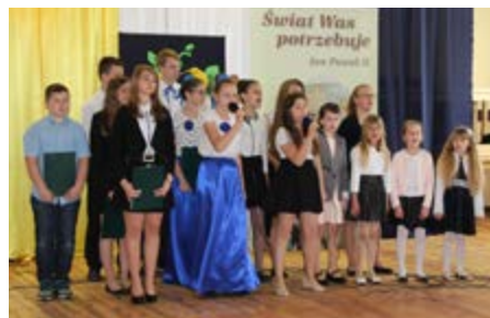
Fot. Część artystyczna