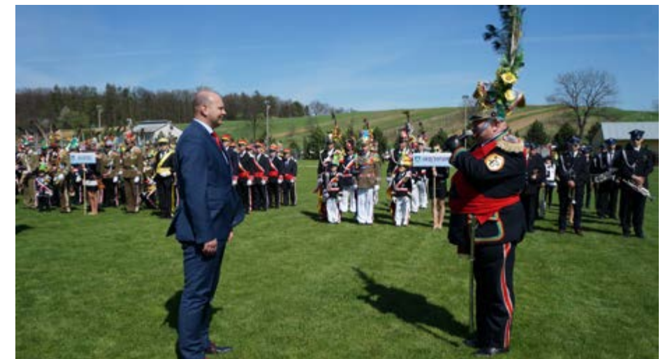
Fot. Przyjęcie meldunku