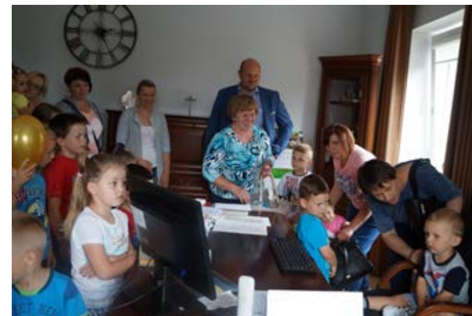
Fot. Wizyta dzieci z Grup Zabawowych w Urzędzie Gminy