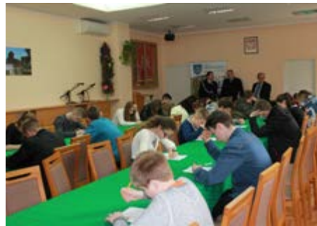
Fot. Młodzież w trakcie testu

W marcu po raz kolejny odbyły się Gminne Eliminacje Ogólnopolskiego Turnieju Wiedzy Pożarniczej „Młodzież zapobiega pożarom” . Celem konkursu jest zainteresowanie dzieci i młodzieży tematyką związaną z pożarnictwem, popularyzowanie przepisów i kształtowanie umiejętności w zakresie ochrony ludności, ekologii, ratownictwa i ochrony przeciwpożarowej. W turnieju wzięła udział młodzież w dwóch grupach wiekowych: uczniowie szkół podstawowych i gimnazjalnych. Z każdej z grup komisja konkursowa wyłoniła po trzech zwycięzców: