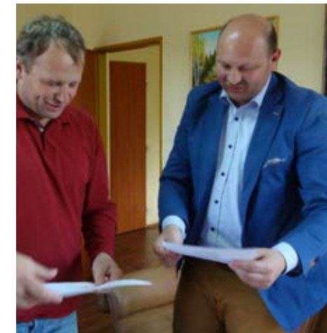
Fot. Włodarze Gmin podczas analizy umów współpracy partnerskiej