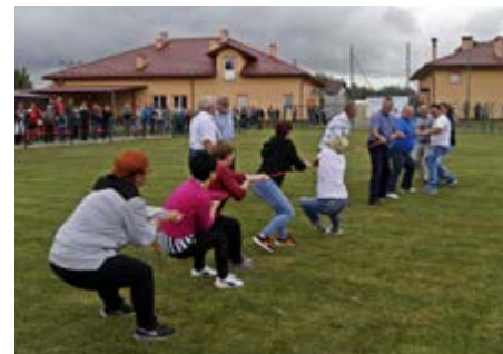
Fot. Przeciąganie liny

w Urzejowicach, drużyna Urzędu Gminy Przeworsk, rolnicy z Urzejowic oraz sołtysi z terenu gminy.