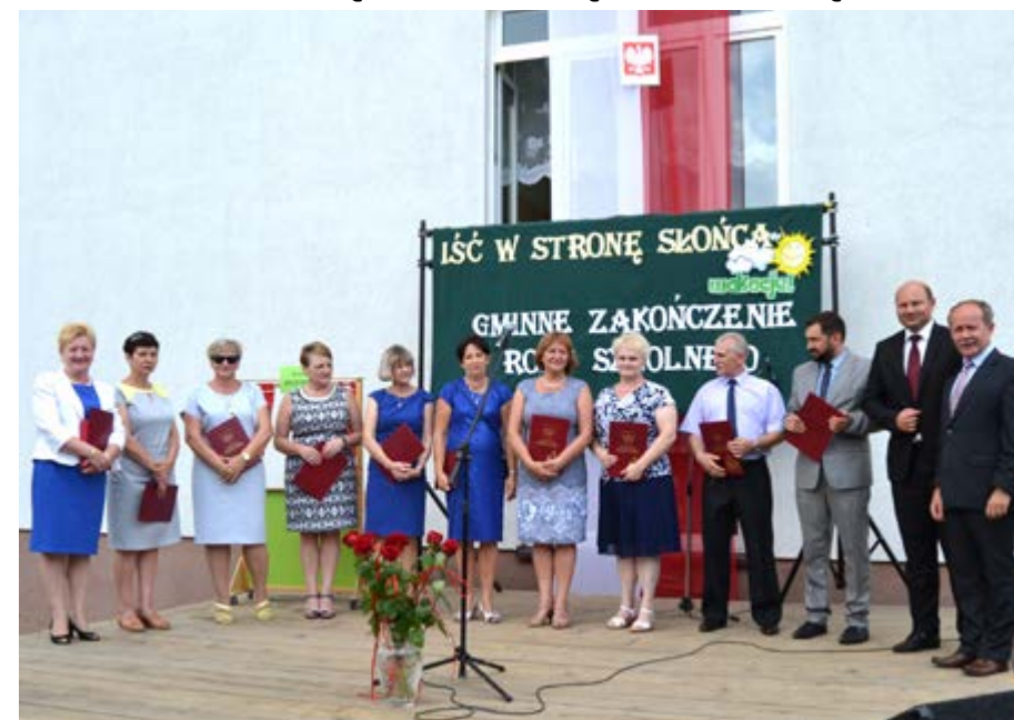
Fot. Dyrektorzy szkół i przedstawiciele samorządu gminy

Zespół Szkół w Ujeznej jako placówka oświatowa nie tylko pragnie wypożyczyć każde dziecko w wiedzę i umiejętności umożliwiające wszechstronny jego rozwój, ale też zapewnić mu udział w ciekawych spotkaniach, wydarzeniach szkolnych i pozaszkolnych.