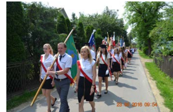
Fot. Poczty sztandarowe podczas Gminnego zakończenia roku szkolnego w Ujeznej