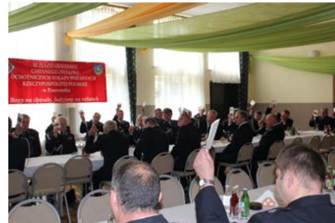
Fot. XI Zjazd oddziału Gminnego Związku Ochotniczych Straży pożarnych RP w Przeworsku