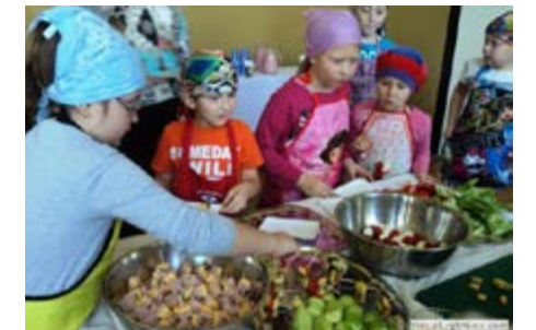
Fot. Warsztaty kulinarne