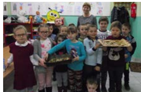
Fot. Warsztaty biblioteczne

W wielu mieszkańcach naszej gminy drzemią ciekawe umiejętności i talenty warte promowania. Biblioteki stwarzają możliwość pochwalenia się tym, w czym jesteśmy dobrzy i zaprezentowania szerszej publiczności swojej