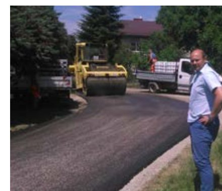
Fot. Remont drogi w Mirocinie

Rozstrzygnięto przetargi i wybrano wykonawcę na realizację zadań drogowych pn: „Remont drogi gminnej nr 110808R na działkach nr ewid. 2425 i 2427 w miejscowości Grzęska od km 0+010 – km 2+059 oraz „Remont dróg