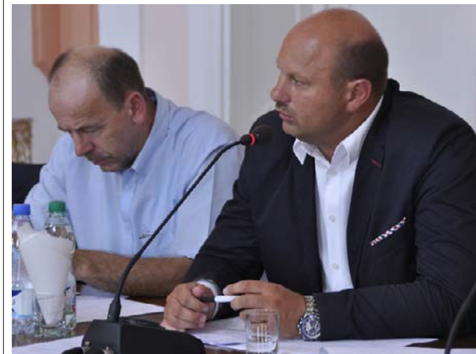
Fot. Obrady MOF

Funkcjonowanie Lokalnych Grup Działania jest znane już z poprzedniej unijnej perspektywy finansowej. Te utworzone w całym kraju na bazie gmin wiejskich stowarzyszenia przyniosły wiele pozytywnych zmian dla obszarów wiejskich. Pozwalały na realizację przedsięwzięć wspierających rolników w kierunku poszukiwania pozarolniczych źródeł dochodu, na tworzenie i rozwój mikroprzedsiębiorstw. W znakomitej większości skierowane były jednak do samorządów dając szansę na działania inwestycyjne i społeczne oraz dla stowarzyszeń, które miały możliwość realizować swoje ambicje i zamierzenia statutowe z funduszy zewnętrznych.