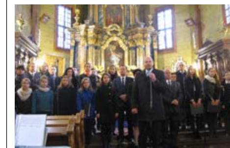
Fot. Koncert Pieśni Patriotycznych

Lekcja historii zorganizowana w szkole z udziałem grupy „Rekonstrukto” z Lublina przybliżyła dzieciom czasy imperium rzymskiego. Młodzi uczniowie samodzielnie próbowali sił w przygotowywaniu przedstawień i inscenizacji, na które zapraszali kolegów, rodziców a także przedszkolaki z miejscowej Ochronki św. Józefa. Starsi przygotowywali stojące na wysokim poziomie akademie patriotyczne i projekty, prezentując je w szkole a także przed społecznością lokalną. Zorganizowany w kwietniu Dzień Ziemi i Zdrowia uświadomił wszystkim, jak ważne jest przestrzeganie zdrowego trybu życia, aby uchronić się przed podstępными chorobami cywilizacyjnymi, np. cukrzycą. Prężnie działał też szkolny radiowęzeł. Samorząd uczniowski na długich przerwach umiał czas nadając popularną wśród uczniów muzykę.