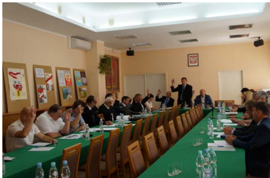
Fot. Rada Gminy Przeworsk podczas głosowania