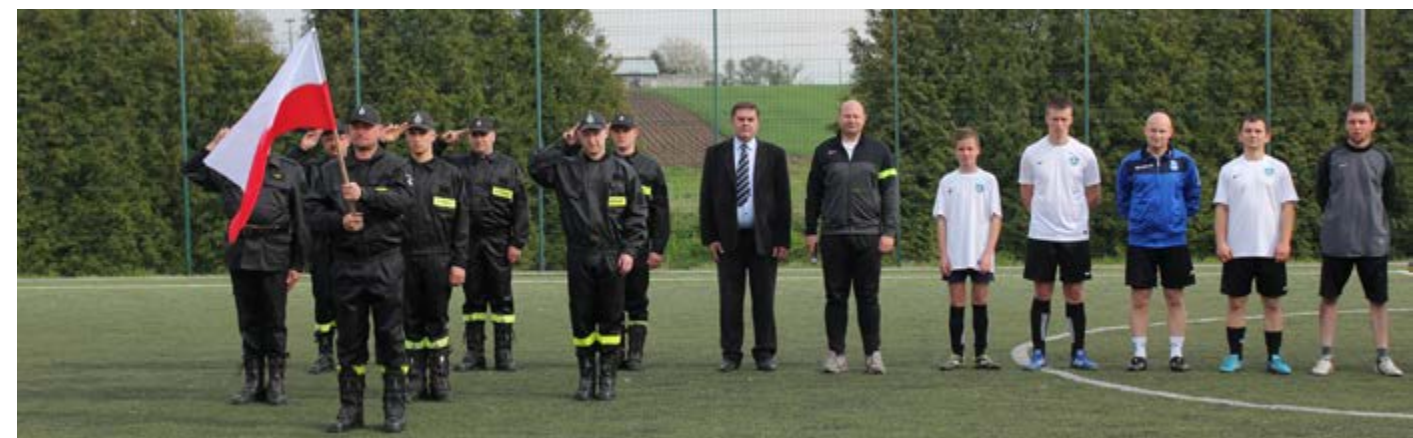
Fot. Turniej sportowy z okazji Dnia Flagi RP w Studzianie