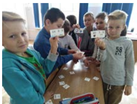
Fot. Matematyczne zmagania

Ważnym przedsięwzięciem poszerzającym horyzonty, budzącym kreatywność uczniów i rozwijającym zainteresowania było zorganizowanie przez nauczycieli języka niemieckiego i angielskiego Europejskiego Dnia Języków Obcych oraz przez nauczycieli matematyki Światowego Dnia Tabliczki Mnożenia. Uczniowie zauważyli, że uczyć się można w gronie kolegów, wspólnie dzieląc się pomysłami i radością płynącą z przyjaźni.