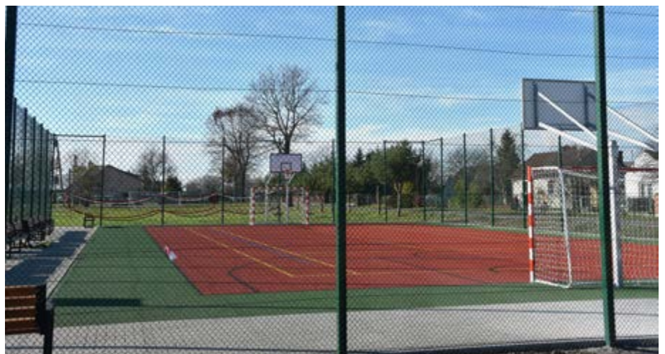
Fot. Wielofunkcyjne boisko sportowe w Chałupkach