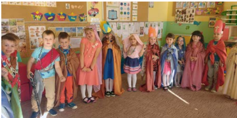
Fot. Uczestnicy balu

się dobrze zachowywać. Ponadto co tydzień wybierany jest przez dzieci Mistrz Dobrego Zachowania, któremu wręczany jest medal. Podczas dalszej pracy z programem przedszkolaki wspólnie z rodzicami poznały historię swoich świętych i błogosławionych patronów. Przed Uroczystością Wszystkich Świętych w dniu 30 października 2019 roku na zajęciach otwartych „Bal wszystkich świętych” zjawili się ich rodzice, dziadkowie i rodzeństwo. Dzieci były pięknie przebrane za świętych i błogosławionych. Każde z nich odważnie zaprezentowało, kim jest jego patron. Nie zabrakło też opowieści o Bracie Albercie, oglądania prac plastycznych dzieci związanych z Uroczystością Wszystkich Świętych oraz tańców przy muzyce zespołu „Arka Noego”. Program „Od dobrego zachowania do mądrego pomagania – naśladujemy Świętego Brata Alberta” będzie kontynuowany. Następne ośrodki tematyczne to spotkania: z żołnierzem, malarzem, siostrą zakonną, a także z członkami Szkolnego Koła Caritas. Planowana jest również wycieczka do Domu Pomocy Społecznej oraz przygotowanie występu na uroczystość Patrona Szkoły.