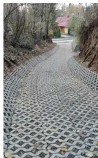
Fot. Droga dojazdowa w Nowosielcach