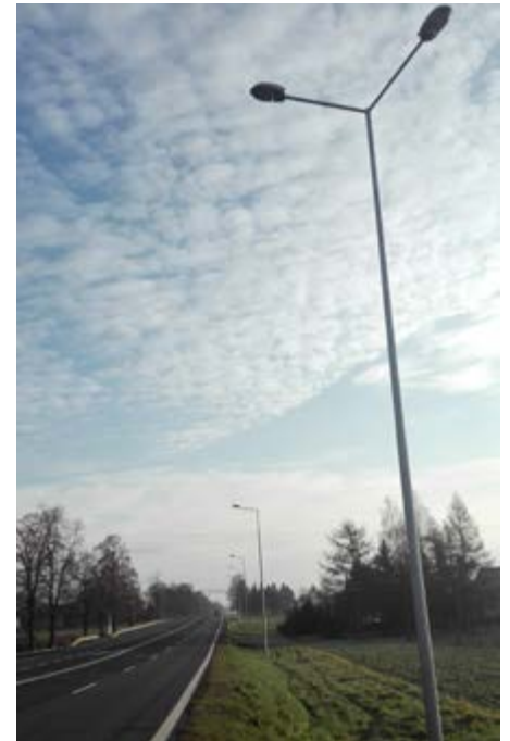
Fot. Oświetlenie uliczne w Gwizdaju