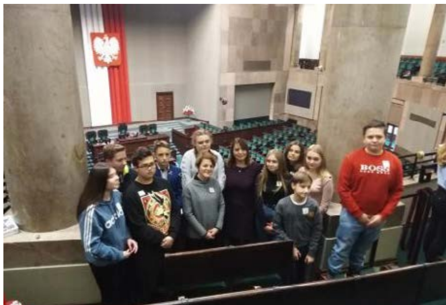
Fot. W sali plenarnej Sejmu

Jesteśmy bardzo wdzięczni i zadowoleni, dziękujemy Pani Poseł za zaproszenie.