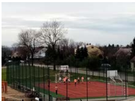
Fot. Zajęcia sportowe na nowym boisku

I oto nadszedł dzień, który na długo zostanie w pamięci społeczności szkolnej. Od października jest możliwość skorzystania z boiska wielofunkcyjnego, które powstało niedaleko szkoły i ma służyć zarówno uczniom jak i wszystkim mieszkańcom wioski. Boisko zostało już przetestowane przez dzieci i młodzież, a radość i emocje były nie do opisania. Inwestycja pozwoli rozwinąć możliwości naszych uczniów, którzy na co dzień korzystają z zastępczej sali gimnastycznej.