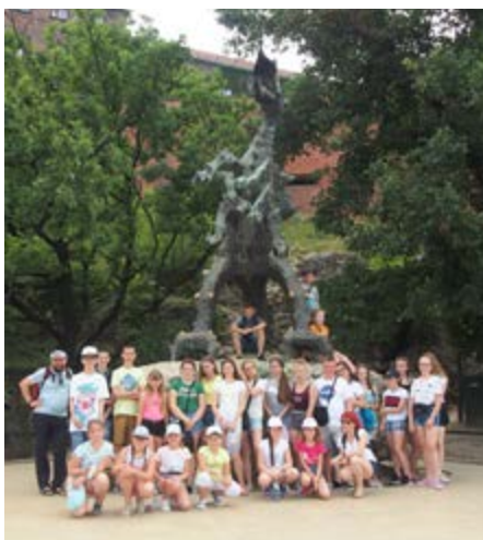
Fot. Z wawelskim smokiem

W tym roku 27 czerwca blisko 30 uczniów z naszej szkoły wyjechało do Krakowa. Całość przedsięwzięcia finansowana jest przez Stowarzyszenie Przyjaciół Szkoły w Świętoniowej, Radę Rodziców i Szkołę. Zwiedzanie królewskiego miasta rozpoczęliśmy od wizyty na Wawelu, później Traktem Królewskim udaliśmy się do Sukiennic - tam w Muzeum Narodowym mieliśmy okazję zobaczyć monumentalne dzieła Jana Matejki, Siemiradzkiego, Chełmońskiego, Podkowińskiego i wielu innych malarzy polskich XIX wieku. Przed po-