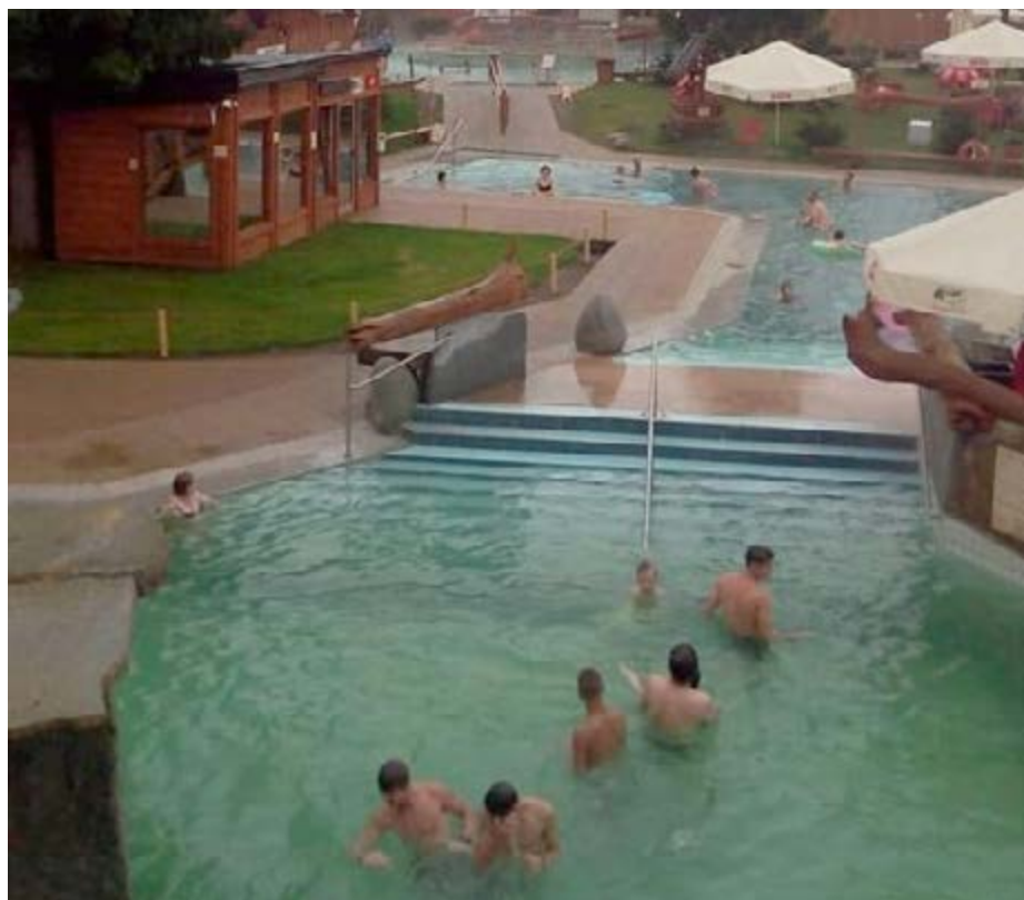
Fot. Zasłużony czas na odpoczynek rodzin w Zakopanem i okolicy

W grudniu zakończyła się realizacja projektu „Niebieskie motyle – kompleksowo naprzeciw potrzebom rodzin z dziećmi z autyzmem i zespołem Aspergera”. Projekt w ramach Programu „Od zależności ku samodzielności” realizujemy już po raz drugi, dzięki dotacji z Ministerstwa Rodziny, Pracy i Polityki Społecznej. Bardzo wysoka ocena naszych działań, która przekłada się na otrzymane wsparcie podyktowana jest lokalnymi potrzebami. Podobnie jak w roku ubiegłym w projekcie zakładano udział 16 dzieci i ich rodzin. W trakcie rekrutacji okazało się, że zakres potrzeb jest większy. Docelowo w projekcie wzięło udział 22 dzieci wraz z bliskimi. Za nami intensywne działania: cykl szkoleń i warsztatów dla dzieci i osób dorosłych, grupa wsparcia oraz niezapomniany 3-dniowy wyjazd do Zakopanego i wzruszający cykl spektakli dla mieszkańców.