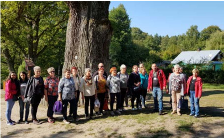
Fot. Uczestnicy wizyty

Dzięki uprzejmości i współpracy z Podkarpackim Regionalnym Ośrodkiem Wsparcia Ekonomii Społecznej w Przemyślu grupa aktywnych osób z Gminy Przeworsk uczestniczyła w wizycie studyjnej w Józefowie. Celem wyjazdu było zapoznanie się z działalnością spółdzielni socjalnych funkcjonujących w Gminie Józefów.