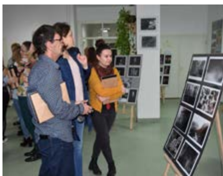
Fot. Uczestnicy projektu podczas finału