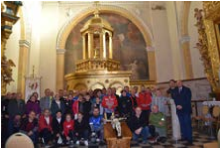
Fot. Uczestnicy Rajdu Rowerowego „Szlakiem Bożogrobców”