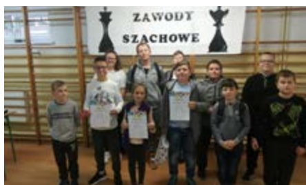
Fot. Nasi Mistrzowie

To nie wszystkie sukcesy naszej szkoły od lat już na terenie gminy Przeworsk i powiatu przeworskiego brylujemy w szachach. 9 października w Chałupkach odbyły się Gminne zawody szachowe w kategorii dziewcząt i chłopców. Naszą szkołę reprezentowały wszystkie roczniki klasy 1-3, 4-6 i 7-8. Oczywiście sukcesem naszej szkoły, było wywalczenie pierwszych miejsc w roczniku 7-8 i 1-3, natomiast klasy 4-6 zajęły miejsce II, co dało naszej szkole awans na zawody powiatowe.