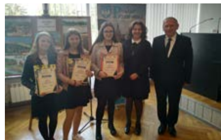
Fot. Uczennice kl. VIII na finale Wojewódzkiego Konkursu Plastycznego