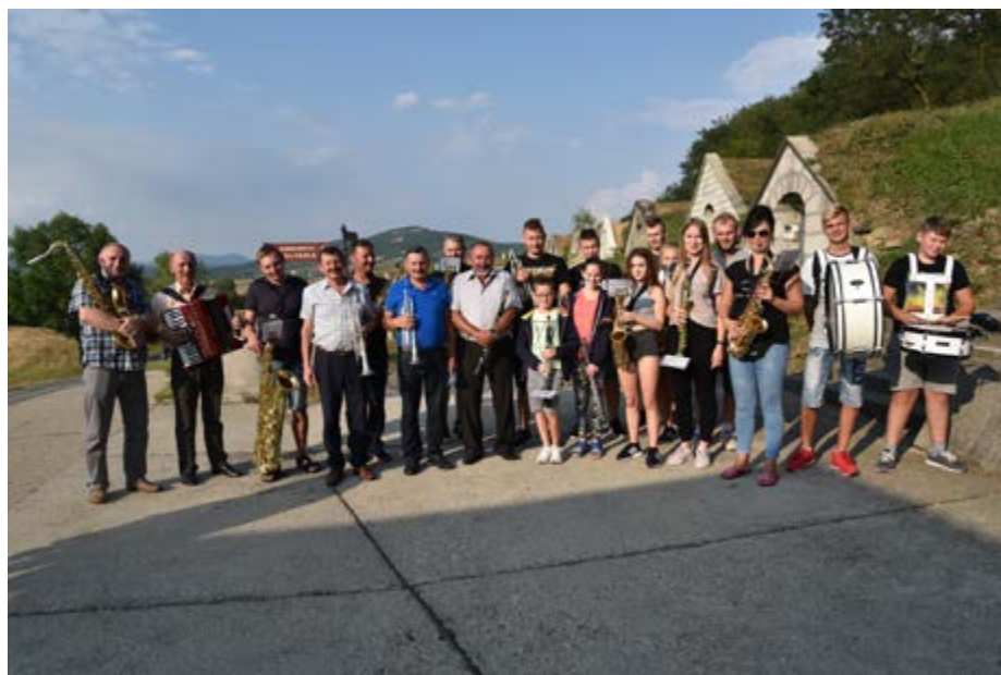
Fot. Orkiestra Dęta Gminy Przeworsk z siedzibą w Świętoniowej

Orkiestra Dęta Gminy Przeworsk z siedzibą w Świętoniowej wraz z delegacją Gminy Przeworsk podczas minionego weekendu zwiedzała piękne miejscowości północno-wschodnich Węgier. W programie wycieczki zorganizowanej przez Gminny Ośrodek Kultury w Przeworsku znalazły się Koszyce, Eger, Tiszaujvaros oraz Tokaj.