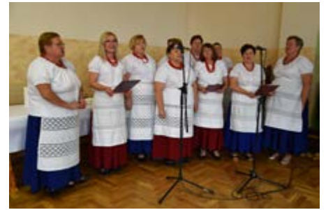
Fot. Występ reaktywowanego Zespołu Śpiewaczego „Ujeźniacy” z Ujeźnej

Dla przybyłych gości występ artystyczny zaprezentowali uczniowie Szkoły Podstawowej w Ujeźnej, którzy poczęstowali wszystkich symbolicznymi pieczonymi ziemniakami. Z muzycznym akcentem zaprezentowało się Koło Gospodyń Wiejskich z Ujeźnej oraz Zespół Śpiewaczy „Ujeźniacy”.