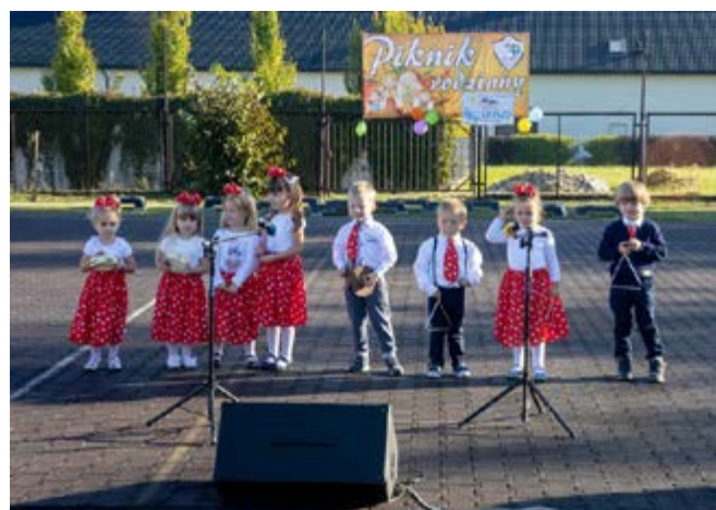
Fot. Piknik Rodzinny w Gorliczynie

muzycznych i tanecznych oraz słodycze. Po części artystycznej był czas na zabawę z wodzirejem i liczne atrakcje tj. dmuchaną zjeżdżalnię, trampoliny, malowanie twarzy, pokazy robotyki. Nie zabrakło również atrakcji przygotowanych przez Policjantów z Komendy Powiatowej Policji w Przeworsku i Straż Pożarną. Podczas pikniku można było spróbować pyszności przygotowanych przez rodziców - kiełbaski z grilla, pie-