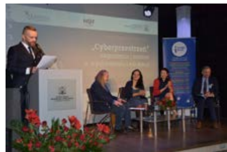
Fot. Panel dyskusyjny