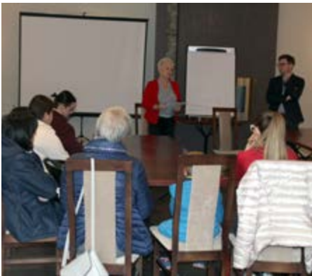
Fot. Spotkanie informacyjno - integracyjne w ramach projektu

W projekcie uczestniczy 60 osób. Ma on na celu jest zwiększenie dostępu osób dorosłych i dzieci, w tym osób niepełnosprawnych do usług środowiskowych, opiekuńczych oraz usług wsparcia rodziny.