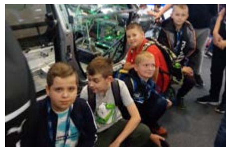
Fot. Nasze dzieci na Podkarpackim Festiwalu Nauki - Jasionka 2019