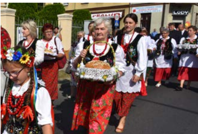
Fot. Bochny chleba, niesione przez Przewodniczące Kół Gospodyń Wiejskich z Gminy Przeworsk