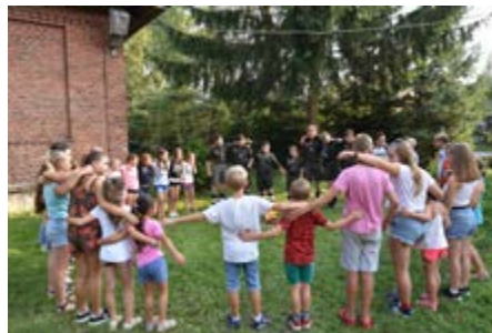
Fot. Piosenki, gry i zabawy animacyjne z harcerzami

Na zakończenie wakacji odbyło się ognisko harcerskie w Rozborzu. Grupa dzieci i młodzieży z Gminy Przeworsk miała możliwość poznać obrzędy i zwyczaje harcerskie. W iście harcerski klimat uczestników wprowadzili druhowie przeworskich drużyn Związku Harcerstwa Rzeczypospolitej. Były wspólne śpiewy, piosenki, gry i zabawy animacyjne oraz pyszne kiełbaski. Wspólnym śpiewem przy ognisku zakończyliśmy wspaniałą, wakacyjną przygodę. Dziękujemy wszystkim uczestnikom „Wakacji z GOK 2019” i zapraszamy za rok!