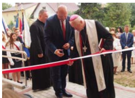
Fot. Uroczyste przecięcie wstęgi