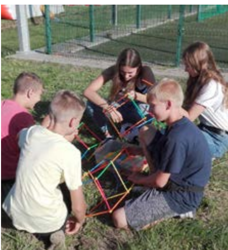
Fot. Uczestnicy kampanii podczas Gminnych Dożynek w Studzianie

Projekt obejmował 8 kampanii informacyjno – edukacyjnych z profilaktyki przeciwdziałania alkoholizmowi i uzależnieniom w formie zabaw i konkursów z nagrodami w 4 gminach: Przeworsk, Dubiecko, Pruchnik i Wielkie Oczy. W każdej Gminie aktywny