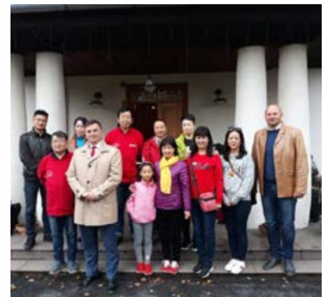
Fot. Delegacja z Chin

Nasi goście mieli okazję poznać naszą kulturę oraz kuchnię podczas kolacji w Ujeznej, którą przygotowało tutejsze Koło Gospodyń Wiejskich. Dziękujemy za wspaniałe spotkanie oraz przemiłą atmosferę.