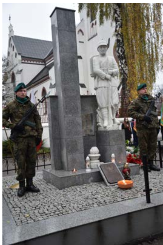
Fot. Gminne Obchody Jubileuszu 101. Rocznicy Odzyskania Niepodległości przez Polskę przy Pomniku Hallerczyka - Żołnierza Odrodzonej Polski