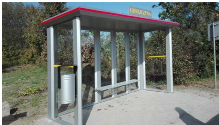
Fot. Przystanek autobusowy w Gorliczynie

W Mirocinie z Funduszu Dróg Samorządowych wykonany został remont