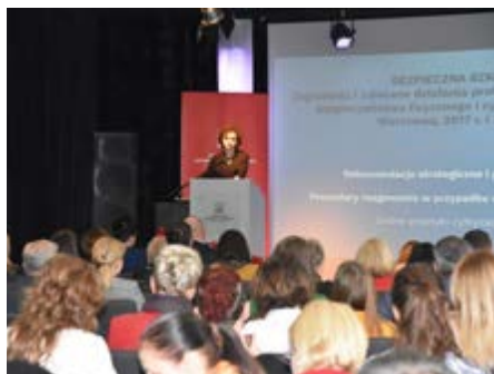
Fot. O profilaktyce