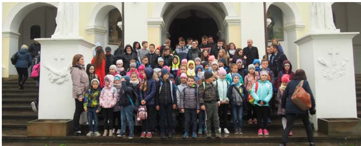
Fot. Uczestnicy pielgrzymki

Możliwość uczczenia pamięci patrona w tak niepowседневny sposób to wielkie wyróżnienie.