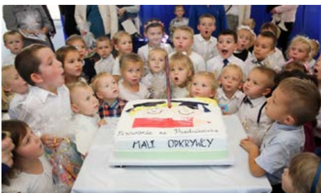
Fot. Pasowanie na przedszkolaka