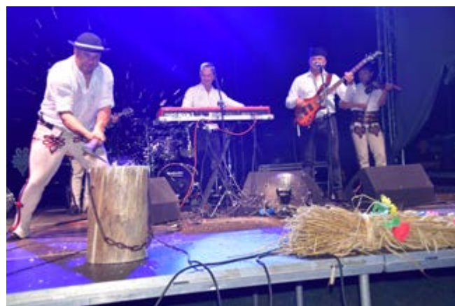
Fot. Gwiazda wieczoru, „Zespół Baciary”