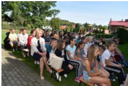
Fot. Dzieci ze Szkoły Podstawowej w Urzejowicach

„Narodowego Czytania” 2019 roku to już ósma odsłona ogólnopolskiej akcji mającej na celu promowanie największych arcydzieł literatury polskiej. W tym roku wydarzenie, którego patronem jest Para Prezydencka, odbyło się pod hasłem „8 lektur na ósme Narodowe Czytanie” i przybliżyło nowele takich autorów jak Eliza Orzeszkowa, Maria Konopnicka, Bolesław Prus, Bruno Szulc, Władysław Reymont, Stefan Żeromski, Henryk Sienkiewicz czy Henryk Rzewuski.