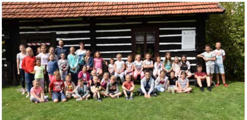
Fot. Z wizytą w Zagrodzie Garncarskiej w Medyni Głogowskiej