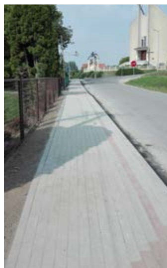
Fot. Chodnik w Mirocinie