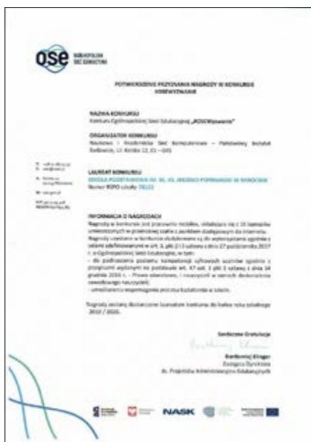
Fot. Potwierdzenie otrzymanej nagrody

Szkoła Podstawowa w Mirocinie została laureatem Konkursu Ogólnopolskiej Sieci Edukacyjnej „#OSEWyzwanie” zdobywając nagrodę jaką jest mobilna pracownia multimedialna, dzięki której szkoła będzie mogła prowadzić cyfrowe lekcje, a uczniowie będą korzystał z internetowych zasobów edukacyjnych. Udział w konkursie mogły wziąć szkoły z miejscowości liczących do 50 tysięcy mieszkańców. Kolejne warunki, które należało spełnić to zgłoszenie się szkoły do projektu OSE i programu mLegitymacja szkolna. Dodatkowo szkoła mogła przysłać przygotowaną specjalnie na konkurs pracę plastyczną pt. „Smart szkoła”. Szansę na wygraną zwiększała również deklaracja zgłoszenia się szkoły do programów OSE Hero oraz CodeWeek.