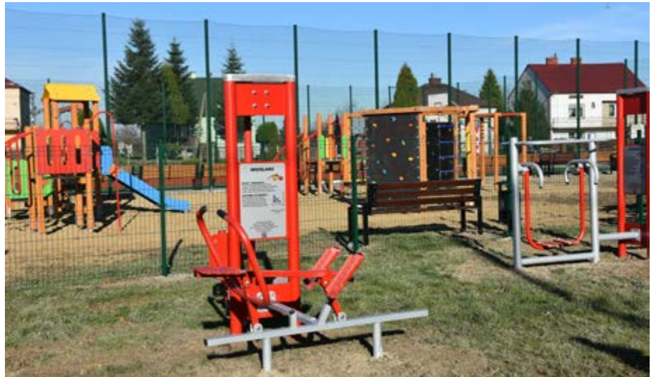
Fot. Otwarta Strefa aktywności wraz z placem zabaw w Chałupkach

Gmina Przeworsk w bieżącym roku pozyskała środki zewnętrzne, na rozwój infrastruktury sportowo-rekreacyjnej i w ramach dotacji wykonano dwie Otwarte Strefy Aktywności w miejscowości Chałupki i Nowosielce. W miejscowości Chałupki powstała siłownia zewnętrzna, plac zabaw oraz strefa relaksu. Całość została ogrodzona ogrodzeniem panelowym. W Nowosielcach natomiast powstała siłownia zewnętrzna wraz z strefą relaksu. Na realizację zadania uzyskano dofinansowanie ze środków ze środków Ministerstwa Sportu i Turystyki w kwocie 75 tys. zł, całkowita wartość robót to 142 194,15 zł.