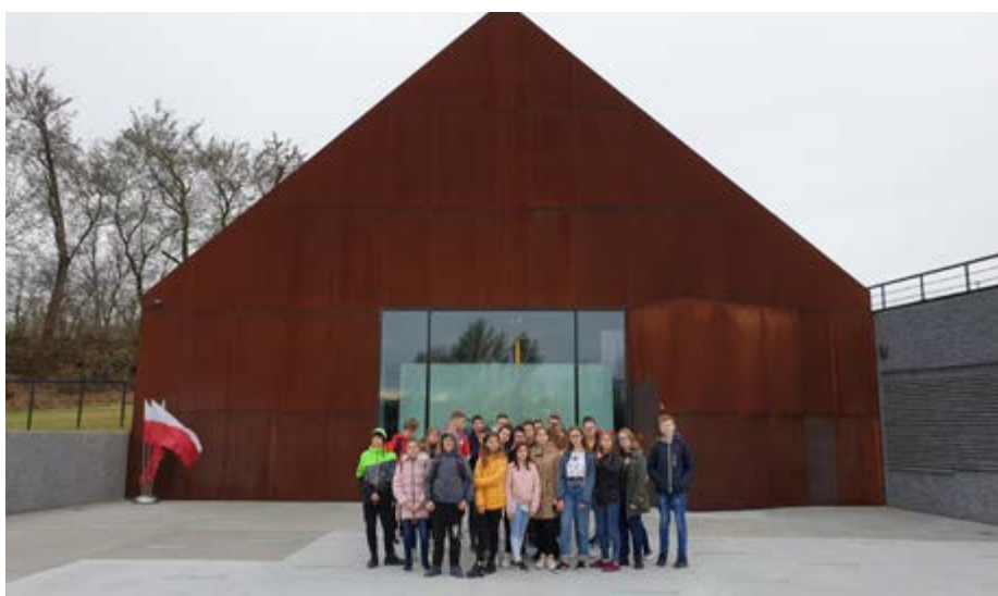
Fot. Uczniowie SP w Chałupkach przed Muzeum Polaków Ratujących Żydów im. Rodziny Ulmów w Markowej

Znakomite wnętrza mieszkalne i spacer ścieżkami malowniczego parku w Łańcucie sprawiły, że dane nam było zobaczyć luksus Lubomirskich i poznać historię ich rodu.