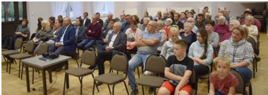
Fot. Projekcja filmu „Nie sądzić”