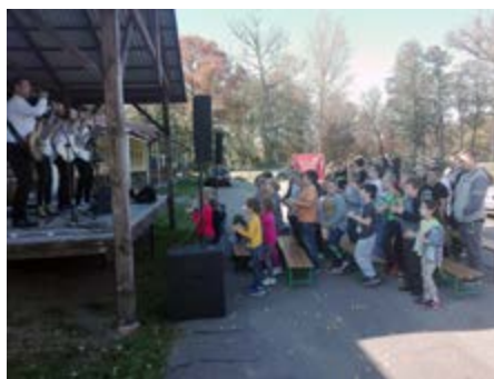
Fot. Występ muzyczny

16 października w naszej szkole gościli muzycy ze Szkoły Muzyki Rozrywkowej „Muzyczny Świat” w Przeworsku, którzy w ciągu dwóch godzin bawili uczniów śpiewem i muzyką. W pierwszej części spotkania odbyły się warsztaty muzyczne poświęcone nauce śpiewu. Uczniowie „ćwiczyli gardła” przy piosence „Nie bój się chcieć” z filmu „Zwierzogród”. Na drugą część wizyty muzyków składał się koncert na grzybku WDK. Przy słonecznej pogodzie, na świeżym powietrzu z przyjemnością słuchało się najnowszych hitów w wykonaniu młodych, utalentowanych ludzi. Muzycy również przekazali wiele cennych informacji na temat budowy i funkcji poszczególnych instrumentów