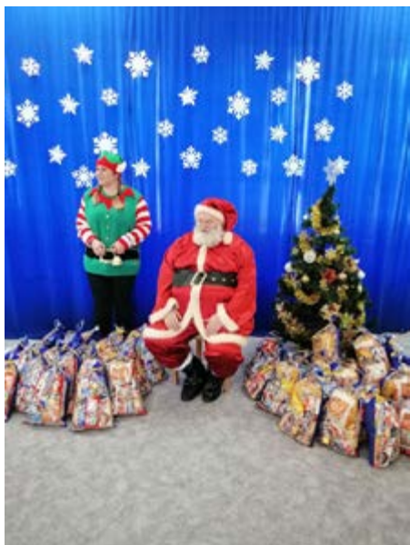
Fot. Uroczyste „Mikołajki”

Kolejną kontynuacją projektu na którego realizację pozyskano dotację z Ministerstwa Rodziny, Pracy i Polityki Społecznej jest „Mam tę moc – edycja II”. To także najwyższa w skali kraju kwota finansowa przyznana Gminie Przeworsk wraz z rekomendacją Wojewody Podkarpackiej do „dobrych praktyk” MRPIPS dla innych samorządów w kraju. Dotacja w wysokości 90 000, 00 zł pozwoliła na zorganizowanie w przeciągu ośmiu miesięcy: Pikniku Rodzinnego pn. „Szczęśliwe dziecko - szczęśliwa rodzina” w Chałupkach, warsztatów kreatywnych dla prawie 200 dzieci w 10 miejscowościach, warsztatów dla wybranych zespołów klasowych połączonych ze szkoleniami dla nauczycieli i rodziców. Odbyły się także superwizje pracy własnej dla nauczycieli. Podsumowaniem działań były „Mikołajki”, w których organizację jak zawsze aktywnie włączył się Gminny Ośrodek Pomocy Społecznej.