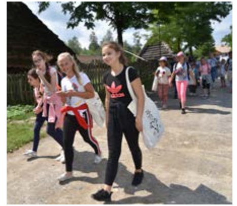
Fot. Gry terenowe wśród chałup kolbuszowskiego skansenu

W tym roku, już po raz trzeci odbyła się inicjatywa kulturalna dla dzieci i młodzieży z naszej gminy, pod nazwą „Wakacje z GOK”. Cykl wycieczek rozpoczęto od wyjazdu do Muzeum Kultury Ludowej w Kolbuszowej, gdzie obchodzono jeden z najważniejszych świąt ekologicznych „Wielki Dzień Pszczół”. Zwiedzanie kolbuszowskiego skansenu odbyło się w formie gry terenowej wśród chałup i budynków zabudowy wsi z przełomu XIX i XX wieku prezentujących kulturę Lasowiaków i Rzeszowiaków. Do mety prowadziło osiem punktów tematycznych związanych ze światem owadów zapylających. Po zakończonej grze, odbyło się spotkanie z pszczelarzami z mieleckiej pasieki „Maciejka”, podczas którego można było dowiedzieć się wiele ciekawych informacji o świecie pszczoł, degustować miód i wykonać świece z węzy pszczelarskiej. Kolejna wycieczka odbyła się do Zagrody Garncarskiej w Medyni Głogowskiej, gdzie uczestnicy wycieczki zapoznali się z historią powstania zagrody, zwiedzili XIX – wieczną chałupę chłopską wraz z jej wyposażeniem, spróbowali smacznych proziaków, obejrzeni piec do wypalania ceramiki oraz dowiedzieli się jak wyrabia się garnki gliniane. Następnie odbyły się warsztaty praktyczne, podczas których