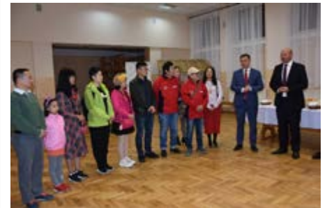
Fot. Spotkanie w Ujeznej