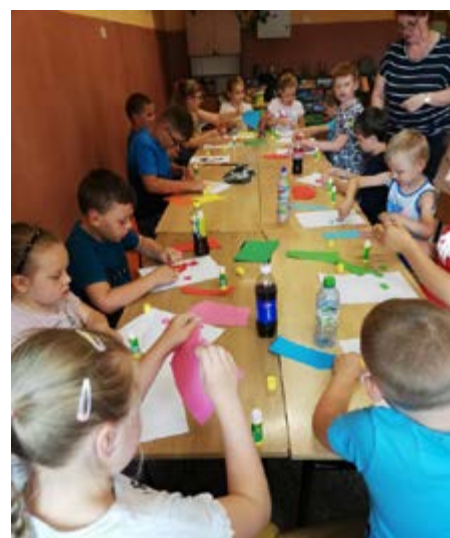
Fot. Warsztaty dla dzieci