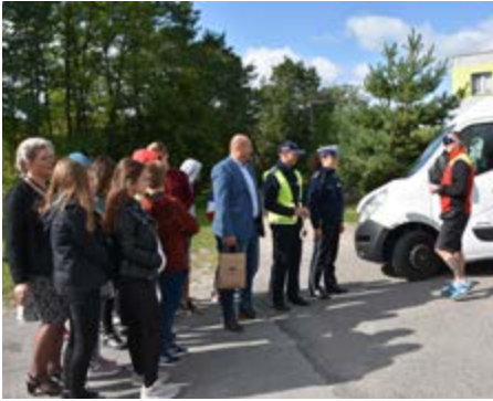
Fot. Happenig z udziałem młodzieży ze Szkoły Podstawowej w Nowosielcach

We wszystkich szkołach podstawowych objętych zadaniem odbyły się zajęcia warsztatowe z autorskim programem PROFILAKTYKA TAŃSZA OD LECZENIA. Zajęcia podejmowały tematykę zagrożeń związanych ze spożyciem substancji psychoaktywnych. W pięciu szkołach zostały zorganizowane pogadanki dla rodziców wraz z dyżurami konsultacyjnymi. Zadanie to było realizowane przez dwie organizacje: Stowarzyszenie Aktywna Gorliczyna oraz Stowarzyszenie Akademia Innowacji Społecznych.