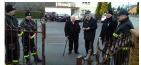
Fot. Druhowie z Mirocina podczas akcji rozdawania odblasków

Akcja „Bądź widoczny” została przeprowadzona przez druhow z Jednostki Ochotniczej Straży Pożarnej w Mirocinie w listopadzie br. Głównym celem akcji jest zapewnienie bezpieczeństwa pieszym oraz ograniczenie liczby zdarzeń drogowych z ich udziałem między innymi poprzez wyposażenie w elementy odblaskowe. Odblaski dla mieszkańców podarował Wójt Gminy Przeworsk. W akcji udział wzięła także policja oraz Gminny Ośrodek Kultury w Przeworsku.