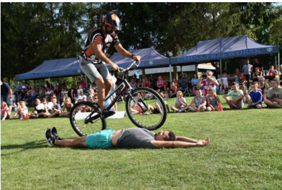
Fot. Pokaz akrobacji rowerowych