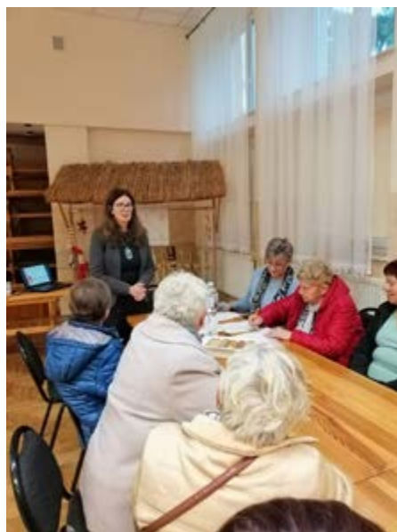
Fot. Wykład o zdrowym odżywianiu

Projekt był działaniem partnerskim Fundacji na Rzecz Psychoprofilaktyki Społecznej PRO-FIL oraz Gmin Przeworsk i Dubiecko. Pozyskana dotacja to prawie 20 tysięcy złotych.