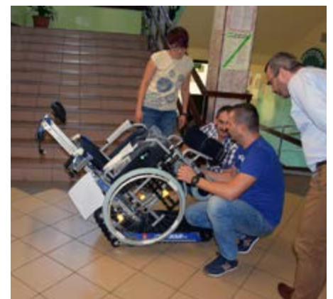
Fot. Instruktaż obsługi schodółazu