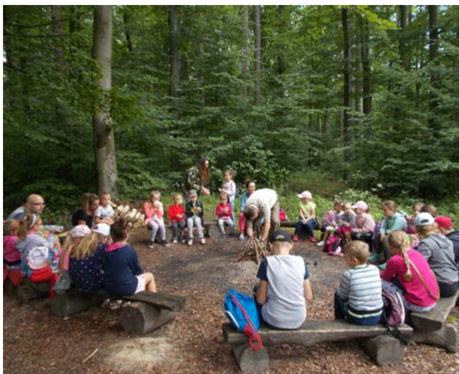
Fot. Ognisko podczas wycieczki do rezerwatu przyrody

Dzieci i młodzież uczestniczące w wakacyjnych zajęciach miały okazję twórczo spędzić wolny czas, poszerzyć swoją wiedzę i dobrze się bawić.