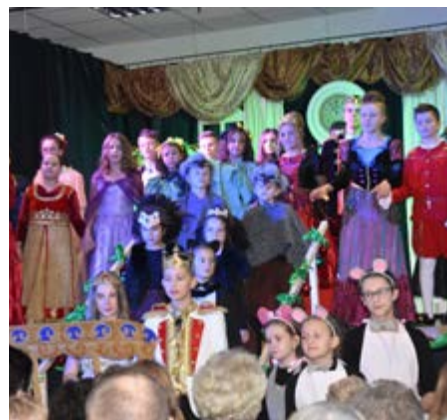
Fot. Spektakl teatralny „Kopciuszek” w wykonaniu uczestników projektu z Mirocina.

To zadanie także realizowane przez Parafię Rzymskokatolicką p.w. Matki Bożej Fatimskiej w Rozborzu i Stowarzyszenie Aktywna Gorliczyna. Jego celem było zintensyfikowanie działań profilaktycznych w zakresie przeciwdziałania przemocy w rodzinie poprzez promowanie działań służących wzmocnieniu więzi rodzinnych i pozytywnego rodzicielstwa. W zadaniu uczestniczyły dzieci z Gminy Przeworsk i Laszki. Prowadzono także warsztaty teatralne, których efektem były dwa spektakle, przygotowane przez uczestników zadania.