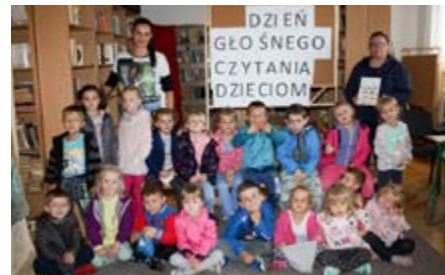
Fot. Dzieci z Samorządowego Przedszkola w Gorliczynie „Mali Odkrywcy” na spotkaniu w bibliotece w Gorliczynie

W ramach programu „Mała Książka - wielki człowiek” organizowanego przez Instytut Książki, w bibliotece w Gorliczynie zostało zorganizowane spotkanie z dziećmi z Samorządowego Przedszkola „Mali Odkrywcy” z Gorliczynie. Był to wyjątkowy dzień, bowiem 29 września to także Ogólnopolski Dzień Głośnego Czytania i z tej okazji dzieci wysłuchały krótkich wierszyków z morałem z książki Małgorzaty Strzałkowskiej „Rady nie od parady”. Przedszkolaki aktywnie uczestniczyły w spotkaniu, za co zostały nagrodzone słodyczkami.