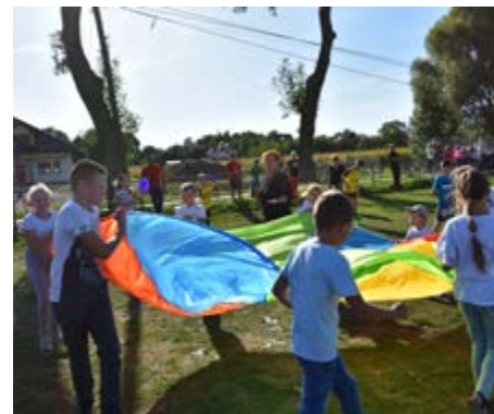
Fot. Piknik „Odurzeni pozytywną energią” w Mirocinie

„Odurzeni pozytywną energią” pod takim hasłem odbył się we wrześniu piknik profilaktyczno – rodzinny w Mirocinie. Podczas wydarzenia nie zabrakło konkursów i animacji dla dzieci z nagrodami, dużym zainteresowaniem cieszyły się także warsztaty „fascynacja cyrkiem” oraz taneczne. Przeprowadzono prelekcje profilaktyczne, aktywne działał punkt informacyjno – konsultacyjny, swoje stoiska informacyjne wystawiła Komenda Powiatowa Policji oraz Stacja Sanitarno – Epidemiologiczna w Przeworsku. Nie lada atrakcją był także pokaz strażacki wykonany przez OSP Mirocin i OSP Gać. Sportowych emocji dostarczyły dzieci z Football Academy Jarosław i Start Mirocin rocznik 2010, które rozegrały mecz piłki nożnej.