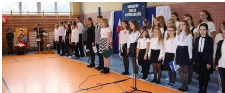
Fot. Akademia z okazji Święta Niepodległości

To jest moja Matka, ta ziemia! To jest moja Matka, ta Ojczyzna!- wołał do nas Ojciec Święty Jan Paweł II podczas swojej wizyty w Polsce. Nawiązując do słów wielkiego Polaka, Szkoła Podstawowa w Grzęsce w swoich różnorodnych działaniach uczy młode pokolenie grzęszczan miłości do Ojczyzny, do ziemi rodzinnej, dumy z jej przodków, historii, kultury i wiary, która współtworzy nasze ponadtyśiącletnie dziedzictwo.