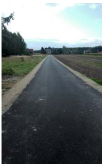
Fot. Droga w Świętoniowej