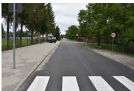
Fot. Przebudowa drogi w Grzęsce

Zakończyły się remonty i przebudowy dróg gminnych. W ramach pierwszego kontraktu o wartości 767 000,00 zł wykonano 4 odcinki. Są to drogi w Świętoniowej - dotacja z Ministerstwa Spraw Wewnętrznych i Administracji 52 390,00 zł, w Gorliczynie - dotacja z Ministerstwa Spraw Wewnętrznych i Administracji: 197 843,00 zł, w Grzęsce - dotacja z Funduszu Dróg Samorządowych: 188 971,00 zł, w Ujeznej dotacja z budżetu Województwa Podkarpackiego: 60 994,00 zł. Łącznie w ramach tego zadania wykonano 1,9 km dróg o nawierzchni bitumicznej.