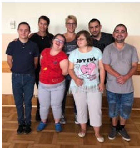
Fot. Uczestnicy warsztatów tanecznych z Gminy Przeworsk

Projekt miał na celu podniesienie poziomu integracji społecznej uczestników oraz wiary we własne możliwości.