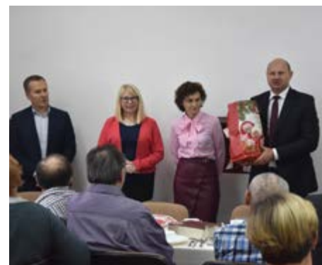
Fot. Wójt z upominkiem dla uczestników projektu i mieszkańców Schroniska na Gwizdaju