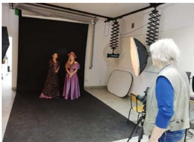
Fot. Warsztaty w studio