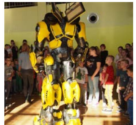
Fot. ROBOT SHOW

Europe Code Week to oddolna inicjatywa promująca programowanie i umiejętności cyfrowe wśród uczestników w ciekawy i interesujący sposób. Uczestnicy pikniku mogli również zgłębiać tajniki planet i galaktyk w Mobilnym Planetarium – HECA PLANET, gdzie przy pomocy specjalnej projekcji wyświetlane były bardzo efektowne filmy w formacie obrazu 3D. Niebywłą atrakcją pikniku był ROBOT SHOW, którym były zachwycone nie tylko najmłodsze dzieci ale również zaproszeni goście, nauczyciele i rodzice.