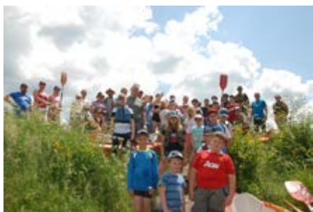
Fot. „spływ kajakowy”

Pracując już wiele lat w szkole zauważyłem, że rodzice coraz rzadziej kontaktują się z nauczycielami i są coraz rzadszymi gośćmi w placówce, do której uczęszcza ich dziecko. Pragnąc zaprosić opiekunów do wspólnego, aktywnego spędzania czasu zorganizowałem w 2016 roku I Rodzinny spływ kajakowy na Roztoczu.