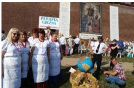
Fot. Delegacja z Ujeznej reprezentowała Gminę Przeworsk podczas Ogólnopolskich dożynkach na Jasnej Górze

W dniach 31 sierpnia – 1 września odbyły się Ogólnopolskie Dożynki na Jasnej Górze. Gminę Przeworsk reprezentowała Parafia z Ujeznej. Panie z Koła Gospodyń Wiejskich wraz z przedstawicielami Ochotniczej Straży Pożarnej zanieśli do tronu Matki Bożej podziękowania za tegoroczne plony.