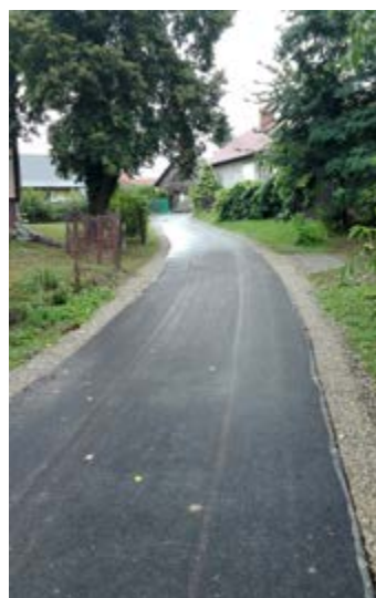
Fot. Droga w Urzeżowicach