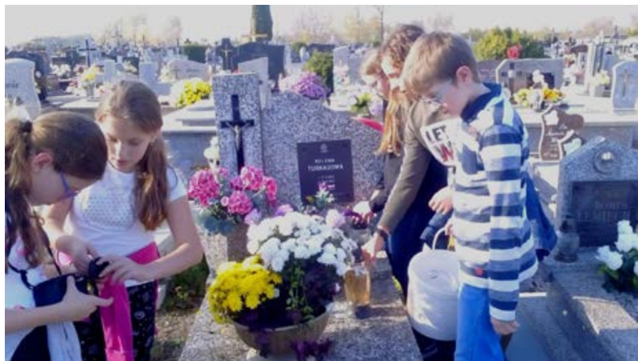
Fot. Uczniowie naszej szkoły podczas wizyty na cmentarzu

Nasza szkoła od dawna opiekuje się Pomnikiem Żołnierza Polski Odrodzonej zwanego popularnie Pomnikiem Hallerczyka. Widnieje na nim tablica z 40 nazwiskami żołnierzy, którzy zapłacili najwyższą cenę za wolność, oddali życie w obronie Ojczyzny. Pamiętamy również o grobach nauczycieli z przed II wojny światowej, którzy nie tylko pracowali w tutejszej szkole ale i prywatne życie związali z Urzejowicami. Dlatego właśnie tuż przed dniem