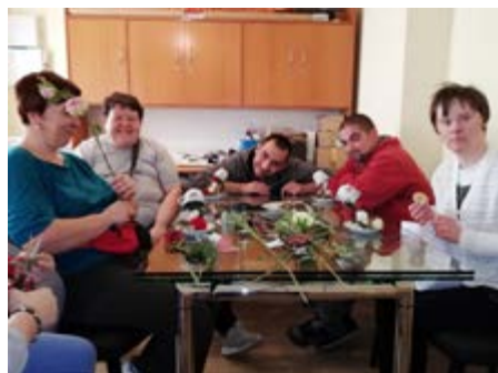
Fot. Zajęcia artystyczno - kreatywne w Gminie Przeworsk

Podsumowującym punktem projektu będzie występ taneczno - rytmiczny grupy z Gorliczyny na spotkaniu opłatkowym organizowanym przez Gminny Ośrodek Pomocy Społecznej w Przeworsku.