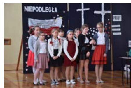
Fot. Wspólne śpiewanie hymnu

Kolejne przedsięwzięcia szkoły kształtujące postawy obywatelskie i patriotyczne to udział w ogólnopolskiej akcji „Szkoła do hymnu”, podczas której 8 listopada o godzinie 11:11 odśpiewaliśmy uroczystie hymn państwowy.