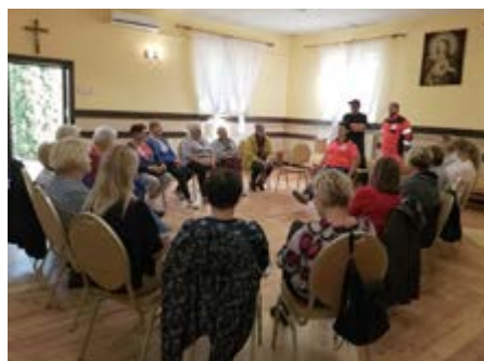
Fot. Warsztaty z zakresu pierwszej pomocy

Dobiegł końca projekt „Wyspa SENIORita” współfinansowany z budżetu Wojewody Podkarpackiego, a dedykowany seniorom z terenu Gminy Przeworsk oraz równoległe z Gminy Dubiecko. Był to cykl warsztatów o bardzo zróżnicowanej tematyce. Jego zadaniem była aktywizacja seniorów oraz edukacja w dziedzinach, które są przydatne w celu podtrzymywania kondycji fizycznej i psychicznej. Odbyły się między innymi warsztaty z pierwszej pomocy przedmedycznej czy zdrowego trybu życia i wiedzy o chorobach cywilizacyjnych, zdrowym odżywianiu. Ważny był także cykl tematów o podtrzymywaniu i rozwijaniu kompetencji interpersonalnych, które pozwalają na lepsze samopoczucie, osiąganie satysfakcji w relacjach międzyludzkich.