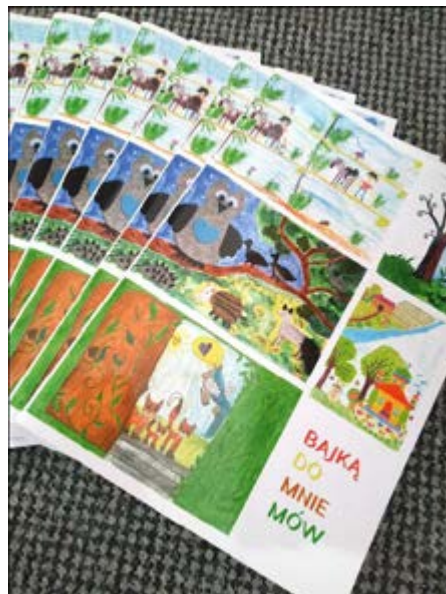
Fot. Książka z bajkami uczestników konkursu

Na konkurs nadesłano 96 bajek z powiatów: jasielskiego jarosławskiego kolbuszowskiego, sanockiego, krośnieńskiego, rzeszowskiego, leżajskiego, niżańskiego, stalowowlowskiego, brzozowskiego, mieleckiego, tarnobrzaskiego i przeworskiego. Konkurs wymagał zaangażowania w działania co najmniej dwóch członków rodziny co pozwoliło na aktywne spędzenie czasu dzieci i rodziców. Wydruk książki w formie papierowej zachęca mieszkańców województwa do korzystania z tradycyjnej jej postaci. Dodatkowo jednak umieszczona została w pdf na stronie Fundacji na Rzecz Psychoprofilaktyki Społecznej PRO-FIL. Zapraszamy do skorzystania. Wszyscy uczestnicy konkursu otrzymali wydrukowane kolorowe bajki, które były m.in. ich dziełem i atrakcyjne nagrody.