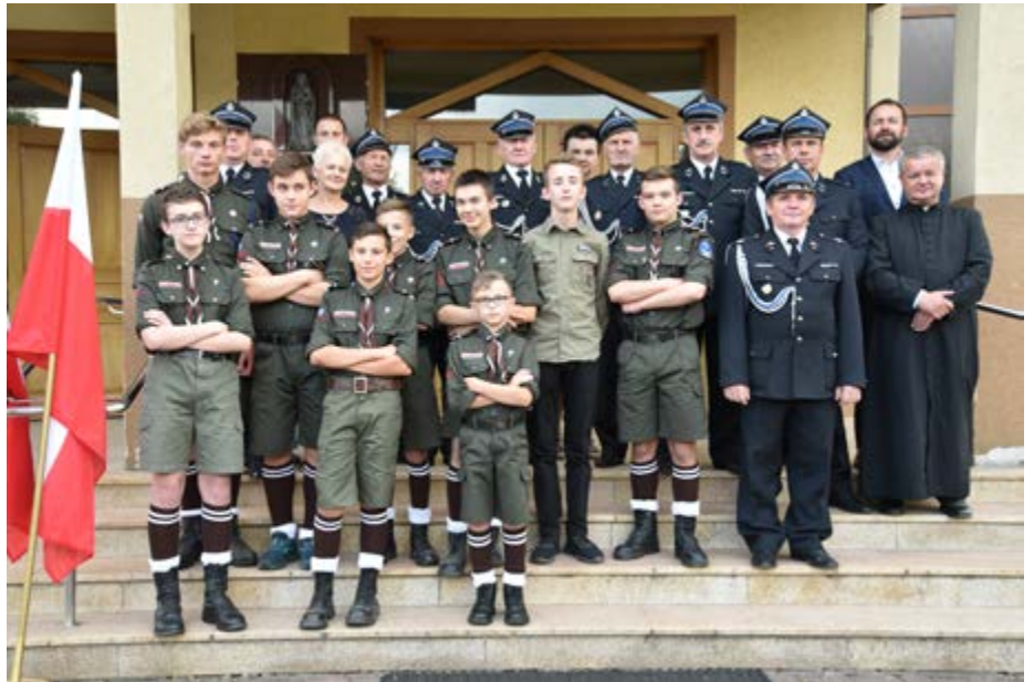
Fot. 1 sierpnia, Godzina „W” w 75. rocznicę wybuchu Powstania Warszawskiego