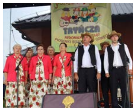
Fot. Zespół Śpiewaczy „Cantus” z Gorliczyny