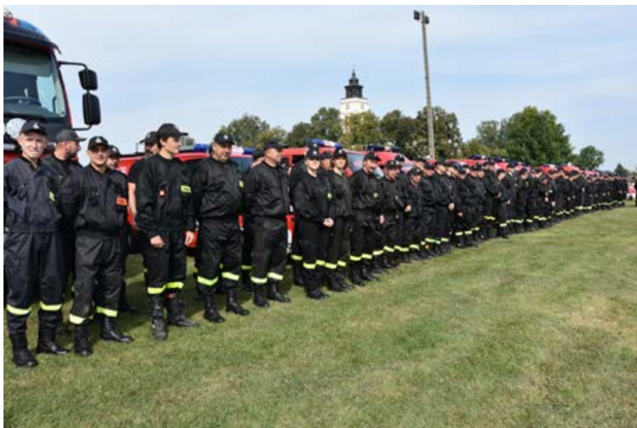
Fot. Druhowie z trzech gmin: Gać, Przeworsk i Zarzecze

W tym roku gospodarzem Międzygminnych Manewrów Ratowniczo – Gaśniczych, które odbyły się 7 września br. w Świętoniowej, był Zarząd Gminny ZOSP RP w Przeworsku. Wzięły w nich udział jednostki z gmin: Gać, Przeworsk i Zarzecze. Manewry połączone zostały z przekazaniem samochodu ratowniczo-gaśniczego oraz sprzętu tj.: mundury specjalne typu Nomex, narzędzia hydrauliczne Lukas, węży W 52 oraz butów specjalnych. Nowy samochód oraz sprzęt poświęcił Kapelan Powiatu-