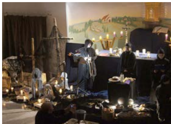
Fot. Spktakl Dziady w wykonaniu szkolnego teatru 2MASKI