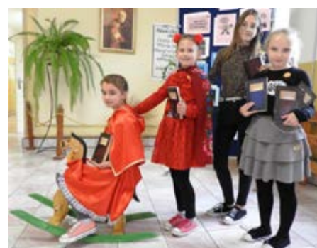
Fot. Uczestnicy akcji

wzięciem, które cieszyło się ogromnym zainteresowaniem był „Portret z książką”. Uczniowie, wcielając się w wybrane przez siebie postacie literackie, wykonywali fotografie z książką. Akcja miała na celu promocję czytelnictwa, rozwijanie kreatywności i wrażliwości estetycznej, a także wizualizację pasji czytania. Uczniowie mogli więc połączyć zainteresowania czytelnicze z fotografią. Tradycją naszej szkoły stało się też czytanie najwybitniejszych dzieł literatury polskiej w ramach ogólnopolskiej akcji Narodowe Czytanie, objętej patronatem honorowym Pary Prezydenckiej. Uroczystość ta to nie tylko możliwość obcowania z wybitnymi dziełami, które na stałe weszły w świadomość kulturową i patriotyczną, ale również okazją do poznania historii i wielkich idei czasów, w których powstawały. Uczniowie wsłuchiwali się w wybrane fragmenty nowel polskich, które zaprezentowali