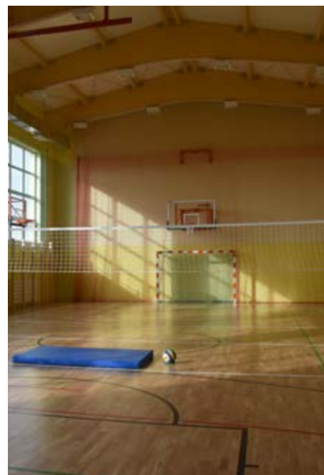
Fot. Sala gimnastyczna w Świętoniowej w całej okazałości

Na początku września została oddana do użytku i poświęcona nowo wybudowana przyszkolna sala gimnastyczna wraz z łącznikiem w Świętoniowej. Realizacja zadania była możliwa dzięki dofinansowaniu z Ministerstwa Sportu w kwocie 1 443 154 zł, cała inwestycja to koszt 3 137 291,90 zł. Sala gimnastyczna posiada boisko o wymiarach 12x24m, antresolę, zaplecze socjalno-higieniczne oraz łącznik pomiędzy szkołą, a salą i niezależną kotłownią. Budynek został w pełni wyposażony, wykonano nowoczesny system wentylacji mechanicznej i klimatyzacji.