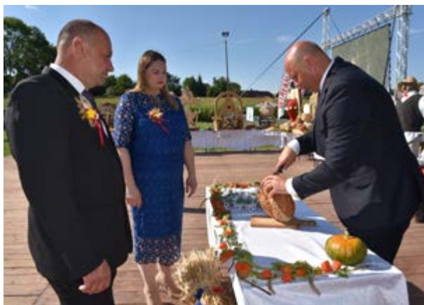
Fot. Tradycyjne dzielenie chleba