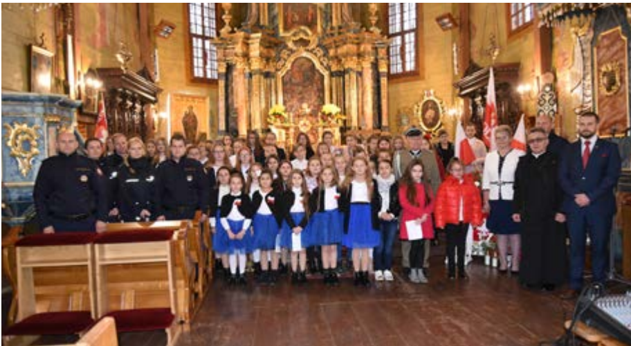
Fot. Niepodległościowy występ

Narodowe Święto Niepodległości dla wszystkich Polaków, rozsianych przez wiatr historii po całym świecie, ma znaczenie wyjątkowe. 11 listopada to data, która przypomina, że Polacy dla Ojczyzny zawsze byli zdolni do wielkich ofiar.