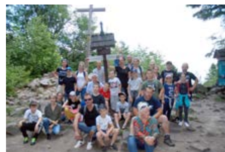
Fot. na szczycie Łysicy

stał się stałym punktem w kalendarzu imprez cyklicznych szkoły. Chcąc jednak rozszerzyć ofertę wielopokoleniowych wyjazdów, aby aktywnie i poznawczo spędzać czas wolny, założyłem I Rodzinne Koło Turystyczne „Róża Wiatrów” działające przy Szkole Podstawowej w Rozborzu. Celem powstania koła była chęć zaangażowania rodziców, dziadków, dzieci do aktywnego spędzania wolnego czasu, propagowania turystyki kwalifikowanej oraz integracji pokoleń. Członkowie wyrazili chęć przystąpienia do Klubu Zdobywców Korony Gór Polski oraz do Polskiego Towarzystwa Schronisk Młodzieżowych. Spotkanie założycielskie odbyło się 03 kwietnia 2019 r. Koło zrzesza obecnie 30 członków - 15 rodziców i dziadków oraz ich dzieci/wnuków. Inauguracyjna impreza Koła miała miejsce w dniu 27.04.2019 i obejmowała zwiedzanie zamku i parku w Krasiczynie, fortów przemyskich oraz Przemysła: m.in. muzeum dzwonów i fajek.