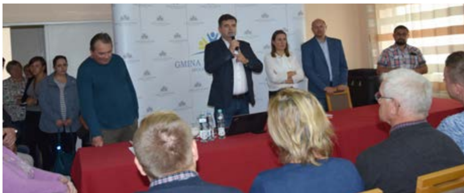
Fot. Spotkanie informacyjne w sprawie OZE w Urzędzie Gminy Przeworsk

Po dwóch latach starania się Gmina Przeworsk otrzymała dofinansowanie w ramach Regionalnego Programu Operacyjnego Województwa Podkarpackiego na lata 2014–2020, na projekt pn. „Instalacja Odnawialnych Źródeł Energii na terenie Gminy Przeworsk. Szacowany koszt inwestycji to ponad 12 291 000,00 zł.