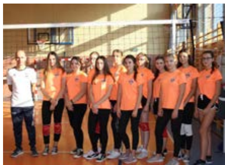
Fot. Zwycięska drużyna

Dziewczyny wybrały motywujące nazwy, kolor koszulek i po kilku treningach przystąpiły do rywalizacji.