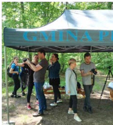
Fot. Warsztaty w plenerze

bardziej twórczych zdjęć. Następnie zdobytą wiedzę wykorzystali podczas działań w terenie. Pracowali zarówno na sprzęcie cyfrowym jak i analogowym. Podczas warsztatów na Wydziale Sztuki Uniwersytetu Rzeszowskiego, w profesjonalnym studio, mogli spróbować pracy