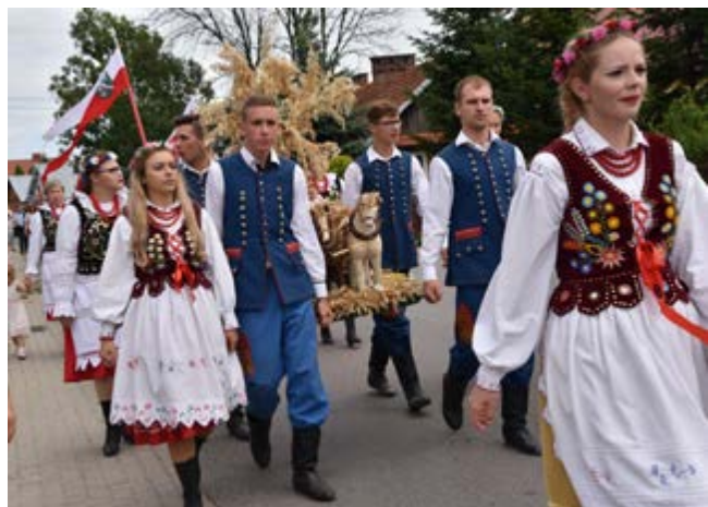
Fot. Korowód dożynkowy

można było zdobyć atrakcyjne nagrody. Odbył się również konkurs dla sołtysów.