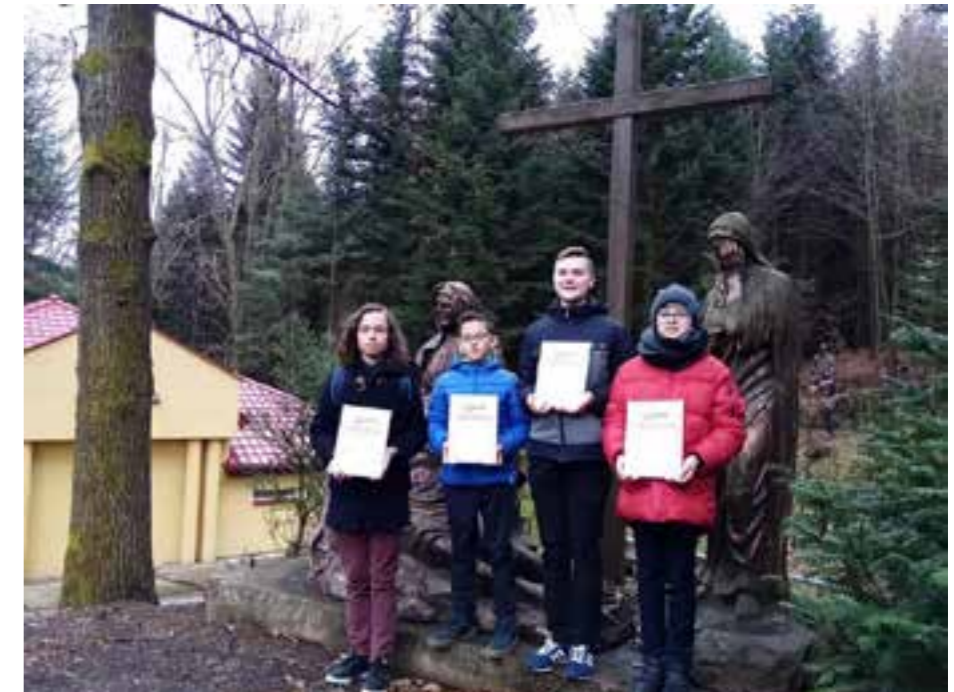
Zdj. Laureaci konkursu z Urzejowic

Ze względu na pandemię finał konkursu został odwołany. Wszyscy uczniowie, którzy zostali zakwalifikowani do finału otrzymali tytuł finalisty konkursu, a 13 spośród nich z największą