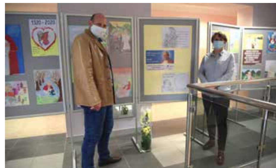
Zdj. Pokonkursowa wystawa prac plastycznych

Również w Szkole Podstawowej w Chałupkach z okazji 100. rocznicy urodzin Papieża Polaka powstała Izba Pamięci Świętego Jana Pawła II, w której znajdują się cenne pamiątki, rzeczy osobiste, obrazy, pamiątkowe medale