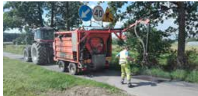
Zdj. Prace remontowe na drogach wykonywane remonterem

W celu poprawy komfortu i bezpieczeństwa mieszkańców, Gmina Przeworsk na bieżąco wykonuje remonty cząstkowe dróg gminnych o nawierzchni bitumicznej. Usuwanie ubytków na drogach z nawierzchnią asfaltową na terenie całej Gminy