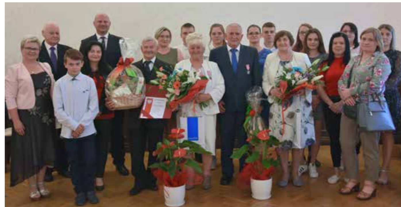
Zdj. Złote Gody w dniu 10 czerwca