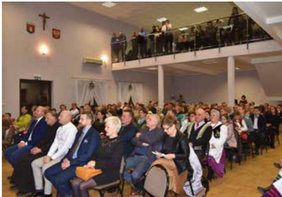
Zdj. Uczestnicy Wieczoru Kolęd w Grzędzie

Spotkanie uświetnił występ uczniów ze Szkoły Podstawowej w Grzędzie. Mali wykonawcy stanęli na wysokości zadania, prezentowali piękne wiersze oraz kolędy i pastorałki, od tych tradycyjnych do tych mało znanych, pozwalając