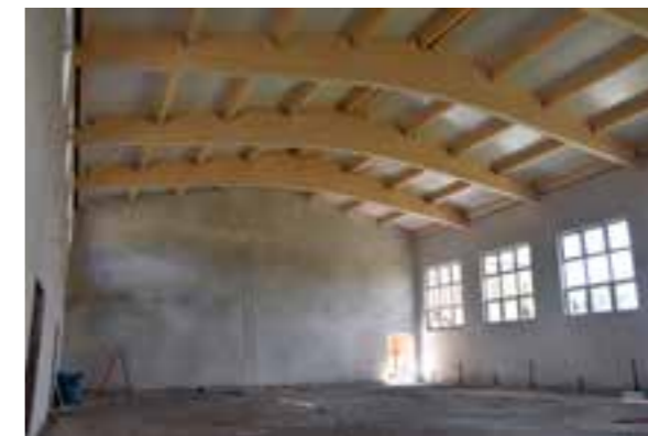
Zdj. Sala gimnastyczna w Studzianie wewnątrz

niepełnosprawnych. Koszt całej inwestycji to 3 320 432,56 zł. Na realizację zadania uzyskano dofinansowanie ze środków Ministerstwa Sportu i Turystyki w kwocie 1 660 000,00 zł.