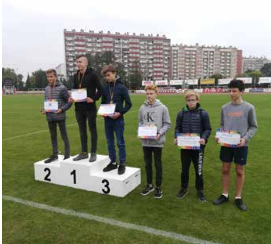
Zdj. Laureaci zawodów sportowych