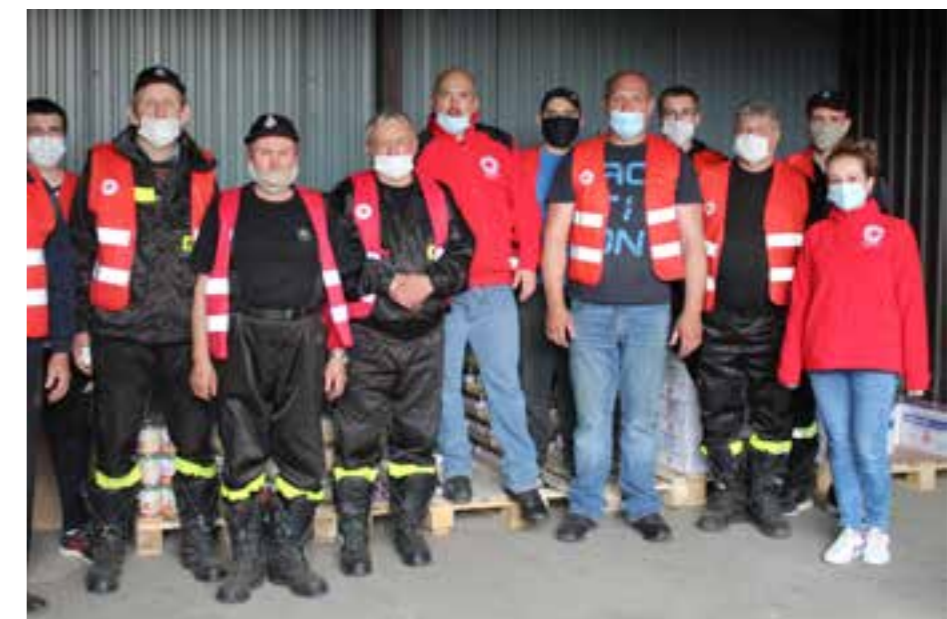
Zdj. Wolontariusze pomagający rozdysponować żywność

Realizatorami dystrybucji żywności od stycznia do maja 2020 r. w Gminie Przeworsk były Parafie: Matki Bożej Fatimskiej w Rozborzu, Judy Tadeusza i św. Brata Alberta w Mirocinie, Matki Bożej Pocieszenia w Ujeznej, które podpisały umowy z Caritas Archidiecezji Przemyskiej oraz Polski Czerwony Krzyż Oddział Rejonowy w Przeworsku,