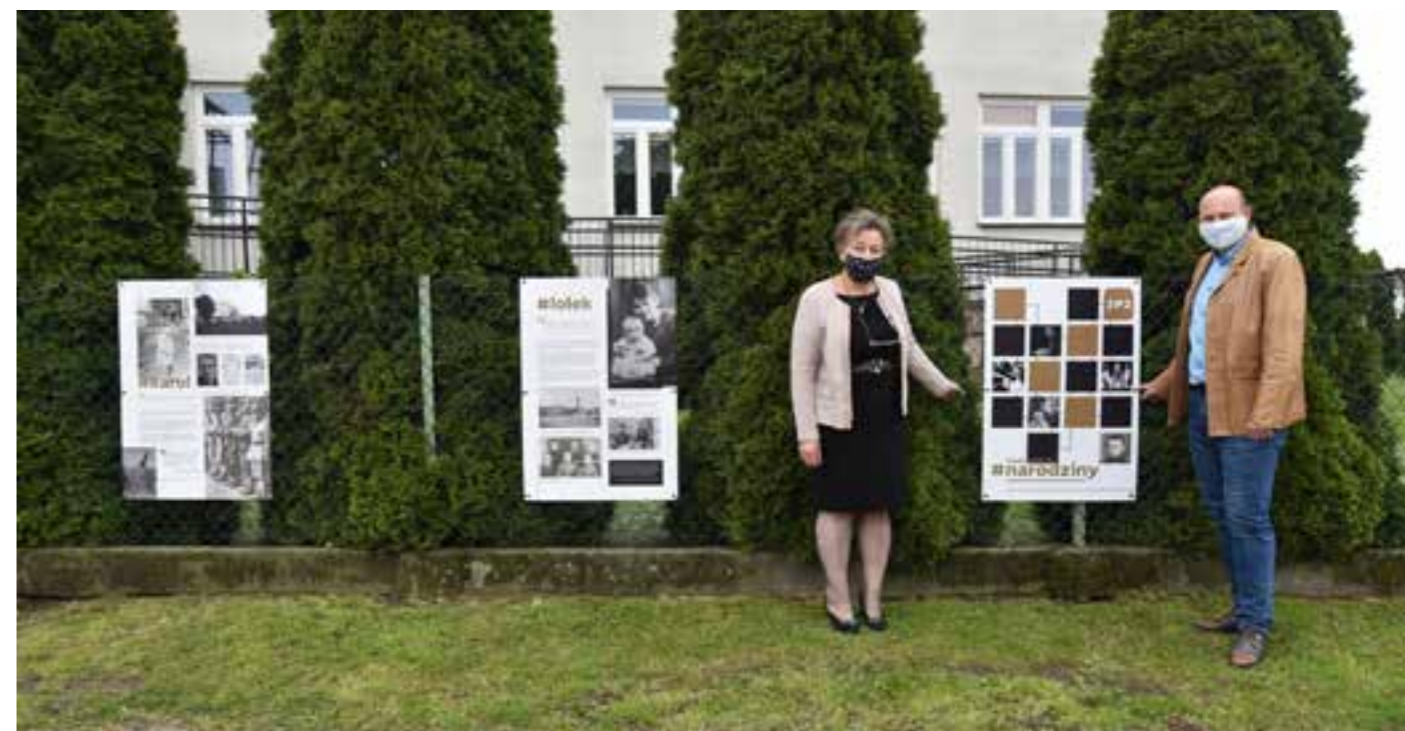
Zdj. Wystawa plenerowa „Karol Wojtyła. Narodziny”