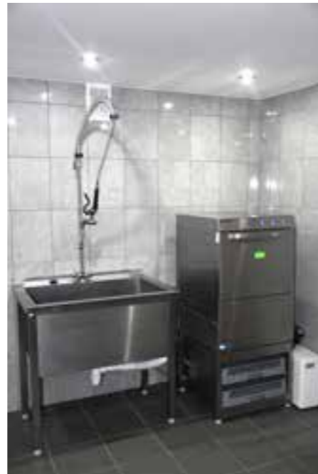
Zdj. Nowa zmywalnia w WDK w Chałupkach