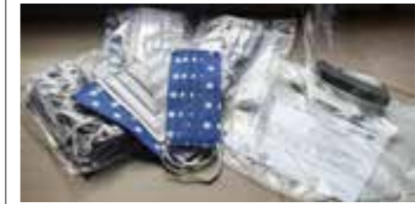
Zdj. Maseczki i przyłbice ochronne na twarz

Gminny Ośrodek Pomocy Społecznej w Przeworsku w ramach walki z pandemią wirusa SARS-CovV-2 otrzymał bezpłatnie 120 maseczek bawełnianych wielokrotnego użycia oraz 46 przyłbic ochronnych na twarz. Produkty przekazał Regionalny Ośrodek Polityki Społecznej w Rzeszowie w ramach projektu pozakonkursowego pn. „Koordynacja sektora ekonomii społecznej w województwie podkarpackim w roku 2020” współfinansowanego ze środków Europejskiego Funduszu Społecznego w ramach Regionalnego Programu Operacyjnego Województwa Podkarpackiego na lata 2014-2020.