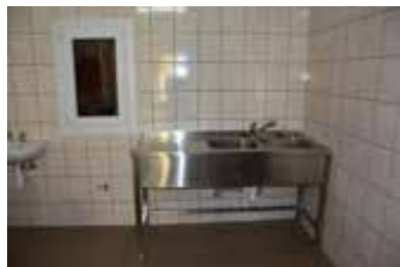
Zdj. Zmywalnia w WDK w Ujeznej