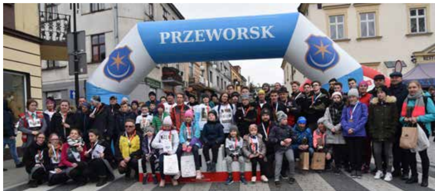
Zdj. Uczestnicy Biegu Pamięci