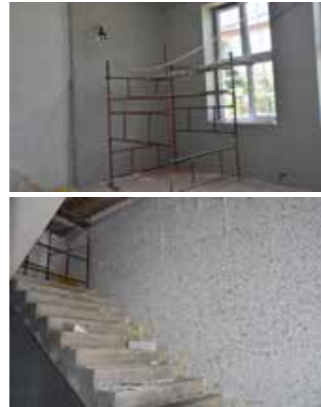
Zdj. Prace remontowe wewnątrz budynku

Nowe życie dostanie budynek świetlicy i biblioteki w Ujeznej. Obecnie trwają prace modernizacyjne obejmujące budowę wewnętrznej klatki schodowej, wymianę stropu, budowę instalacji sanitarnych i elektrycznych, wymianę stolarki zewnętrznej, docieplenie ścian budynku, docieplenie stropu, wymianę konstrukcji dachu wraz z pokryciem. Dodatkowo przy budynku zostanie wykonany plac zabaw, siłownia zewnętrzna oraz pozostałe elementy małej architektury.