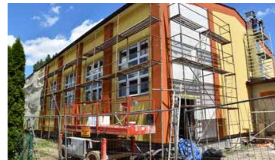
Zdj. Widok sali gimnastycznej na zewnątrz