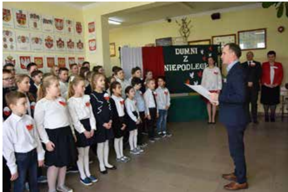
Zdj. Uczniowie Szkoły Podstawowej w Ujeznej podczas śpiewania hymnu