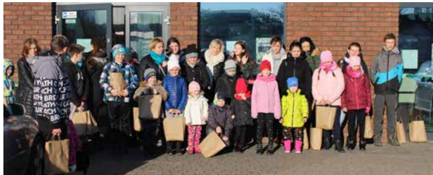
Zdj. Uczestnicy wyjazdu profilaktycznego w Centrum Zabaw w Krasnem