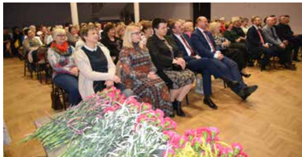
Zdj. Gminny Dzień Kobiet

Atrakcją wieczoru był występ, żeńskiego kabaretu „A JAK!”, który zachwyił i rozbawił publiczność do łez. Następnie zaprezentowała się Orkiestra Dęta Gminy Przeworsk, wykonując muzyczną wiązaną.