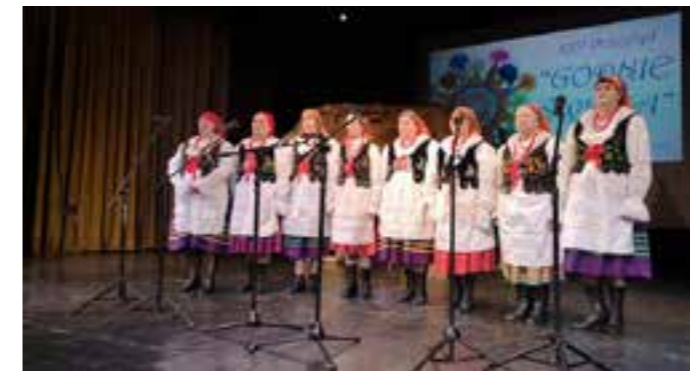
Zdj. Zespół Śpiewaczy „Grzęszczanie”