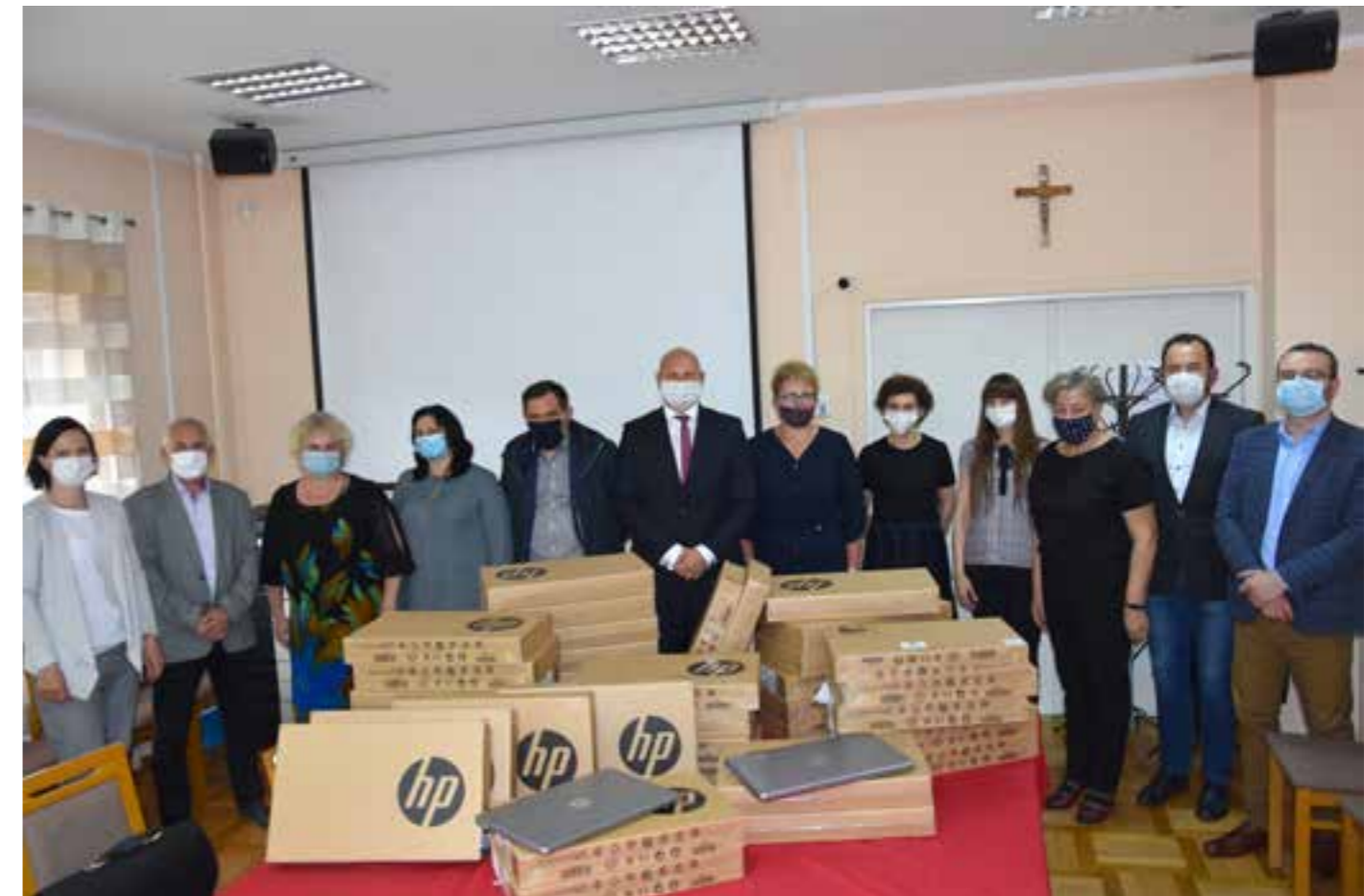
Zdj. Przekazanie komputerów dyrektorom szkół z terenu Gminy