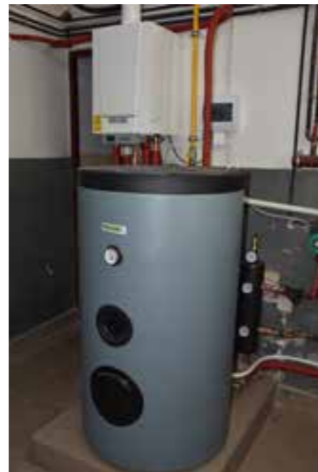
Zdj. Zmodernizowana kotłownia w WDK w Chałupkach