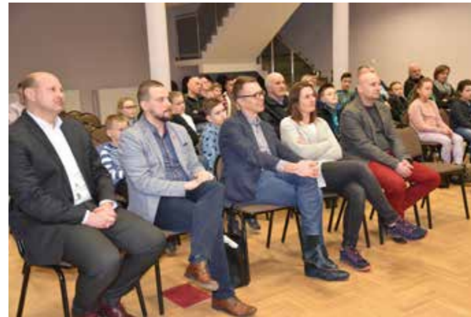
Zdj. Spotkanie z podróżnikiem w Wiejskim Domu Kultury w Grzędzie