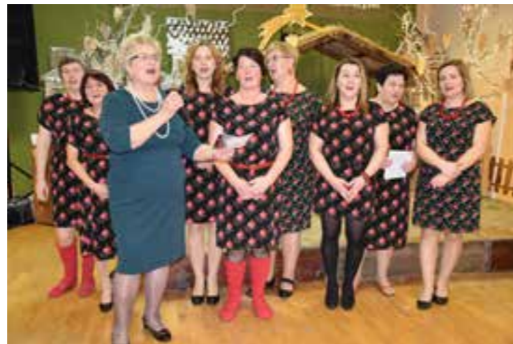
Zdj. Świętujące Jubileusz 110-lecia Koło Gospodyń Wiejskich w Urzejowicach