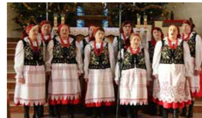
Zdj. Wyróżniony Zespół Śpiewaczy „Studzienczanki” ze Studziana