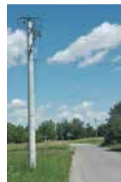
Zdj. Nowe oprawy lamp