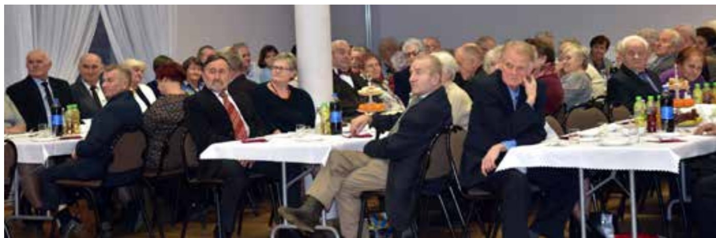
Zdj. Uczestnicy Dnia Seniora