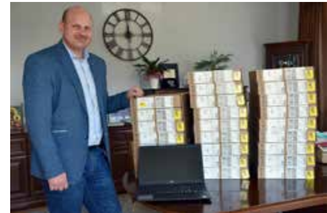
Zdj. 25 komputerów zakupionych w projekcie „Zdalna szkoła”

Gmina Przeworsk złożyła 2 wnioski w projekcie „Zdalna szkoła” i „Zdalna Szkoła +” na dofinansowanie zakupu komputerów z przeznaczeniem dla uczniów i nauczycieli. Dzięki temu samorząd otrzymał 69 710,20 zł w pierwszej transzy, za które zostało zakupionych 25 laptopów z oprogramowaniem. W kolejnej otrzymał dofinansowanie w kwocie 114 814, 35 zł, za które zakupiono 49 laptopów. Pozwoliło to doposażyć placówki szkolne w dodatkowy sprzęt i zabezpieczyć potrzeby rodzin na czas zdalnej edukacji. Zakup finansowano ze środków Europejskiego Funduszu Rozwoju Regionalnego w ramach Programu Operacyjnego Polska Cyfrowa na lata 2014-2020.