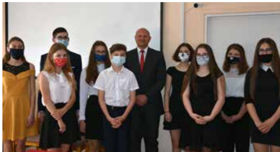
Zdj. Najzdolniejsi uczniowie 8 klas wraz z Wójtem Gminy Danielem Krawcem