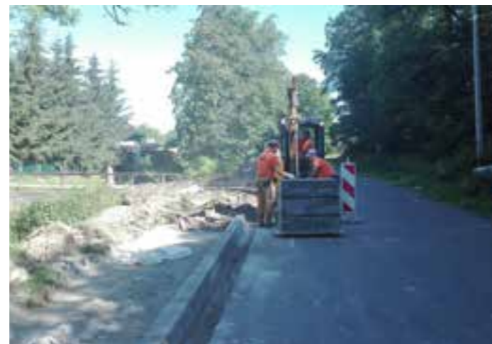
Zdj. Przebudowa drogi w Rozborzu

Nr P 1592R Przeworsk – Ujezna – Pełkinie Nr P 1593R Rozbórz – Mirocin – Ożańsk