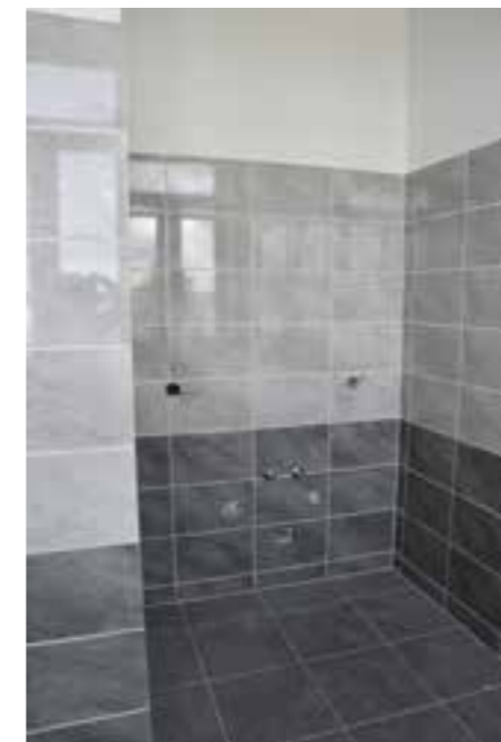
Zdj. Odnowione pomieszczenia, w trakcie adaptacji pod CIS