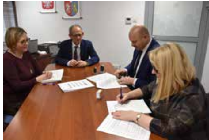
Zdj. Podpisanie umowy

CIS swoją działalność rozpocznie 1 stycznia 2021 roku. Dzięki dotacji z Europejskiego Funduszu Społecznego uruchomione będą 3 warsztaty dla 30 uczestników. Zadaniem centrum będzie świadczenie usług służących reintegracji społecznej i zawodowej osobom długotrwale bezrobotnym, osobom niepełnosprawnym, uzależnionym lub w innej niekorzystnej sytuacji. Reintegracja społeczna realizowana w CIS obejmuje m.in. kształcenie umiejętności niezbędnych do pełnienia ról społecznych, naukę planowania i gospodarowania dochodami. Integracja zawodowa polega natomiast w szczególności na umożliwieniu uczestnikom centrum nabycia nowych umiejętności zawodowych mających na celu przekwalifikowanie lub podwyższenie kwalifikacji.