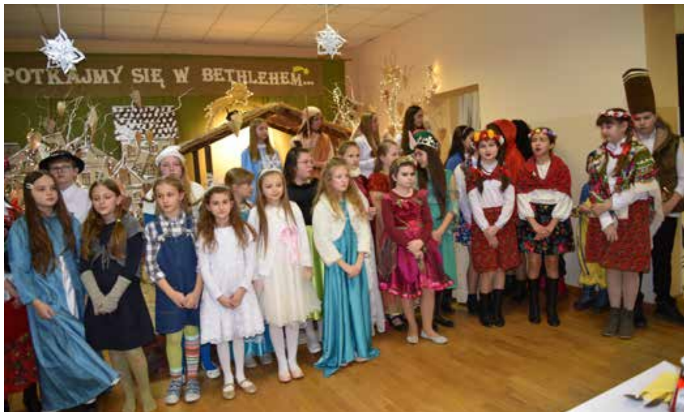
Zdj. Występ uczniów Szkoły Podstawowej w Urzejowicach