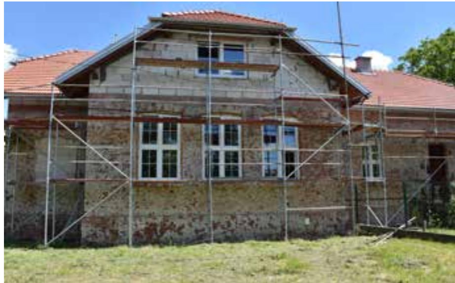
Zdj. Widok na ścianę frontową