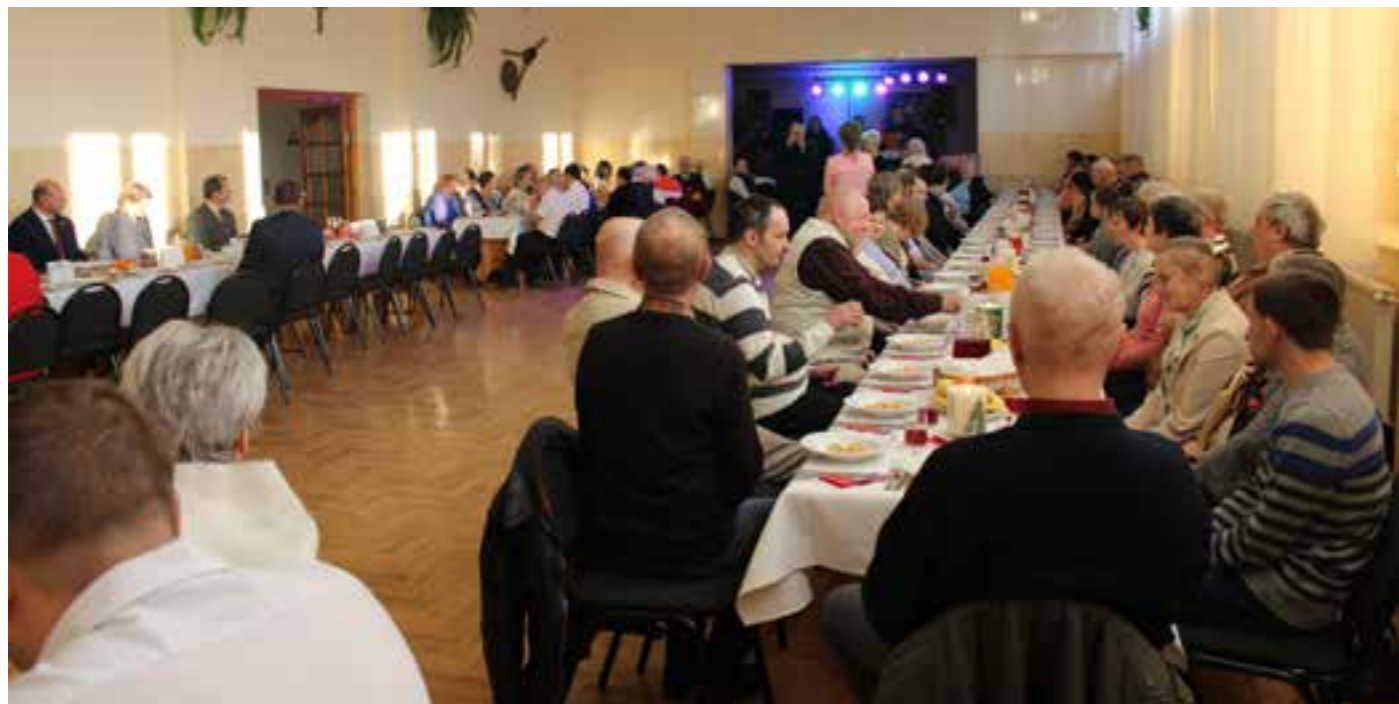
Zdj. Uczestnicy spotkania noworocznego