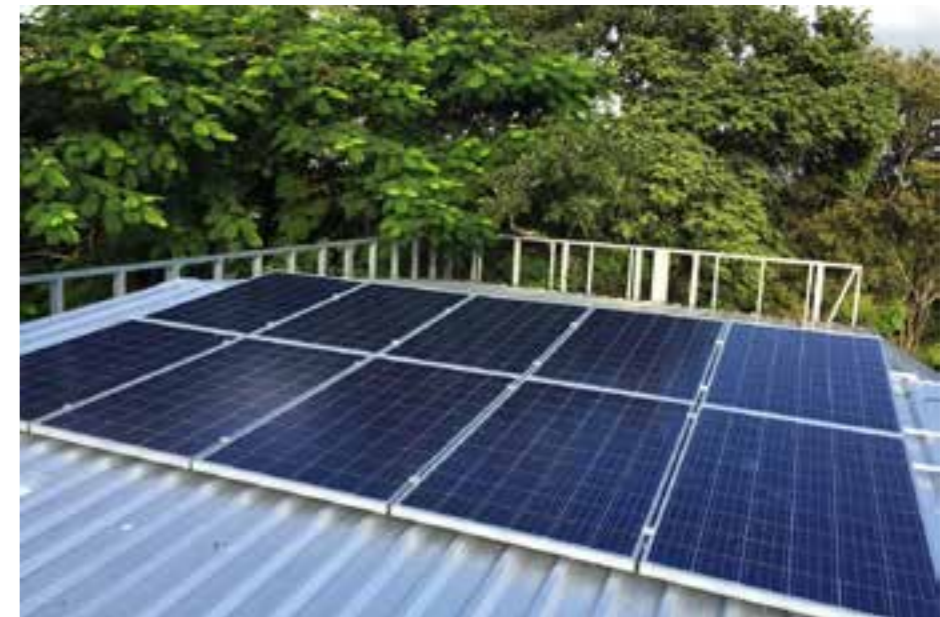
Zdj. Odnawialne źródła energii