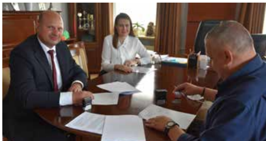
Zdj. Podpisanie umowy z wykonawcą na roboty budowlane