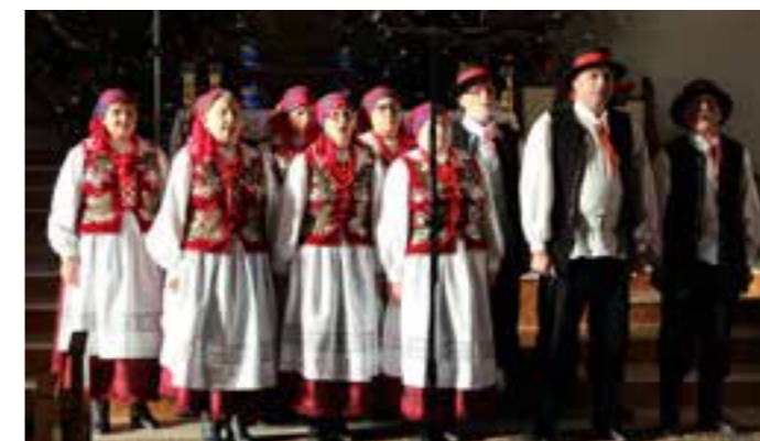
Zdj. „Cantus” z Gorliczyny