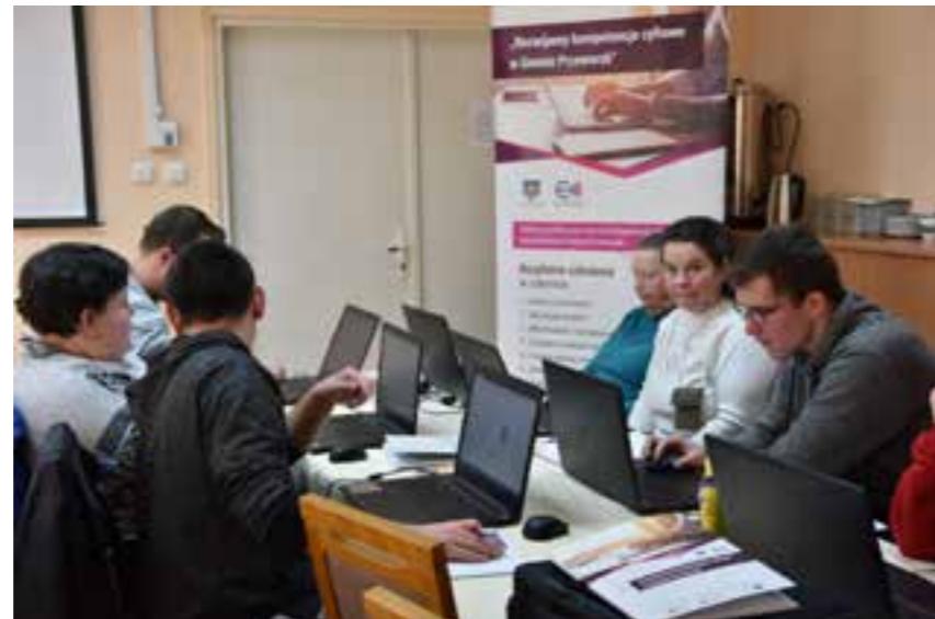
Zdj. Uczestnicy szkolenia w Urzędzie Gminy

Dziękujemy uczestnikom szkolenia oraz wszystkim osobom, które przyczyniły się do realizacji projektu.