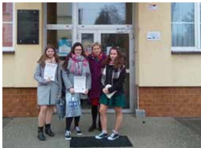
Zdj. Laureatki konkursu „Bądź Poliglotą”