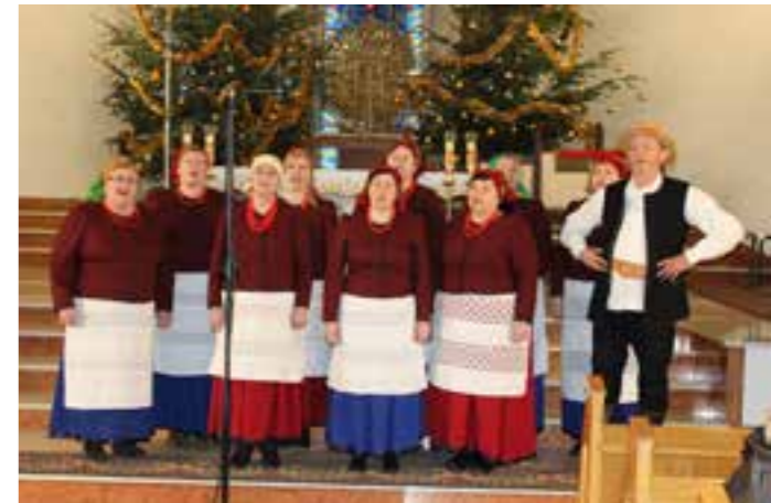
Zdj. Zespół Śpiewaczy „Ujeźniacy”