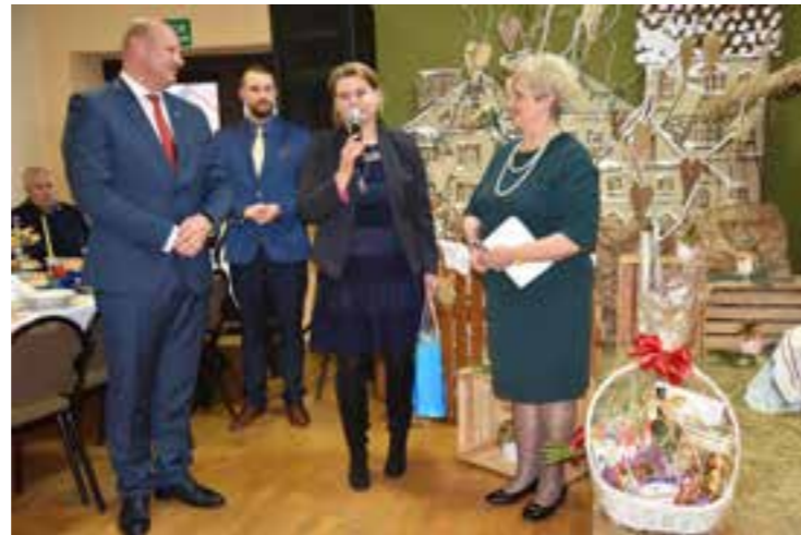
Zdj. Przemawiała Członek Zarządu Województwa Podkarpackiego