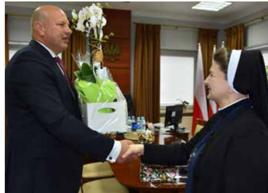
Zdj. Spotkanie w Urzędzie Gminy Przeworsk