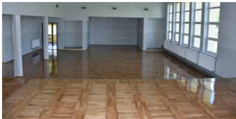
Zdj. Nowa podłoga w Wiejskim Domu Kultury w Świętoniowej