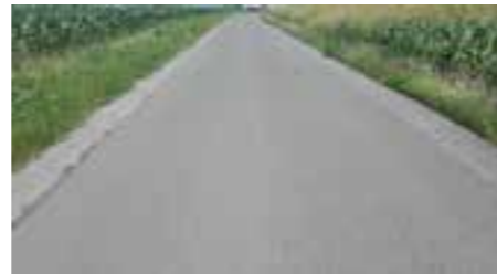
Zdj. Pobocza przy drodze w Nowosielcach

odbywa się grysem i emulsją asfaltową tzw. remonterem. Dodatkowo zostały utwardzone kamieniem i wyremontowane drogi dojazdowe, położono łącznie 390 ton mieszanki kamiennej. Naprawiono także 830 mb uszkodzonych poboczy przy drodze gminnej w Nowosielcach. Regularnie koszone są pobocza przy wszystkich drogach gminnych.