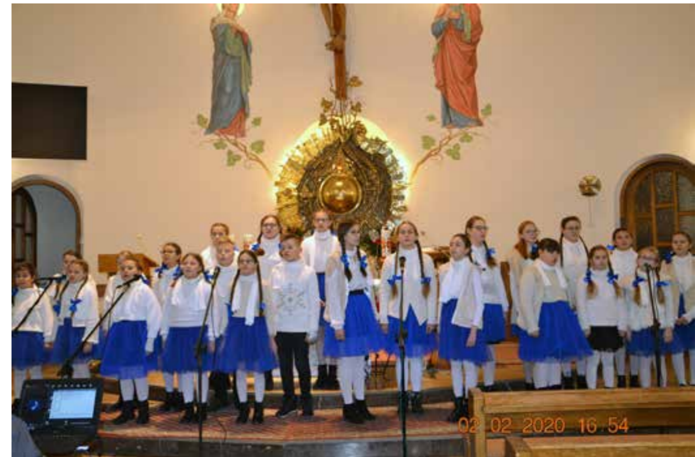
Zdj. Uczestnicy Przeglądu

Na początku lutego w kościele parafialnym p.w. Św. Judy Tadeusza w Mirocinie odbył się po raz kolejny Powiatowy Koncert Kolęd i Pastorałek „Kolęda płynie z wysokości” organizowany przez Szkołę Podstawową w Mirocinie. Uczniowie ze szkół powiatu przeworskiego zaprezentowali piękne kolędy oraz bardziej i mniej znane pastorałki.