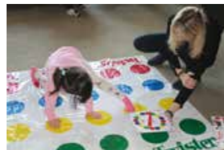
Zdj. Warsztaty w ramach programu

Warsztaty wywołały wiele uśmiechu zarówno na twarzach dzieci jak i rodziców, co pokazało że taka forma zajęć ma dodatkową wartość. Kwota projektu to 245 550,00 zł, w tym wkład własny Gminy: 22 660,00 zł. Termin zakończenia realizacji projektu to sierpień tego roku.