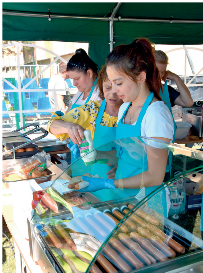
Uczestnicy warsztatu gastronomicznego podczas imprezy plenerowej