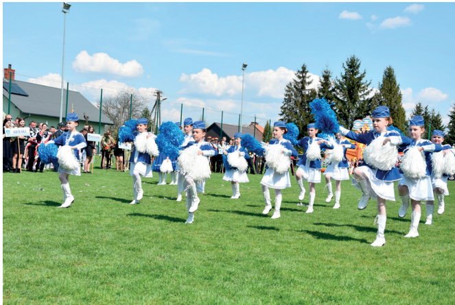
Zespół Mażorettek z Grzęski - grupa młodsza