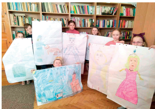
Ferie w bibliotece w Gorliczynie