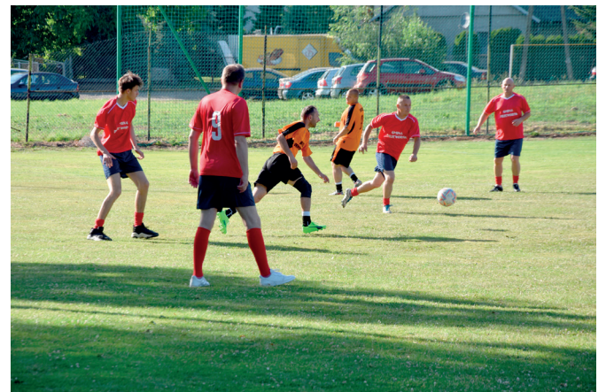
Mecz oldbojów Mirocin z Gminą Przeworsk