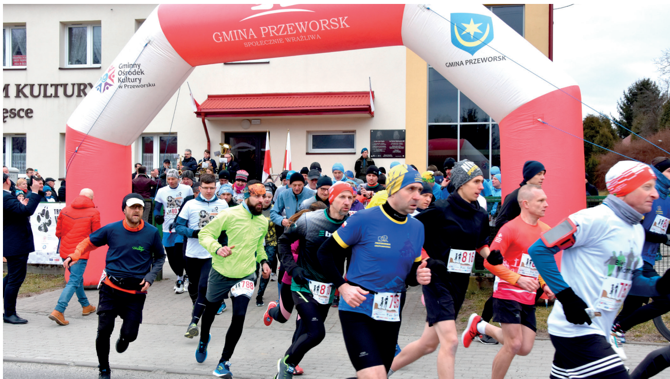
Start biegu, Grzęska

W niedzielę, 6 marca odbył się jubileuszowy X Bieg Pamięci Żołnierzy Wyklętych, tysiące biegaczy w kilkuset miastach w Polsce i na świecie wzięło udział w tym wydarzeniu, dając świadectwo swojego patriotyzmu.