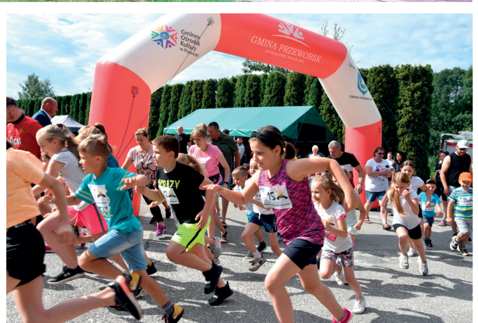
Bieg po „Muszlę Św. Jakuba” na dystansie 400 m