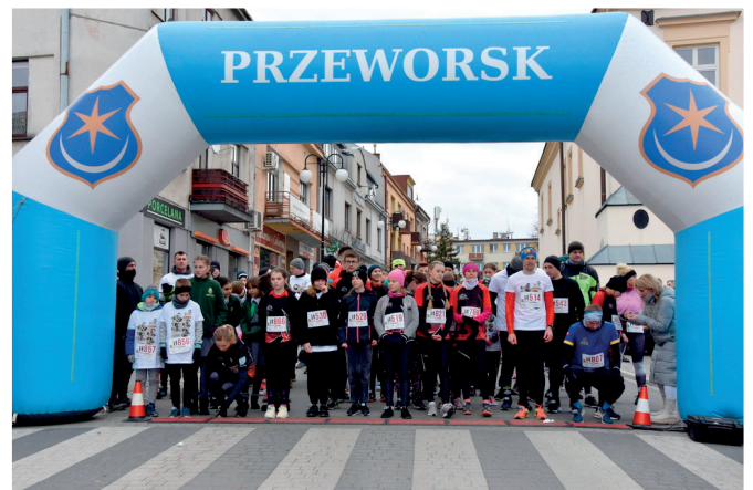
Drugi dystans biegu, Przeworsk Rynek