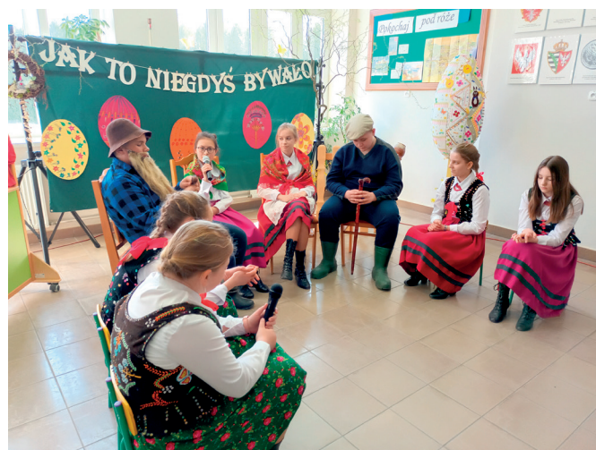
„Jak to niegdyś w Ujeznej bywało...”

19 kwietnia, tuż po Świętach nasi młodzi aktorzy jeszcze raz zaprezentowali się, ale już przed większą publicznością. Uświetnili bowiem spotkanie Kół Gospodyń Wiejskich z naszej gminy oraz zaproszonych gości w ramach obchodów Świąt Tradycji Wielkanocnych. Ponownie można było zobaczyć i posłuchać naszych uczniów w otoczeniu pięknej świąteczno - wiosennej dekoracji. Występ naszych uczniów nagrodzony został gromkimi brawami !