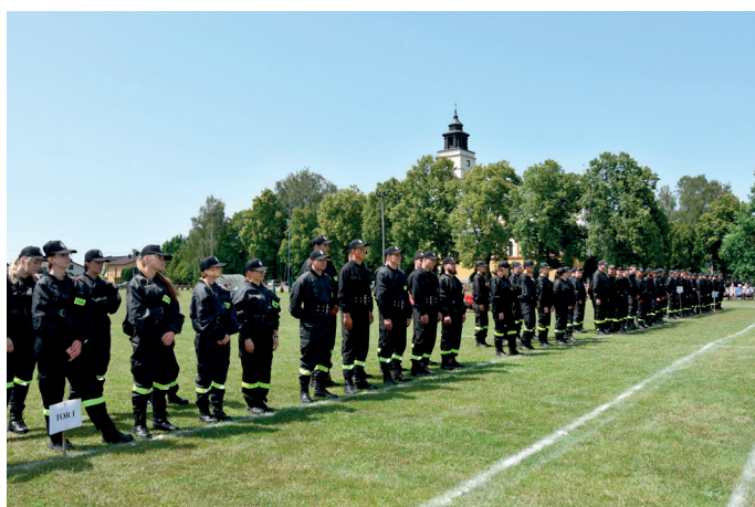
Druhowie OSP z terenu Powiatu Przeworskiego