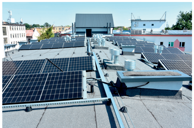
Panele fotowoltaiczne na dachu Urzędu Gminy w Przeworsku

Wartość robót to ponad 1 mln 660 tys. zł z czego 95% to dofinansowanie z programu Polski Ład. Moc zainstalowanych instalacji wyniesie około 456 kWp. Trwają także starania o pozyskanie dofinansowania na montaż instalacji fotowoltaicznych na pozostałych obiektach gminnych.