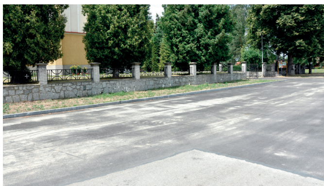
Parking przy kościele