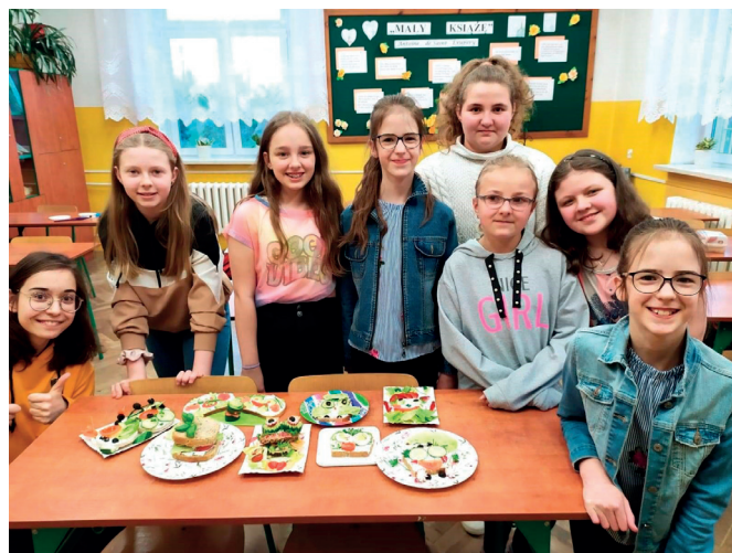
Najciekawsze, zdrowe kanapki w wykonaniu uczniów

ustaliła zasady konkursu na najciekawszą, zdrową kanapkę. Okazało się, że efekt działań młodych adeptów sztuki dietetyczno-kulinarnej przerósł nasze najśmielsze oczekiwania. Na szkolnych stolikach zamiast podręczników i zeszytów zaroilo się od smakowicie wyglądających wytworów małych rąk ludzkich. Cieszymy się, że wykonane zostały pamiątkowe zdjęcia, bowiem kanapki równie szybko zniknęły, jak się pojawiły.