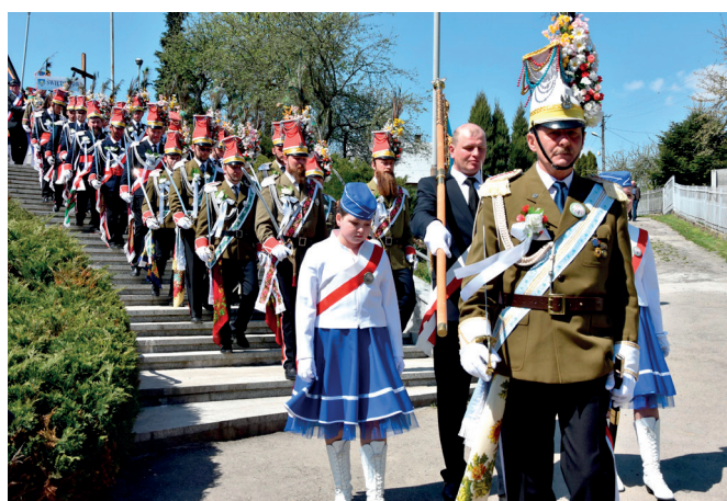
Straż Grobowa z Grzęski