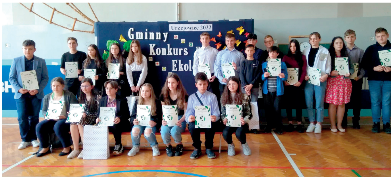
Uczestnicy Gminnego Konkursu Ekologicznego

W maju w Szkole Podstawowej w Urzejewicach odbył się Gminny Konkurs Ekologiczny. W konkursie wzięło udział 23 uczniów szkół z terenu Gminy Przeworsk. Głównym celem konkursu było propagowanie działań proekologicznych, kształtowanie właściwych postaw oraz zwiększanie poziomu świadomości ekologicznej wśród młodzieży. Komisja konkursowa wyłoniła laureatów konkursu: