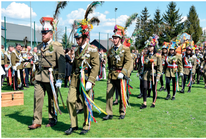
Straż Grobowa z Rozborza