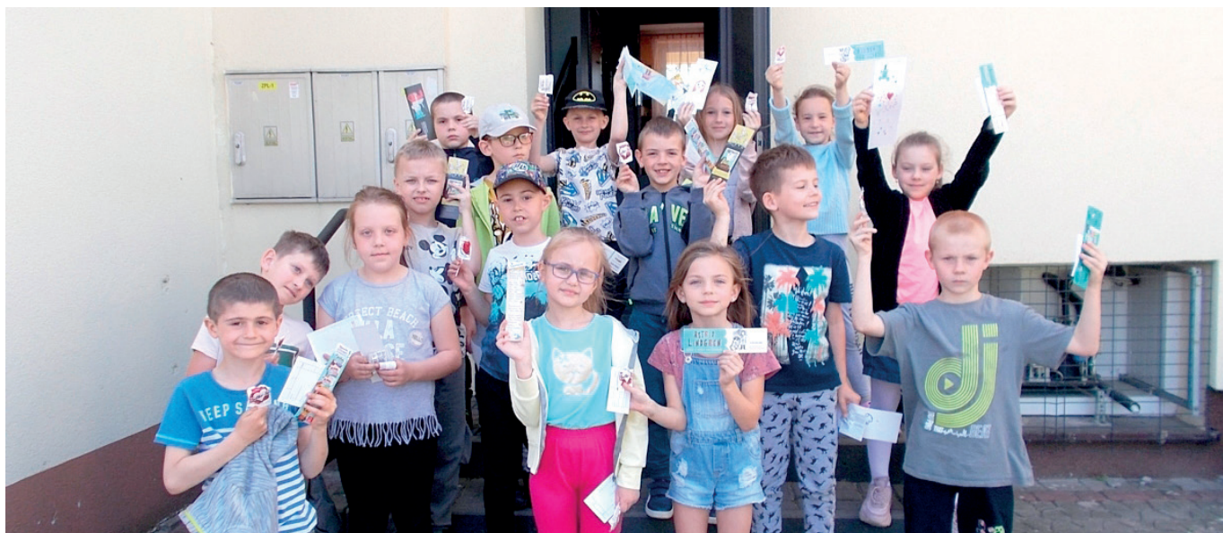
Ogólnopolski Tydzień Bibliotek w Bibliotece w Świętoniowej

Organizując tegoroczny XIX Ogólnopolski Tydzień Bibliotek chcieliśmy zaszczerpić w naszych małych czytelnikach miłość do książek i biblioteki oraz poszerzyć ich wiedzę na temat zawodów związanych z książkami. Dorostym, najbardziej aktywnym czytelnikom rozdaliśmy książki.