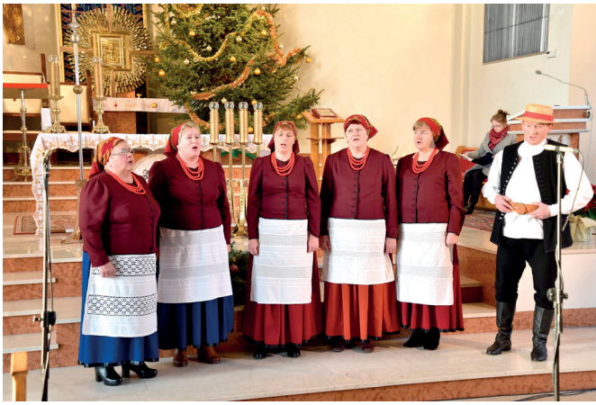
Zespół Śpiewaczy Ujeźniacy z Ujeznej

W XXVI Przeglądzie „Godnie Święta” w dniu 29 stycznia w Miejskim Domu Kultury w Przeworsku zaprezentowały się trzy zespoły działające przy Gminnym Ośrodku Kultury w Przeworsku. Reprezentowali nas: Zespół „Grzęszczaneczki” z Grzęski, Zespół Śpiewaczy „Cantus” z Gorliczyny oraz Zespół Kolędniczy „Raj” w Ujeznej.