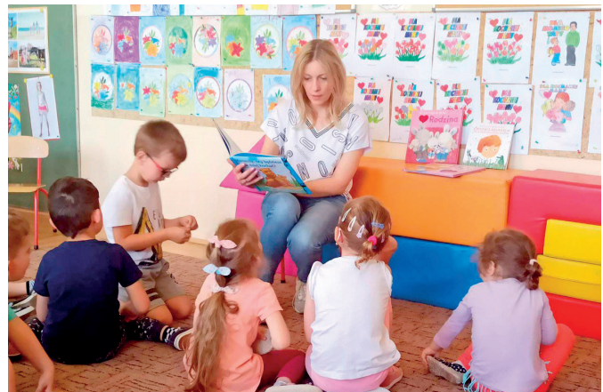
Zajęcia z przedszkolakami ze Studziana