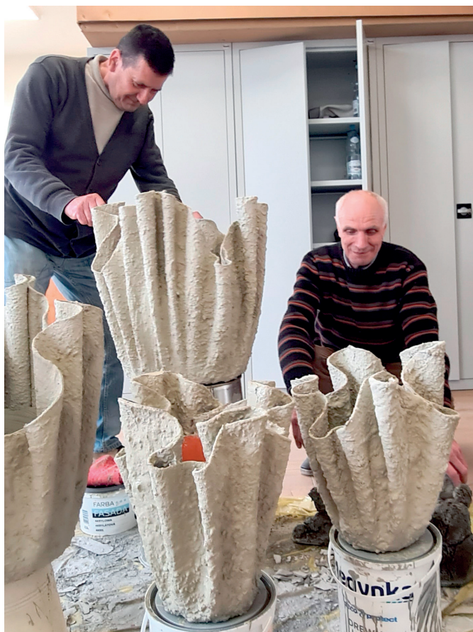
Uczestnicy warsztatu rekreacyjno - gospodarczo - animacyjnego

zwolni na kontynuację działalności Centrum, z jednoczesnym jego poszerzeniem o zwiększoną liczbę uczestników warsztatu rekreacyjno - gospodarczo - animacyjnego, ponieważ jak pokazał miniony rok, największe zapotrzebowanie jest na tego typu działania. Łącznie z wsparcia w nowym projekcie skorzysta minimum 40 osób. W projekcie zaplanowane są środki na kursy zawodowe, które zostaną dostosowane do predyspozycji uczestników oraz zakup profesjonalnego sprzętu i kolejnego wyposażenia. Zakupiony zostanie m.in. traktorek z zabudową i osprzętem (pług do śniegu, kosiarka bijakowa, posypywarka soli i piasku) oraz sprzęty pozwalające poszerzać zakres prac porządkowych np. myjka ciśnieniowa, kolejna odśnieżarka i dmuchawa do liści oraz agregat prądowórczy. Doposażymy warsztat gastronomiczny w profesjonalny grill gazowy, a krawiecki w prasy transferowe i sublimacyjne, maszynę typu overlock i materiały eksploatacyjne.