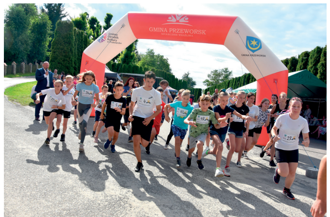
Bieg po Muszlę św. Jakuba na dystansie 800 m