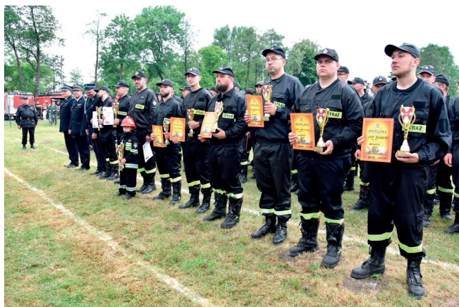
Laureaci zawodów w grupie A