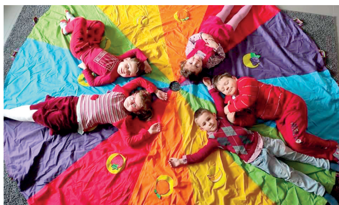
Dzieci z Ujeźnej biorące udział w akcji Ferie w bibliotece

Bohaterami tegorocznej akcji „Ferie w bibliotece” były postacie z dawnych dobranoczek. Spotkania miały na celu przybliżenie i popularyzację literatury dziecięcej oraz kultowych dobranoczek łączących pokolenia. Uczestnicy mieli wspaniałą okazję do odbycia fascynującej podróży po bajkowym świecie. Kto z pokolenia 40+ nie wspomina z sentymentem Misia Uszatka, Bolka i Lolka, pszczołki Mai i ich zabawnych i pouczających przygód? Dzieci biorące udział w zajęciach nie zawsze kojarzyły wszystkich bohaterów dawnych dobranoczek, ale z zainteresowaniem słuchały czytanych bajek, rozwiązywały literackie zagadki i wykonywały ilustracje.