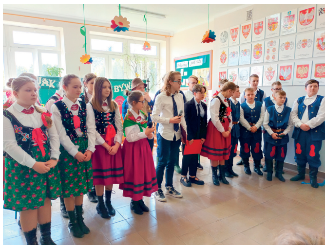
„Jak to niegdyś w Ujeznej bywało...”