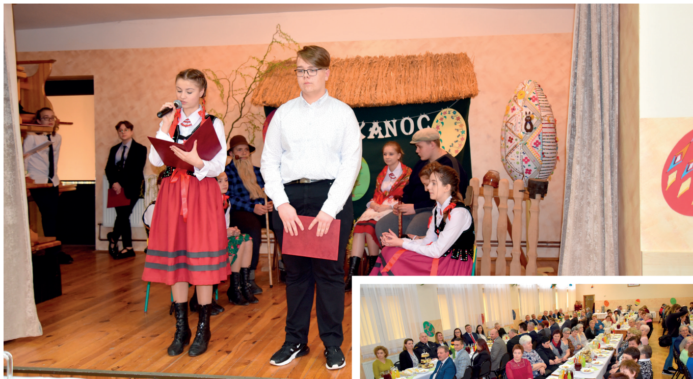
Program artystyczny w wykonaniu uczniów ze Szkoły Podstawowej w Ujeznej

Święta Wielkanocne to wyjątkowy czas, w którym obrzędy religijne splatają się z tradycją ludową. Przez wieki powstało wiele obrzędów i zwyczajów, związanych z tymi Świętami, z których wiele przetrwało do dnia dzisiejszego. Dzięki owocnej współpracy z lokalnymi Kołami Gospodyń Wiejskich mieliśmy możliwość zaprezentować te tradycje, w tym roku w Ujeznej.