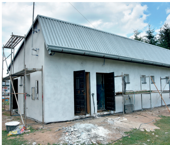
Budynek remontowanej szatni w Grzędzie