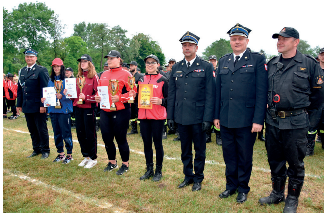
Laureaci zawodów w grupie C