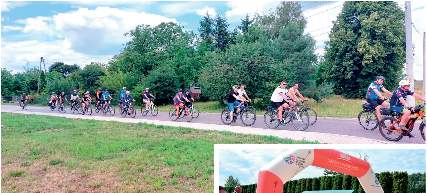
V Jakubowy Rajd Rowerowy na trasie

Drugi dzień Euroregionalnych Dni Jakubowych rozpoczęło poranne X Jubileuszowe Niedzielne Pielgrzymowanie.