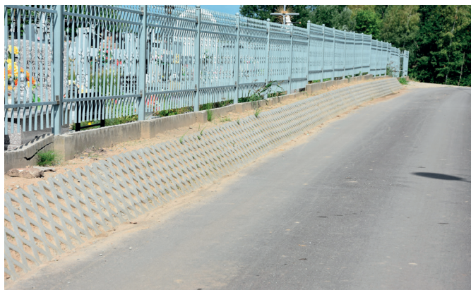
Umocniona skarpa w Urzejowicach

Na terenie całej Gminy w ramach bieżących remontów wykonano remonty cząstkowe dróg gminnych o nawierzchni bitumicznej, usunięto ubytki za pomocą masy bitumicznej na gorąco. Na bieżąco koszone są pobocza przy drogach gminnych i dojazdowych. Obecnie trwają prace związane także z remontem dróg dojazdowych. Istniejące nawierzchnie dróg są wyrównywane, a ubytki uzupełniane tłuczniem kamiennym. W ramach poprawy bezpieczeństwa mieszkańców przy drogach gminnych