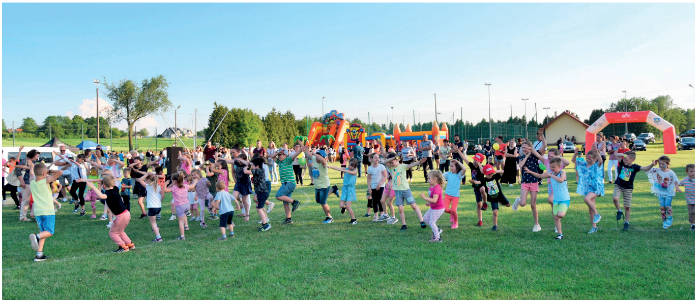
Dzieci podczas zabawy z animatorem