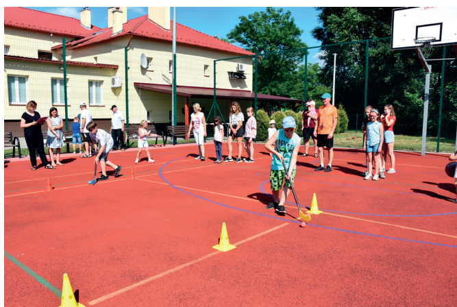
Konkurencje sportowe dla dzieci