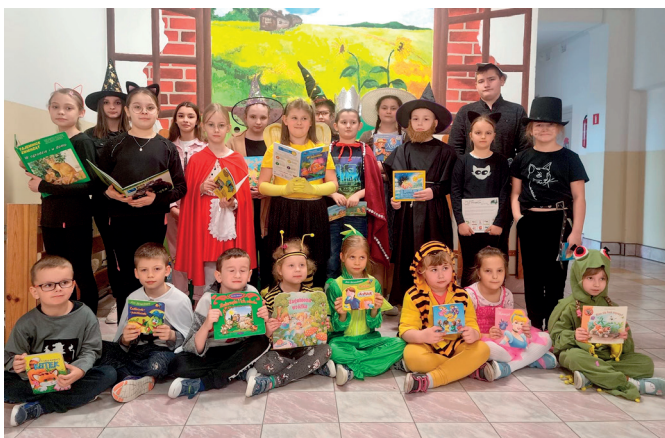
Światowy Dzień Książki i Praw Autor- skich

Świętując zaś Światowy Dzień Książki i Praw Autor- skich starsi i młodszy wcieli się w ulubione postacie literac- kie i czytali wybrane fragmenty.