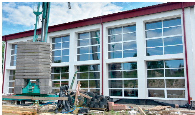
Sala gimnastyczna w Mirocinie