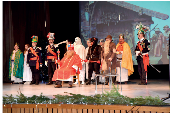
Grupa kolędnicza Raj z Ujeznej