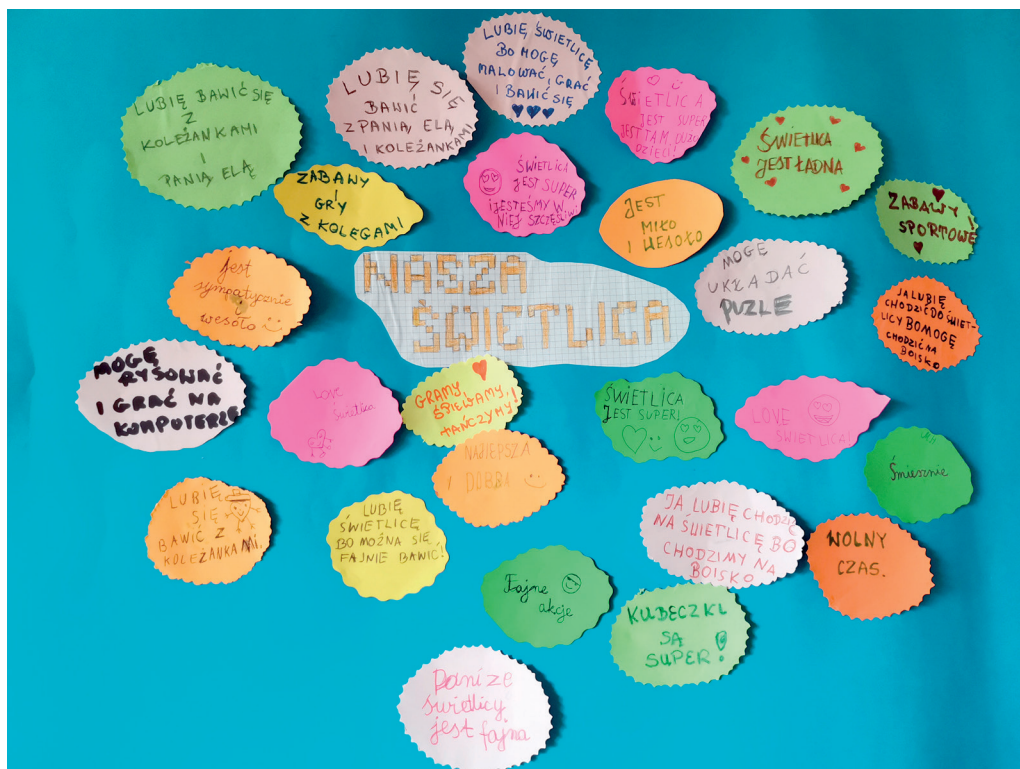
Praca wykonana przez dzieci ze świetlicy