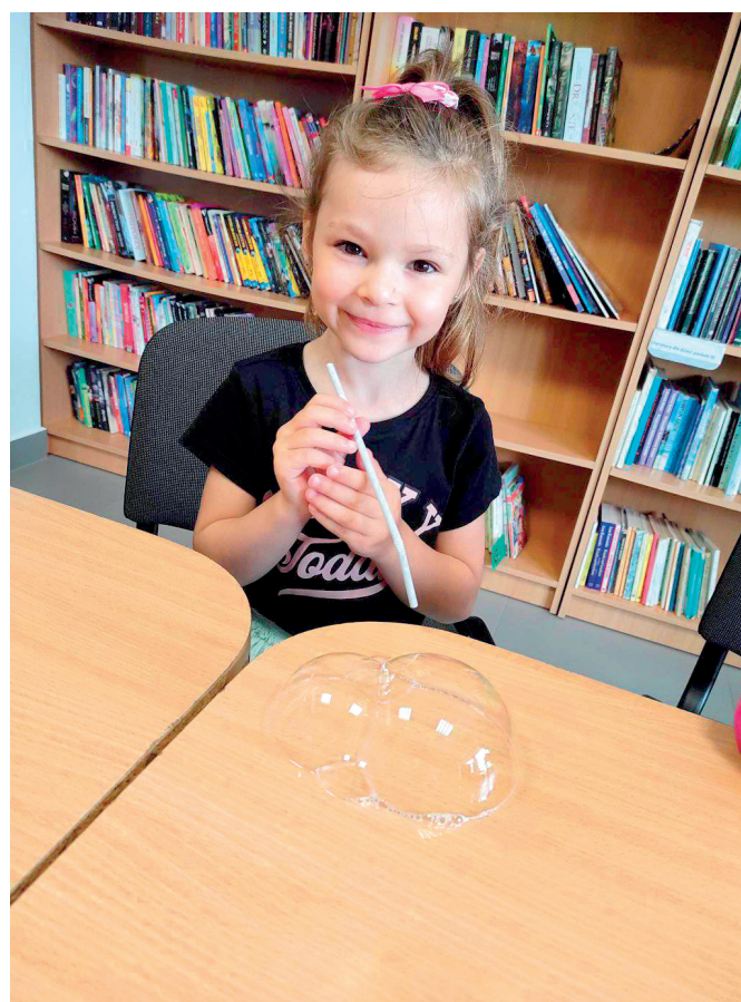
Zajęcia podczas Ogólnopolskiego Tygodnia Bibliotek w Ujeznej

W Urzejowicach i Studzianie uczestnicy wcielili się w rolę pisarzy i ilustratorów tworząc swoje pierwsze dzieła literackie. W Grzęsce dzieci zaprojektowały i wykonały kartę tytułową do swojej ulubionej książki, a w Ujeznej przeprowadziły eksperymenty używając produktów, które każdy z nas ma w domu. Dzieci dowiedziały się jak można nadmuchać balon przy pomocy sody i octu, poznały przepis na domowe bańki mydlane, oraz wykonywały eksperyment przy pomocy mleka, barwników i płynu do naczyń. W Mirocinie dzieci zapoznały się z biblioteką, dowiedziały się na czym polega praca bibliotekarza oraz uczestniczyły w grach i zabawach na świeżym powietrzu. W Świętoniowej uczniowie poznali zasady funkcjonowania biblioteki i korzystania z jej zbiorów. Dowiedzieli się również jakie są etapy powstawania książki i kto przyczynia się do tego, że piękne kolorowe bajki trafiają w ręce czytelnika. Bibliotekę w Gorliczynie odwiedziły przedszkolaki, które dowiedziały się, co należy zrobić, aby stać się czytelnikiem, a w nawiązaniu do czytanej wiersza „Rzepka” Juliana Tuwima miały okazję spróbować swoich sił w przeciąganiu liny.