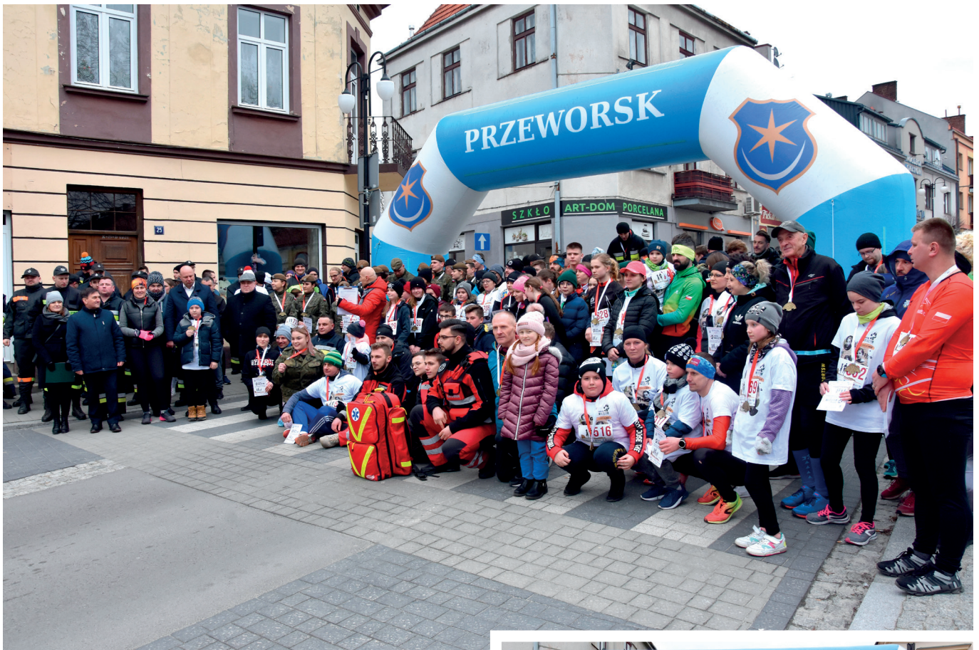
Uczestnicy Biegu Tropem Wilczym

Ten coroczny Bieg ma na celu oddanie hołdu żołnierzom polskiego podziemia antykomunistycznego działającego w latach 1944 – 1963 w obrębie przedwojennych granic RP. Jednak w tym roku impreza miała też inne znaczenie. Z jednej strony wspomniano polskich bohaterów, z drugiej zaś strony mówiono o tych, którzy za wschodnią granicą toczą walkę z okupantem. Podczas Biegu odbyła się zbiórka do puszek pod hasłem „Biegnijmy Ukraino z pomocą”, która miała na celu wsparcie ofiar wojny na Ukrainie.