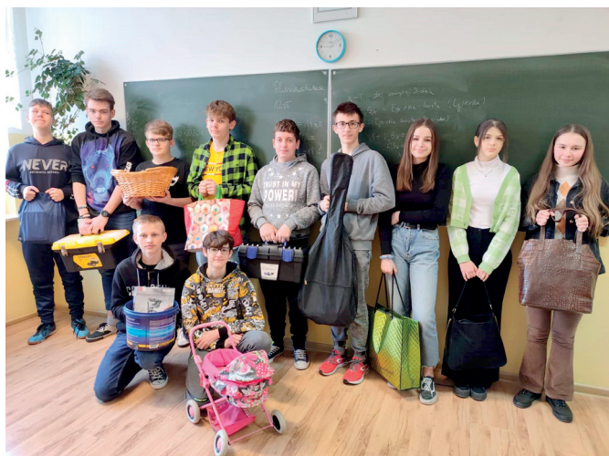
Dzień bez plecaka

13 kwietnia uczniowie klasy IV i V uczcili obchody Święta Chrztu Polski. Wszyscy mogli oglądać dylematy Mieszka, który dla dobra kraju godzi się na warunki stawiane m.in. przez białogłową, czyli swą przysłą żonę. Na zakończenie błogosławiąc, święty Wojciech „pokropił” zgromadzonych przypominając w ten sposób, że już wkrótce lany poniedziałek.