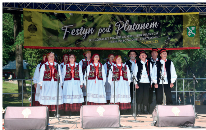
Zespół Śpiewaczy Cantus z Gorliczyny