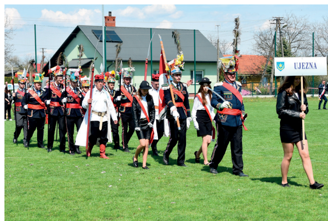
Grupa Kosynierów oraz Straż Grobowa z Ujeznej