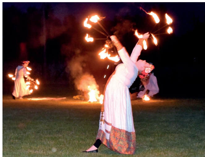
Pokaz ognia w wykonaniu grupy Fire Charmers

wanych w tym wyjątkowym dniu. Na najmłodszych czekała masa atrakcji, od dmuchańców, zjeżdżalni, poprzez gry i zabawy ruchowe. Nie zabrakło malowania twarzy, gigantycznych baniek mydlanych oraz słodkiego stoiska przygotowanego przez Koło Gospodyń Wiejskich w Studzianie. Nad dobrą zabawą maluchów czuwała grupa animatorów, która dostarczyła najmłodszym wielu wrażeń.