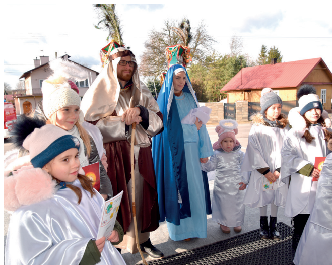
Uczestnicy Orszaku Trzech Króli