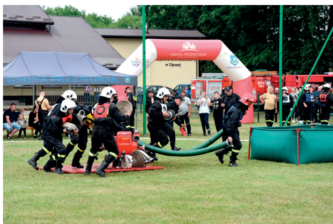
Zawody Sportowo-Pożarnicze w Ujeznej

W Gminnych Zawodach Sportowo-Pożarniczych w Ujeznej, które odbyły się 4 czerwca, wzięło udział 9 jednostek OSP z terenu Gminy Przeworsk w kategoriach A i C. Poszczególne drużyny rywalizowały ze sobą w musztrze oraz ćwiczeniach bojowych.