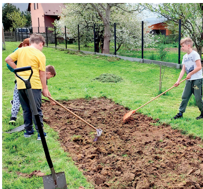
Prace przy łące