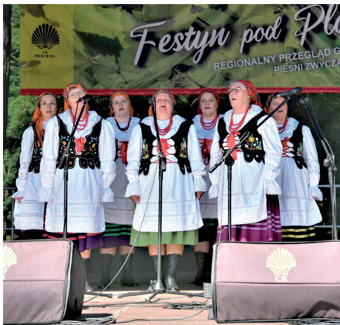
Zespół Śpiewaczy Grzęczczanie z Grzęski

W kategorii Zespoły Śpiewacze – III miejsce zajął Zespół Śpiewaczy „Studzienczanki” ze Studziana.