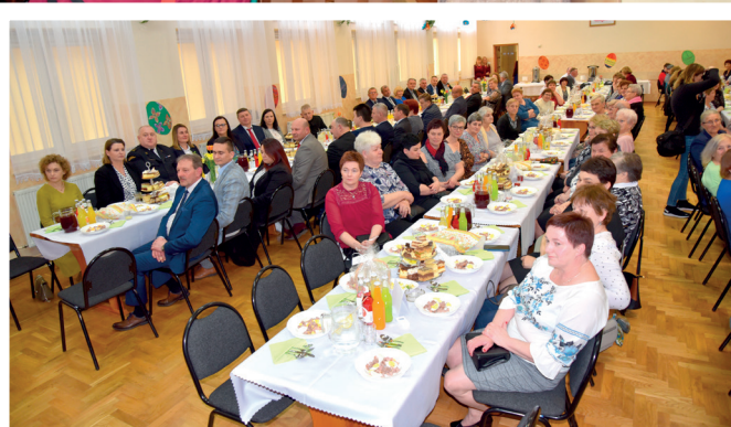
Gminne Święto Tradycji Wielkanocnych w Ujeznej

Po uroczystym otwarciu swój program artystyczny zaprezentowali uczniowie ze Szkoły Podstawowej im. bł. ks. Jana Balickiego w Ujeznej. Młodzież wykonała widowisko nawiązujące do dawnej tradycji i zwyczajów wielkanocnych „Jak to niegdyś w Ujeznej bywało”.