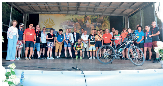
Uczestnicy Rajdu Rowerowego