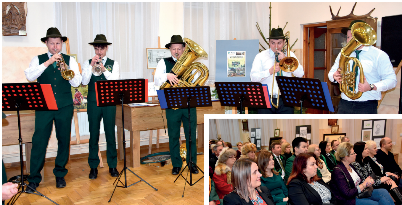
Zespół Sygnalistów Myśliwskich Quinet Alohabrass

Trofea, przedmioty związane z kulturą łowiecką gościły w marcu we Wiejskim Domu Kultury w Ujeznej. Wystawa Łowiecka, której tematem była „Rola łowiectwa w czasach współczesnych” została zorganizowana przez Wójta Gminy Przeworsk i Koło Łowieckie „Bazant” z Przeworska.