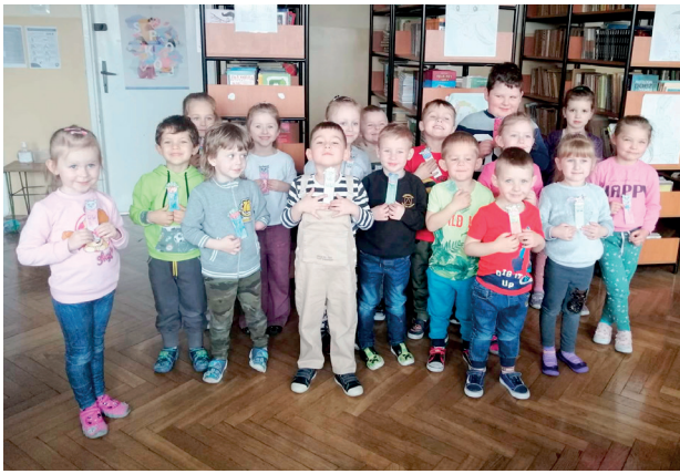
Przedszkolaki w bibliotece szkolnej z okazji Światowego Dnia Książki

Ważnym przedsięwzięciem wpływającym znacznie na poprawę jakości pracy naszej szkoły było uzyskanie dzięki rządowemu programowi i finansowemu wsparciu Wójta Gminy w Przeworsku dofinansowania do Narodowego Programu Rozwoju Czytelnictwa Priorytet 3. W związku z tym biblioteka szkolna wzbogaciła księgozbiór o nowości i bestsellery czytelnicze.