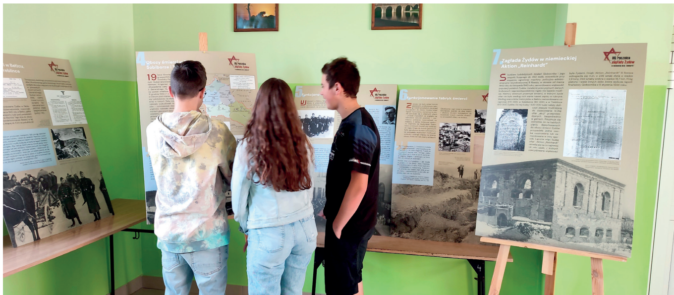
Wystawa - Holocaust

„Widzimy, co dzieje się wokół granic Ukrainy, widzimy, co dzieje się w licznych częściach świata. Czujemy też wzrost zbędnych napięć i groźnych powiewów hasel antysemickich i rasistowskich. Czujemy rosnącą obojętność i bierność. Świat nie wyciągnął lekcji z drugiej wojny światowej”- to fragment wypowiedzi ze strony internetowej Muzeum Auschwitz- Birkenau.