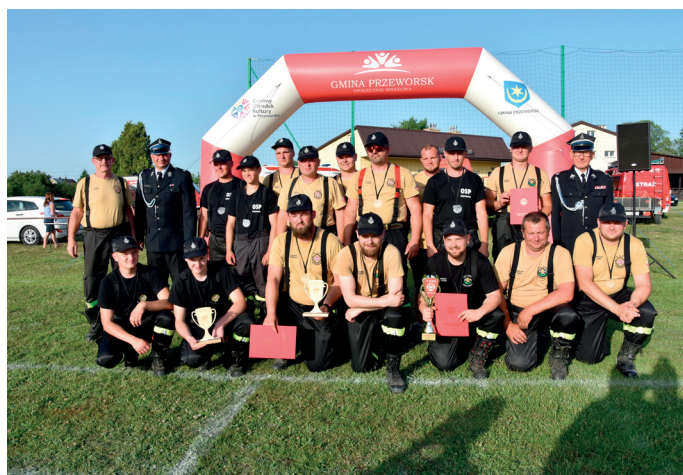
OSP Świętoniowa i OSP Urzejowice

1. OSP Widaczów, 2. OSP Sietesz, 3. OSP Gać, 4. OSP Czerwona Wola, 5. OSP Maćkówka, 6. OSP Świętonio-