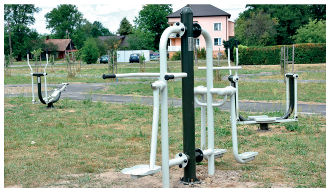
Urządzenia na siłowni zewnętrznej