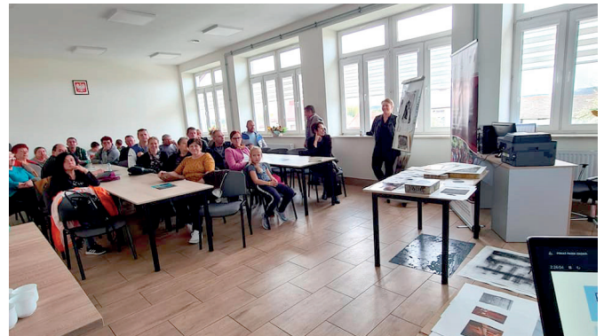
Konferencja w CIS w Chałupkach z udziałem Gości ze Słowacji