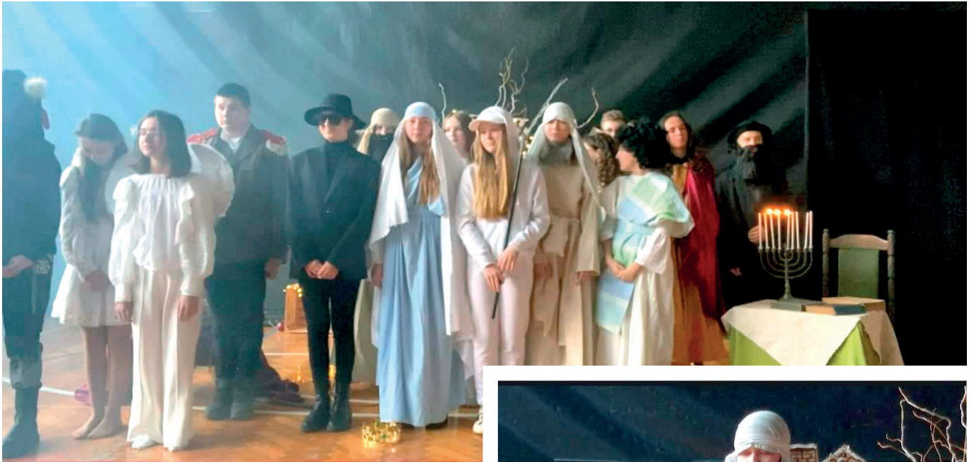
Młodzież podczas przedstawienia

W lutym 2022 roku zakończyliśmy trwający od września 2021 projekt „Raj – wskrzeszamy lokalne tradycje” realizowany przez Bibliotekę Publiczną Gminy Przeworsk z siedzibą w Urzejowicach i młodzież z Urzejowic. W projekcie finansowanym przez Polsko-Amerykańską Fundację Równości brało udział 16 młodych ludzi w wieku od 13 do 19 lat. Na nasze przedsięwzięcie uzyskaliśmy dofinansowanie w kwocie 8.500,00 złotych.