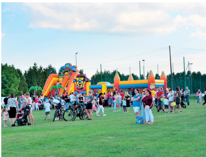
Strefa zabaw dla dzieci

wanych w tym wyjątkowym dniu. Na najmłodszych czekała masa atrakcji, od dmuchańców, zjeżdżalni, poprzez gry i zabawy ruchowe. Nie zabrakło malowania twarzy, gigantycznych baniek mydlanych oraz słodkiego stoiska przygotowanego przez Koło Gospodyń Wiejskich w Studzianie. Nad dobrą zabawą maluchów czuwała grupa animatorów, która dostarczyła najmłodszym wielu wrażeń.