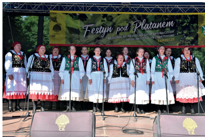
Zespół Śpiewaczy Studzienczanki ze Studziana