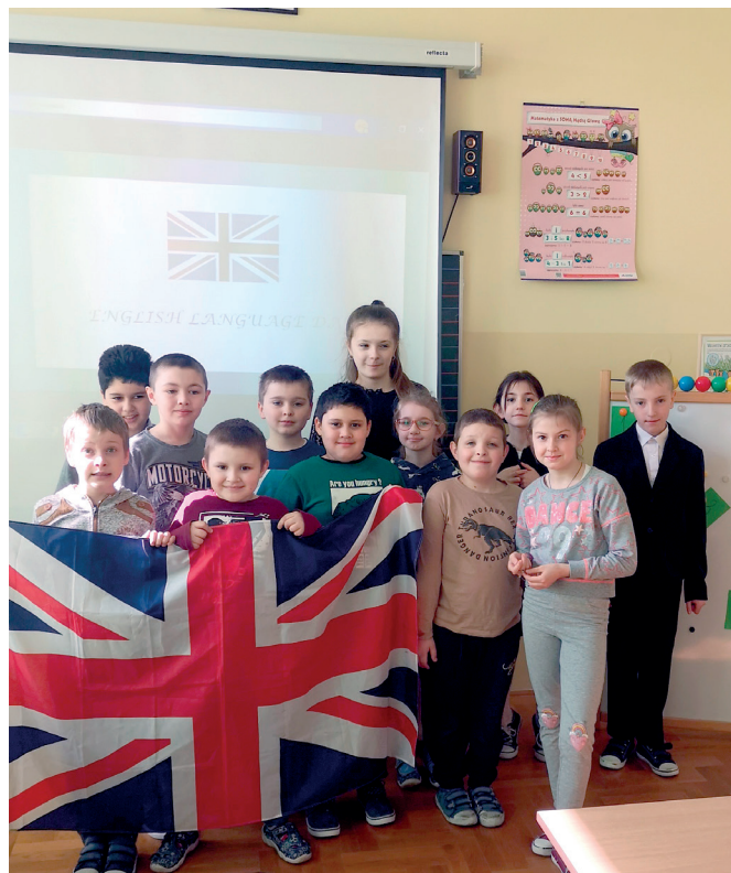
Dzień języka angielskiego