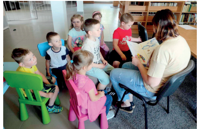
Ogólnopolski Tydzień Głośnego Czytania w Ujeznej