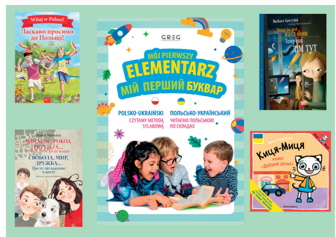
Literatura dla najmłodszych