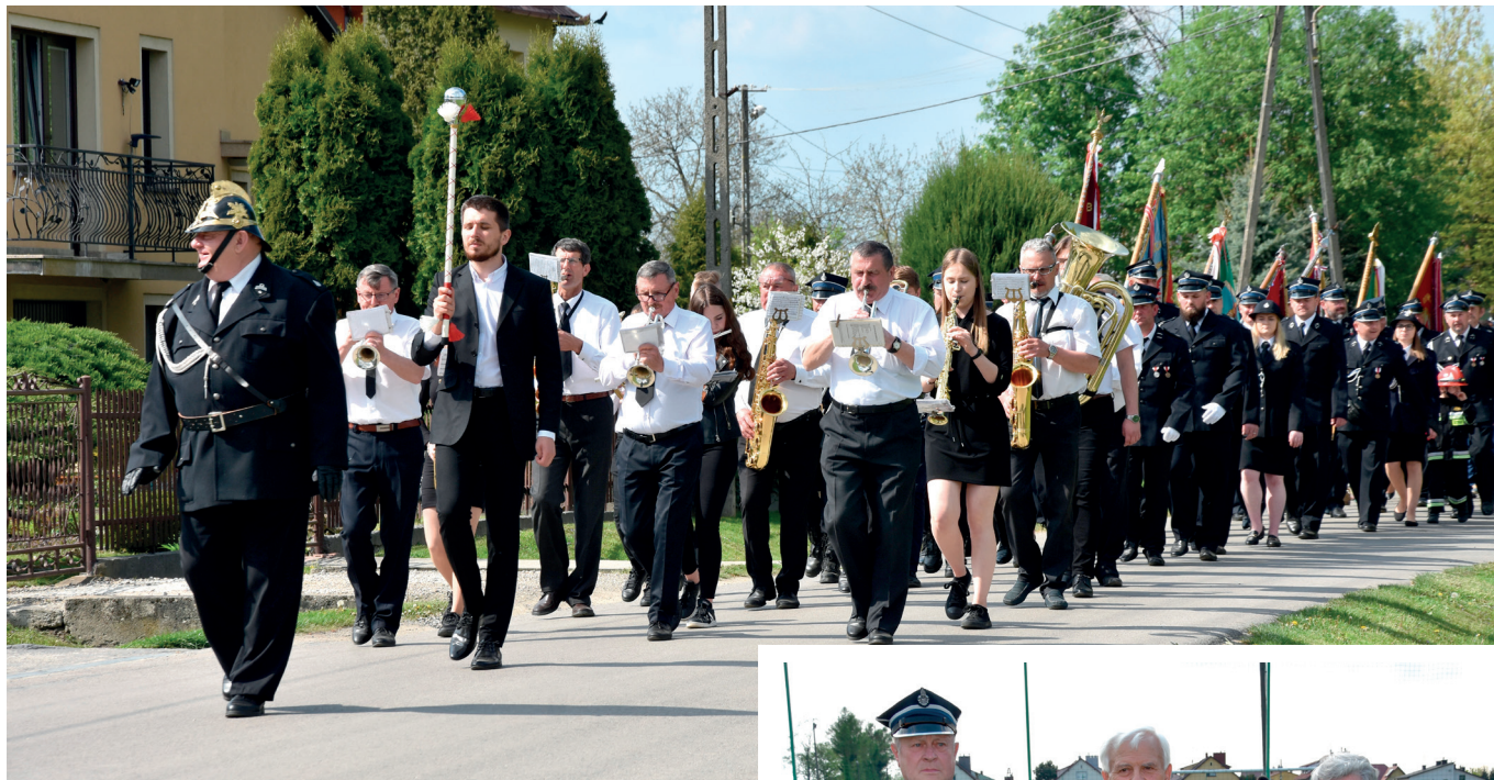
Orkiestra Dęta Gminy Przeworsk prowadziła kolumnę defiladową