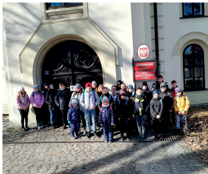
Uczestnicy zimowiska zwiedzili m.in. zamek w Żywcu

W dniach 12-19 lutego br. odbyło się zimowisko dla 11 dzieci rolników z terenu Gminy Przeworsk. Organizatorami wycieczki zimowej byli NSZZ Rolników Indywidualnych „Solidarność” oraz Wójt Gminy Przeworsk. Łączny koszt dofinansowania przez Gminę Przeworsk to kwota 6700 zł w tym 1700 zł transport i 5000 zł. za pobyt dzieci. Warunkiem uczestnictwa w zimowisku było opłacenie składki KRUS przez jednego z rodziców. W trakcie zimowiska dzieci skorzystały z aquaparku w Wiśle, zwiedziły Koniaków, Jaworzynkę, Leśny Ośrodek Edukacji Ekologicznej w Istebnej oraz zamek w Żywcu. Jedną z atrakcji był również wyjazd kolejką linową na najwyższy szczyt Beskidu Sądeckiego. Dzieci pełne wrażeń i pozytywnej energii wróciły do swoich domów.