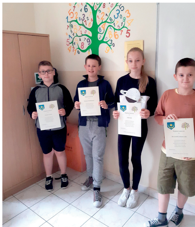
Matematyczny Konkurs Czar Par

Konkurs cieszy się dużym zainteresowaniem, o czym świadczy uczestnictwo uczniów ze wszystkich szkół gminy.