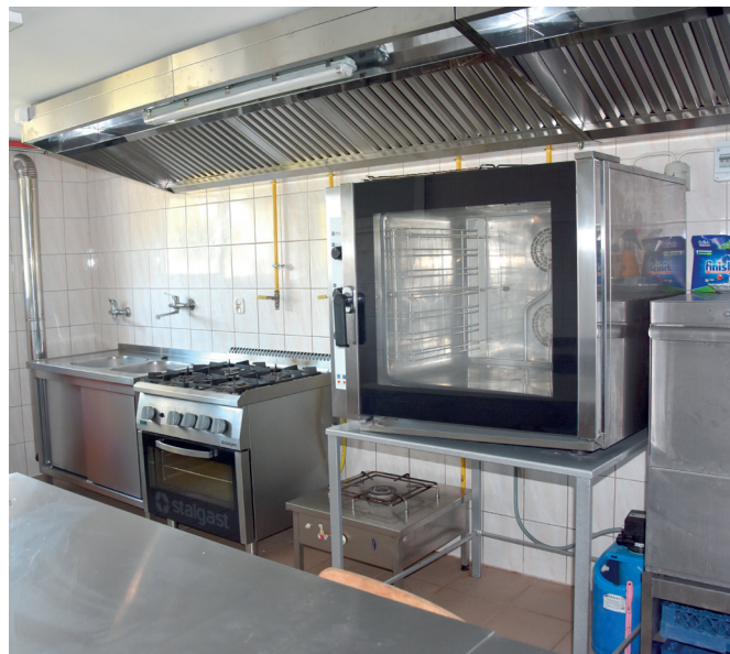
Nowe wyposażenie kuchni w WDK w Świętoniowej

W WDK w Świętoniowej ze środków finansowych Funduszu Sołeckiego wyposażono pomieszczenie kuchni. W pomieszczeniu pojawiły się stoły, regały oraz okapy ze stali nierdzewnej. Dodatkowe wyposażenie zakupiono również do kuchni WDK w Urzejowicach. W pomieszczeniu pojawiła się nowa stacja zmiękczająca wodę oraz podstawa pod piec gastronomiczny. Koszt to ponad 40 tys. zł.