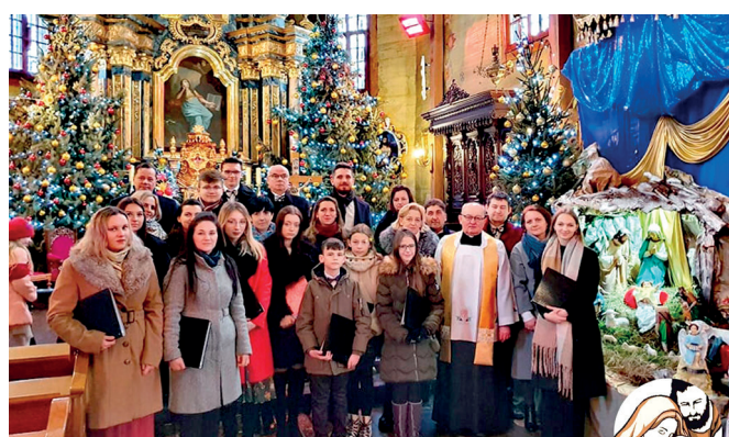
Chór Veritas z Nowosielec