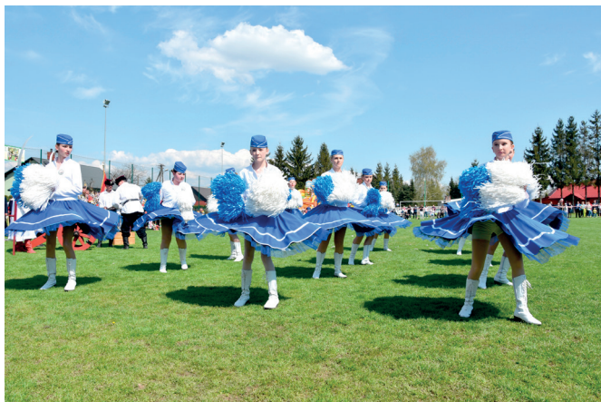
Zespół Mażorettek z Grzęski - grupa starsza