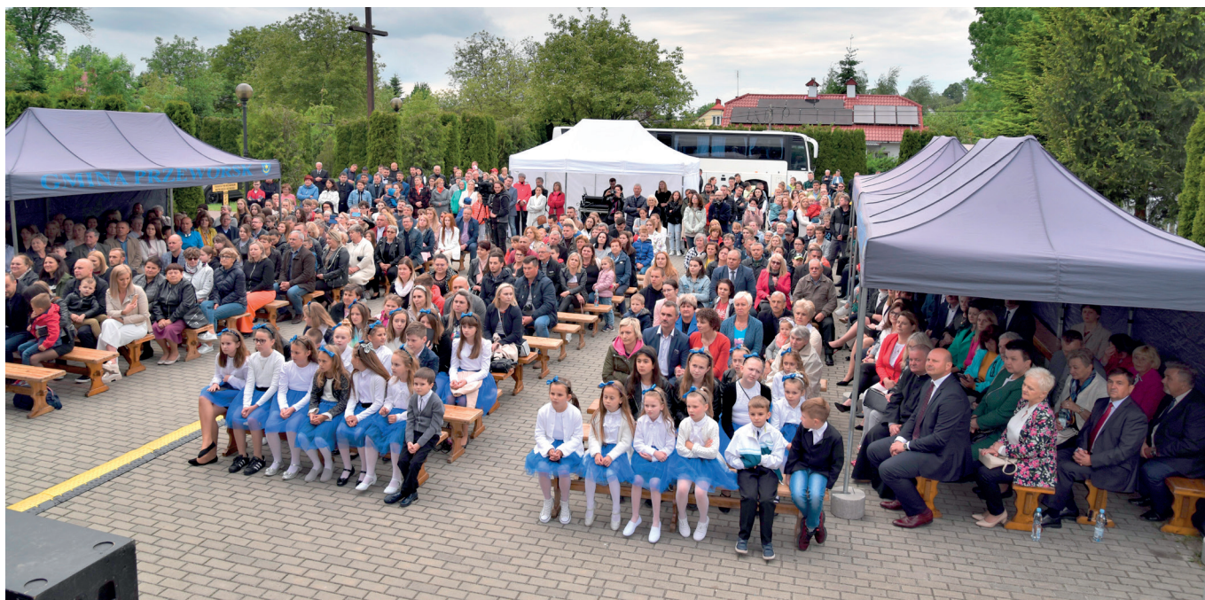
Koncert Uwielbienia, Rozbórz 2022