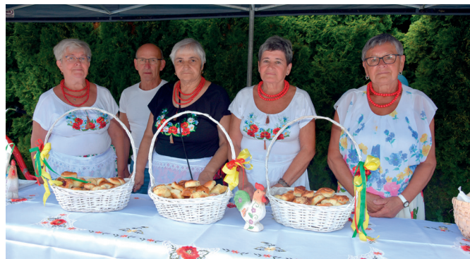
Koło Gospodyń Wiejskich z Nowosielec