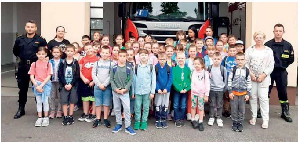
Klasy I-III w odwiedzinach w OSP Grzęska