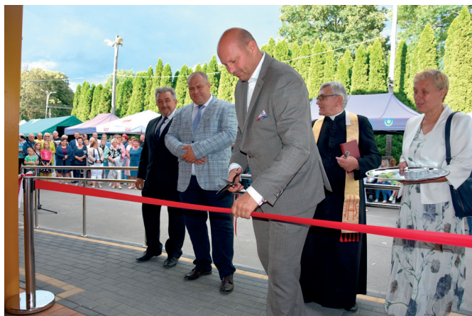
Przecięcie wstęgi i oficjalne otwarcie grzybka w Rozborzu

W lipcu został oficjalnie otwarty i poświęcony nowo wybudowany grzybek taneczny przy Wiejskim Domu Kultury w Rozborzu. Inwestycja na kwotę 420 tys. zł została zrealizowana w ramach zadania pn.: „Podłoga taneczna z urządzeniami budowlanymi i zadaszeniem dojazdu do podłogi tanecznej, rozbiórka istniejącej podłogi tanecznej przy WDK w Rozborzu”. Wykonana została podłoga taneczna parterowa o wymiarach w rzucie 9,78x11,50x10,47m z wolnostojącą sceną wyniesioną ponad poziom podłogi o 60cm. Ponadto od strony zachodniej od wejścia do budynku wykonano zadaszone dojsście do podłogi tanecznej.