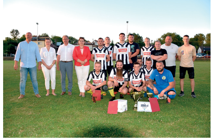
Gospodarze LKS „Start” Mirocin