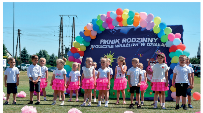
Występ przedszkolaków z Samorządowego Przedszkola Mali Odkrywczy