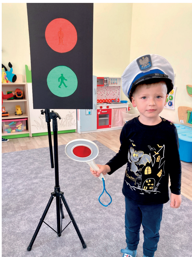
Dzieci uczą rodziców

„Dzieci uczą rodziców” to ogólnopolska akcja edukacyjna i szereg zajęć, w których uczestniczyły przedszkolaki z grupy młodszej z Przedszkola Samorządowego „Mali Odkrywcy” w Gorliczynie. „Dzieci uczą rodziców” to comiesięczne lekcje, na których przedszkolaki zdobywały wiedzę na temat bezpieczeństwa, ekologii, kultury i historii oraz podnosiły świadomość o otaczającym ich świecie. Jak nazwa wskazuje „Dzieci uczą rodziców” akcja miała na celu zachęcenie maluszków do rozmowy z rodzicami na tematy poruszane podczas zajęć. W ramach akcji zrealizowano m. in. zadania pt. „Bezpieczny uczeń”, „Magiczny las”, „Niepodległa Polska”, „Świąteczna Opowieść”, „Bezpieczne ferie”, „Niezwykła podróż”, „Odyseja kosmiczna”, „Zielona ziemia” oraz „Park Jurajski”. Do realizacji każdej lekcji, przedszkole otrzymało od Centrum Rozwoju Lokalnego materiały dydaktyczne w postaci ciekawych zagadnień tematycznych oraz kolorowanek dla dzieci, a za zrealizowane zadanie piękne kolorowe „Podziękowanie”.