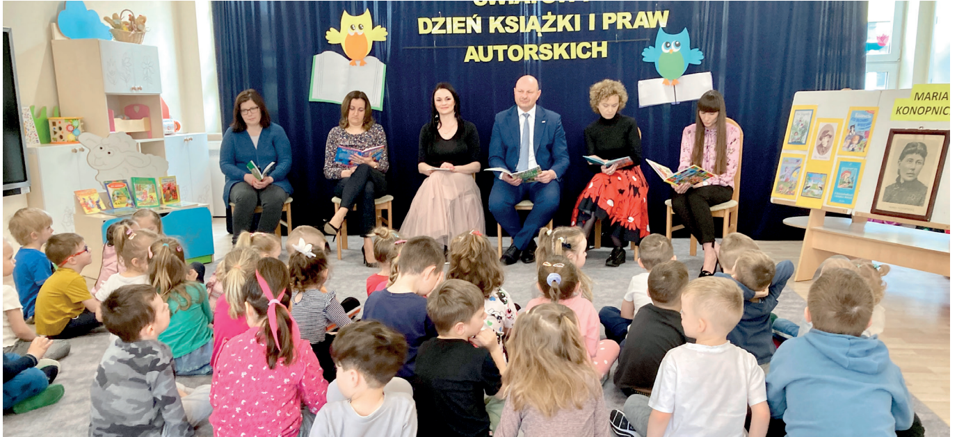
Magia w bajkach zaklęta

Magia bajek, wierszy, legend i baśni nie kryje się tylko w kształtowaniu wyobraźni, kreatywności i rozwoju mowy u dzieci. Bezcenny jest także czas spędzony wspólnie z bliskimi, czy to z mamą, tatą, babcią dziadkiem, panią w przedszkolu czy bibliotekarką. Diamentem jest interakcja pomiędzy opowiadającym, czytającym bajkę a dzieckiem.