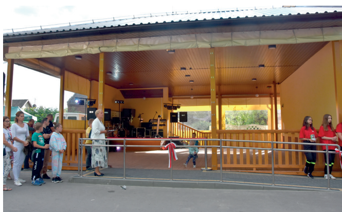
Grzybek przy WDK w Rozborzu

W WDK w Świętoniowej ze środków finansowych Funduszu Sołeckiego wyposażono pomieszczenie kuchni. W pomieszczeniu pojawiły się stoły, regały oraz okapy ze stali nierdzewnej. Dodatkowe wyposażenie zakupiono również do kuchni WDK w Urzejowicach. W pomieszczeniu pojawiła się nowa stacja zmiękczająca wodę oraz podstawa pod piec gastronomiczny. Koszt to ponad 40 tys. zł.