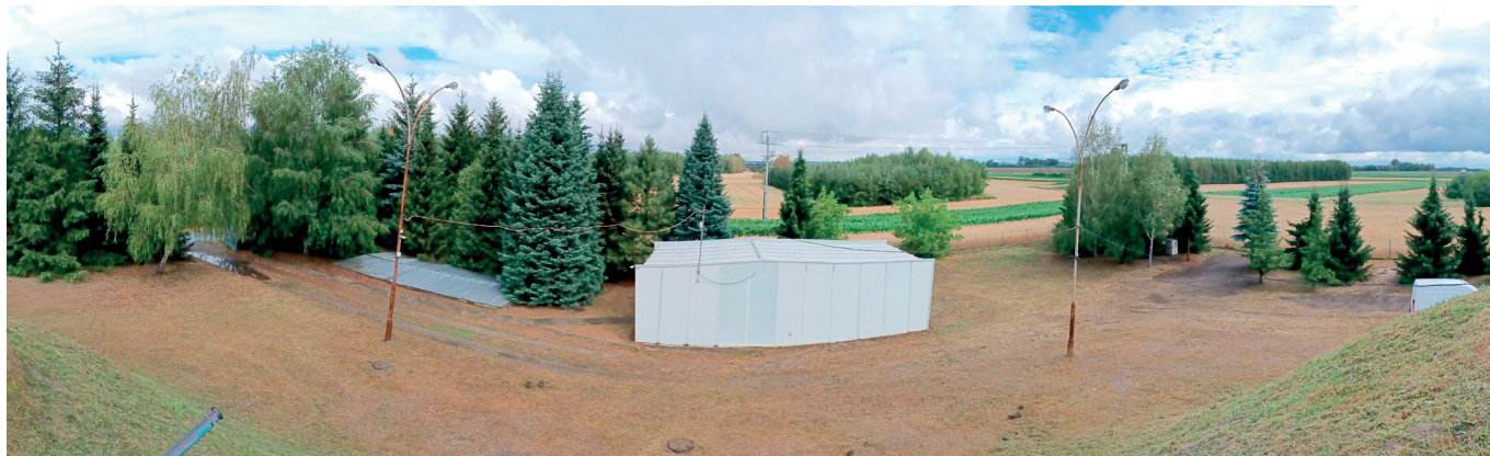
SUV w Świętoniowej przed rozpoczęciem inwestycji

Planowane przedsięwzięcie ułatwi życie mieszkańcom Gminy Przeworsk. Dzięki budowie nowej stacji uzdatniania wody, miejscowości Świętoniowa, Grzęska, Gwizdaj, Nowosielce, Gorliczyna, Chałupki oraz częściowo Studzian będą mogły korzystać z wody o lepszej jakości. Stacja uzdatniania wody powstanie w Świętoniowej, a inwestycja za prawie 7 mln zł, która ruszy już w najbliższym czasie i planuje się że potrwa do października 2023 roku obejmuje: rozbiórkę istniejącego budynku Stacji Uzdatniania Wody, rozbiórkę istniejących podziemnych zbiorników na surową i uzdatnioną wodę, budowę nowego budynku Stacji Uzdatniania Wody, budowę nowych zbiorników wody - dwa na wodę surową i dwa na wodę uzdatnioną, po 400 m 3 każdy, wykonanie utwardzonego dojazdu oraz placu manewrowego z kost-