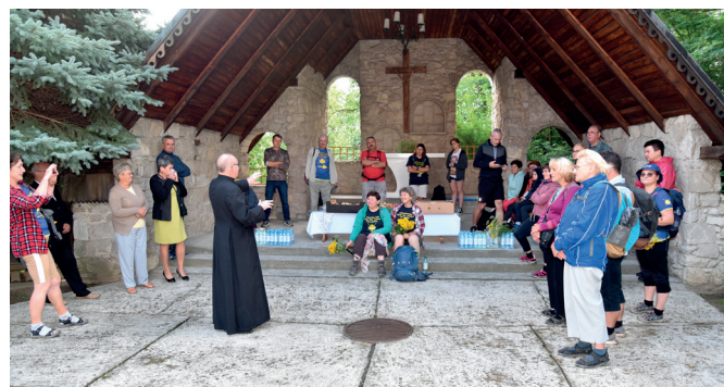
Niedzielne Jubileuszowe Pielgrzymowanie Drogą Św. Jakuba