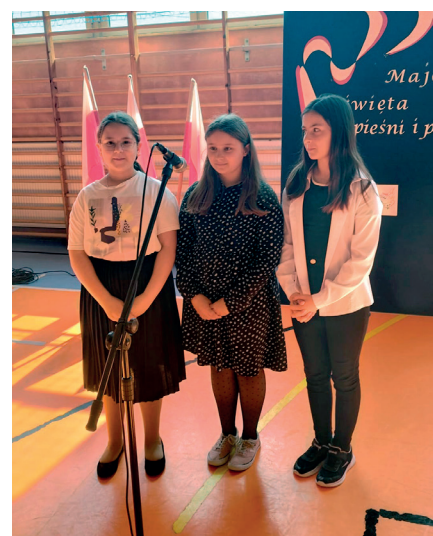
Szkolny konkurs poezji i piosenki patriotycznej

Uczniowie naszej szkoły aktywnie uczestniczą w różnego rodzaju wydarzeniach. Rokrocznie w marcu obchodzimy Narodowy Dzień Pamięci Żołnierzy Wyklętych. Dwudziestego pierwszego marca to Światowy Dzień Zespołu Downa. Nasza szkoła dołączyła w tym dniu do akcji „Wyjątkowa Skarpetka”. Pierwszy dzień wiosny to również „Dzień bez plecaka”. Niejedna osoba mogła