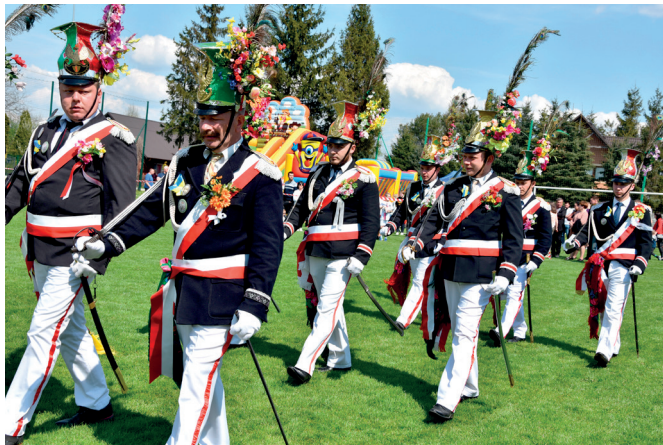
Straż Grobowa ze Świątoniowej