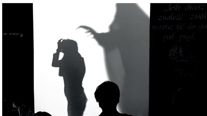
Teatr cieni – „Piotr”

Część artystyczna – teatr cieni „Piotr” – w wykonaniu uczniów poruszyła serca gości oraz skłoniła do refleksji na temat wartości w życiu człowieka, roli miłości, wychowania i więzów rodzinnych.