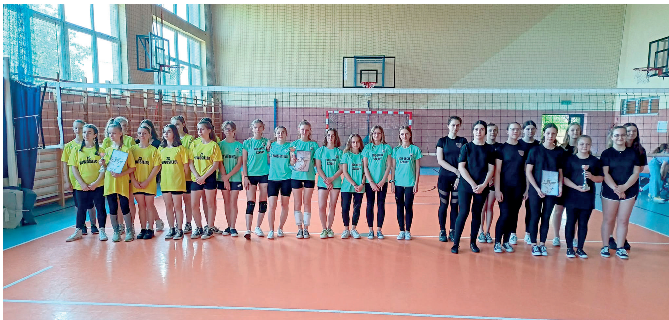
Międzyszkolny Turniej w Piłce Siatkowej dziewcząt

W czerwcu. odbył się w Szkole Podstawowej w Grzędzie Międzyszkolny Turniej w piłce siatkowej dziewcząt. W turnieju wzięły udział trzy drużyny. W wyniku zaciętej rywalizacji klasyfikacja końcowa przedstawia się następująco: