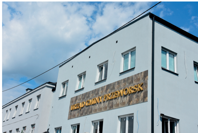
Budynek Urzędu Gminy Przeworsk z zewnątrz

T rwa remont i przebudowa budynku administracyjnego Urzędu Gminy Przeworsk. Przebudowa części handlowo – usługowej pozwoli na pozyskanie dodatkowych pomieszczeń biurowych, sanitarno – socjalnych, sal konferencyjnych oraz pomieszczeń baru. Pozyskanie nowej przestrzeni pozwoli na koncentrację wszystkich jednostek Gminy w jednym miejscu, co usprawni obsługę petentów. W obecnej części administracyjnej przeprowadzany jest gruntowny remont polegający na wymianie stolarki okiennej i drzwiowej, okładzin podłogowych oraz instalacji sanitarnych i elektrycznych. Istniejąca sala narad przekształcona będzie na dodatkowe pomieszczenia biurowe. Budynek zostanie dostosowany dla potrzeb osób niepełnosprawnych, dla których powstaną sanitariaty i winda. Na całości wykonana już został nowa elewacja, pojawią się także dodatkowe miejsca postojowe dla samochodów. Po przebudowie powierzchnia użytkowa Urzędu powiększy się do