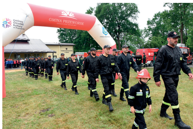
Zawody Sportowo-Pożarnicze w Ujeznej

W grupie A mężczyźni – zwyciężyli strażacy z OSP Urzejowice, za nimi uplasowali się strażacy z OSP Studzian, zaś trzecie miejsce wywalczyła jednostka OSP Mirocin.