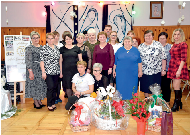
Koło Gospodyń Wiejskich w Studzianie

Na uroczyste spotkanie przybyli przedstawiciele duchowieństwa, parlamentu, władz powiatowych i gminnych, dyrektorów i kierowników instytucji z terenu powiatu, organizacji i stowarzyszeń działających na terenie gminy oraz panie reprezentujące Koła Gospodyń Wiejskich.