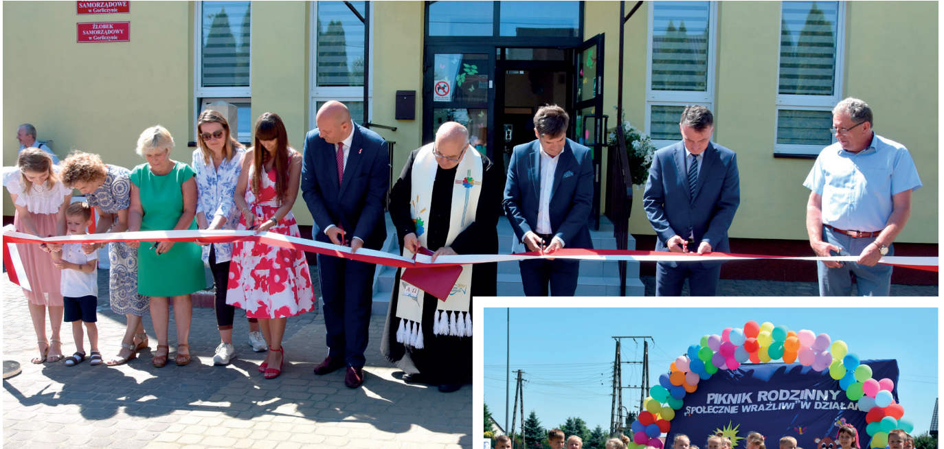
Uroczyste otwarcie Żłobka Mały Miś

Pod hasłem „Społecznie wrażliwi” w dniu 27 czerwca zorganizowany został Piknik rodzinny w Gorliczynie. Ideą przewodnią jego organizacji była prezentacja części z działań społecznych realizowanych przez Gminę Przeworsk na rzecz jej mieszkańców.