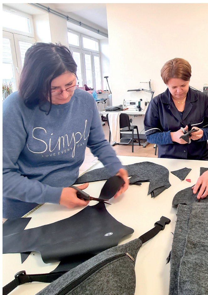
Uczestnicy warsztatu krawieckiego