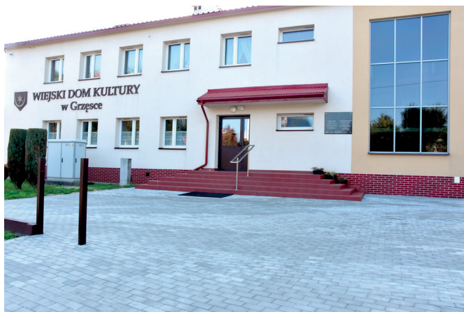
Plac przy WDK w Grzęsce

W lipcu został oficjalnie otwarty i poświęcony nowo wybudowany grzybek taneczny przy Wiejskim Domu Kultury w Rozborzu. Inwestycja na kwotę 420 tys. zł została zrealizowana w ramach zadania pn.: „Podłoga taneczna z urządzeniami budowlanymi i zadaszeniem dojazdu do podłogi tanecznej, rozbiórka istniejącej podłogi tanecznej przy WDK w Rozborzu”. Wykonana została podłoga taneczna parterowa o wymiarach w rzucie 9,78x11,50x10,47m z wolnostojącą sceną wyniesioną ponad poziom podłogi o 60cm. Ponadto od strony zachodniej od wejścia do budynku wykonano zadaszone dojsście do podłogi tanecznej.