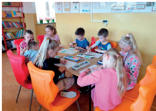
Zajęcia w bibliotece