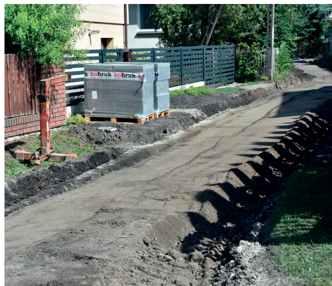
Modernizowana droga w Ujeźnej

Gmina realizuje także zadanie za prawie 3,5 mln zł pn. „Modernizacja dróg na terenie Gminy Przeworsk” dofinansowanego z Rządowego Funduszu Polski Ład: Program Inwestycji Strategicznych. Zakres robót obejmuje m.in. odtworzenie trasy w terenie, korytowanie wraz z profilowaniem i zagęszczanie podłoża, stabilizację gruntu cementem, wykonanie podbudowy, wykonanie nawierzchni z betonu asfaltowego, uzupełnienie poboczy, regulację studni kanalizacyjnych, montaż krawężników drogowych, poręczy ochronnych, umocnienie skarp płytami ażurowymi.