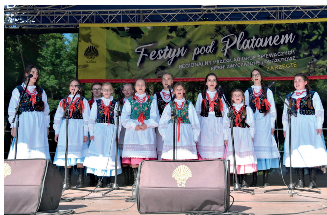
Zespół Śpiewaczy Grzęczczaneczki z Grzęski