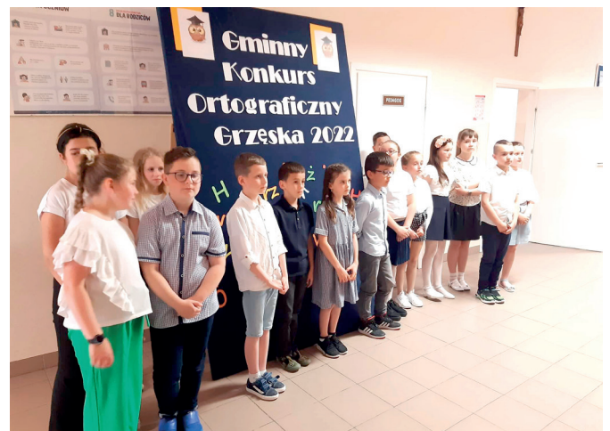
Gminny Konkurs Ortograficzny klas III Szkoły Podstawowej

Uczniom i nauczycielom serdecznie dziękujemy za ciężką pracę w tak trudnym czasie naznaczonym pandemią. Wszyscy uczestnicy otrzymali pamiątkowe dyplomy, a laureaci dodatkowe nagrody rzeczowe.