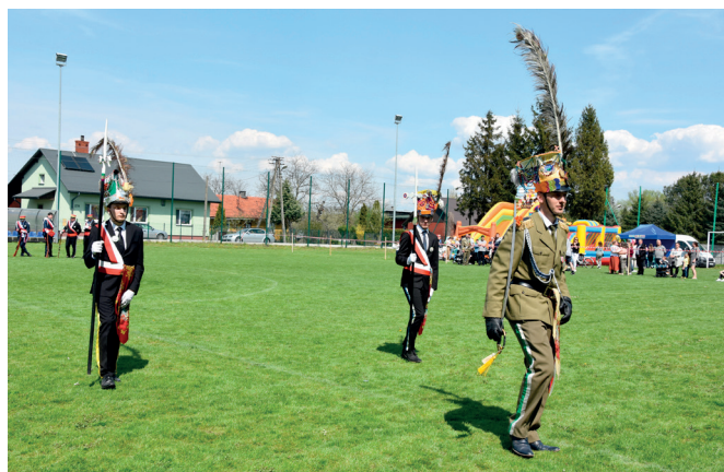
Przedstawiciele Straży Grobowej z Mirocina