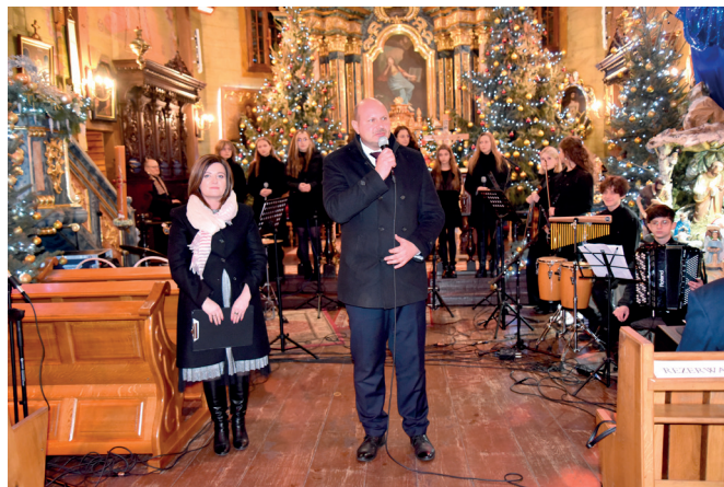
Koncert Idzie kolęda

Organizatorami tego wspaniałego wydarzenia byli: Wójt Gminy Przeworsk i Gminny Ośrodek Kultury w Przeworsku we współpracy z Parafią pw. św. Marii Magdaleny w Nowosielcach oraz Stowarzyszeniem Przyjaciół Ziemi Nowosieleckiej.