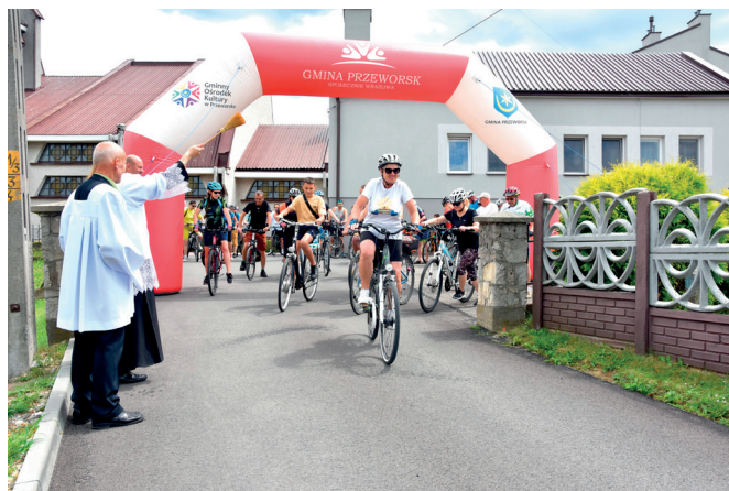
Start Rajdu rowerowego

Muzycznym akcentem sobotniego świętowania były występy artystyczne: Chóru „VERITAS” z Nowosielec oraz solistów z Zespołu wokalnie – instrumentalnego „Bella Voce” ze Studziana.