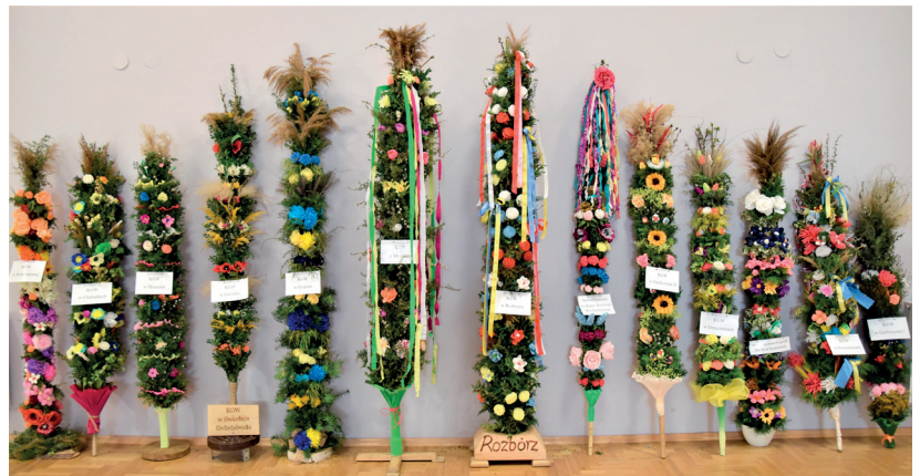
Przegląd Palm Wielkanocnych

Palmy nieznacznie różniły się wielkością, natomiast zgodnie z obyczajami charakterystycznymi dla regionu przeworskiego posiadały wspólne cechy. Bazą do ich wykonania pozostały naturalne materiały, w tym takie rośliny jak: bukszpan, baze, jałowiec, cis, kłokoczka czy suche kwiaty. Każda z palm wyróżniała się sposobem zdobienia, najczęściej były to różnego rodzaju kwiaty wykonane z papieru, bibuły i krepiny, a także wstążki i kokardki.