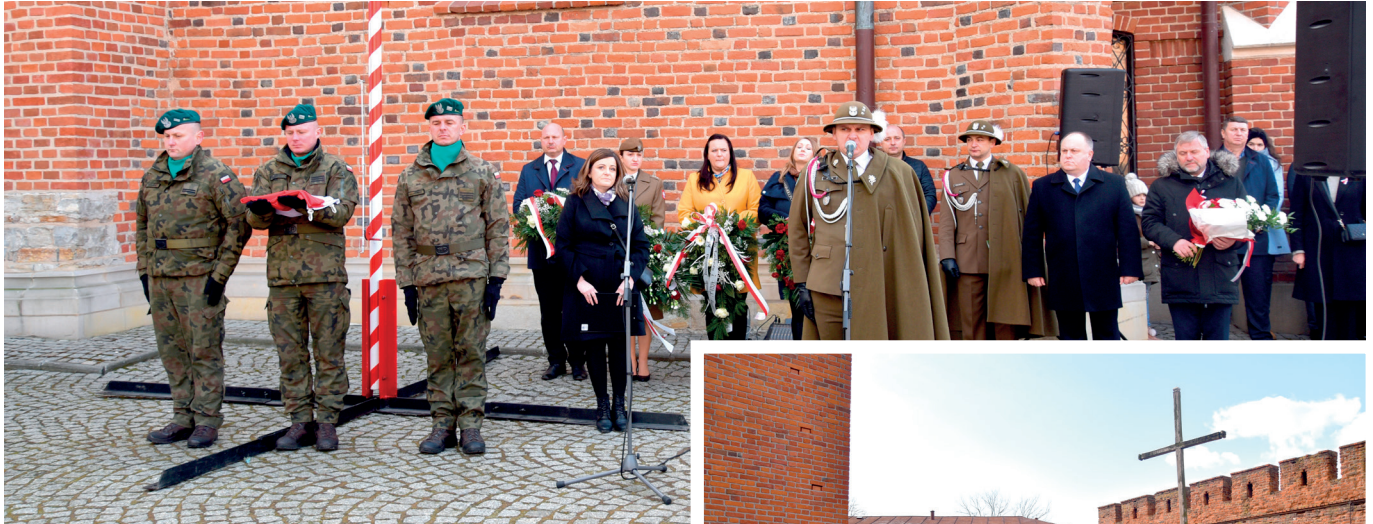
Gminne obchody Narodowego Dnia Pamięci Żołnierzy Wyklętych