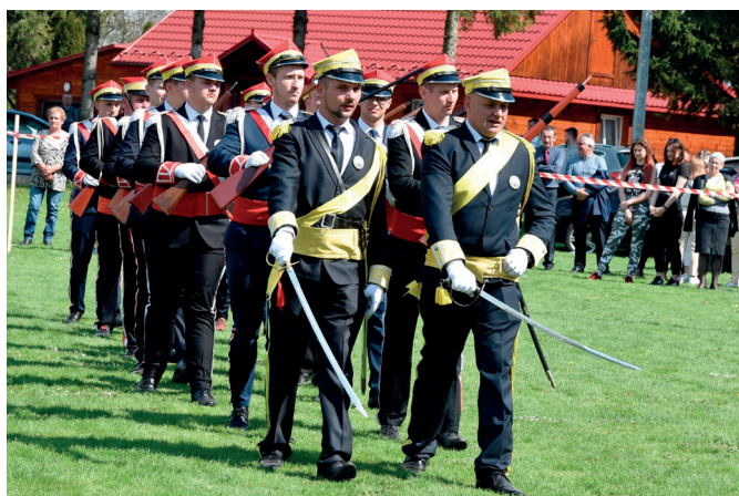
Straż Grobowa z Nowosielec