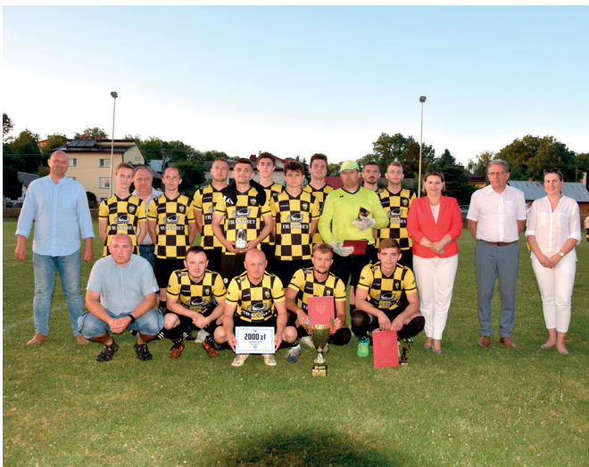
Zwycięska drużyna LKS „Promyk” Urzejóvice