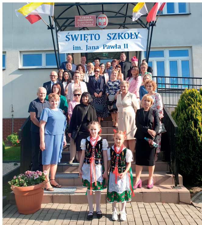
Uczestnicy Majówki Rodziny Szkół im. Jana Pawła II