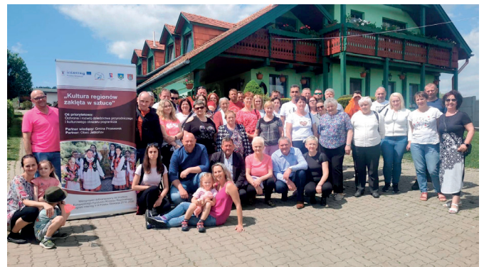
Uczestnicy jednego z trzech wyjazdów na Słowację