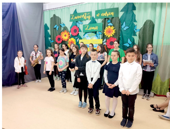
Obchody Dnia Zdrowia

Aby uczcić święta majowe, uczniowie klasy II uczestniczyli w mieszkańców biblioteki. Słowniki, encyklopedie, śpiewnik i inne teksty źródłowe fachowo, w rzeczowy sposób przybliżyły losy Polski i jej zmagania