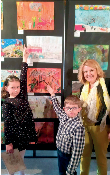
Laureaci Wojewódzkiego Konkursu Plastycznego „Rycerze św. Floriana” wraz z wychowawcą

Systematycznie dokładamy wszelkich starań, aby w naszej szkole uczniowie rozwijali talenty i pasje. Podejmujemy inicjatywy, które przyczyniają się do osiągniętych sukcesów.