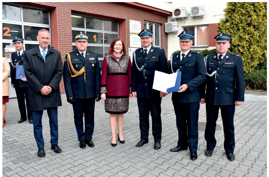
Promesa dla OSP w Urzejowicach

Zadanie finansowane jest z dotacji budżetowej Krajowego Systemu Ratowniczo Gaśniczego w wysokości 225 000,00 zł, środków finansowych NFOŚiGW/WFOŚiGW w wysokości 200 000,00 zł oraz środków samorządu Gminy Przeworsk w wysokości 519 886,00 zł. Dostawcą samochodu jest firma Szczęśniak Pojazdy Specjalne Sp. z o.o. z Bielska-Białej.