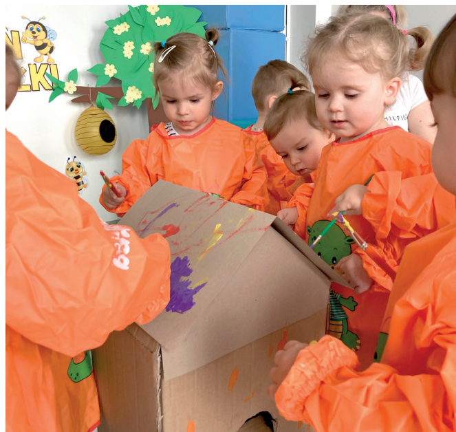
Dzieci podczas zajęć w żłobku Mały Miś