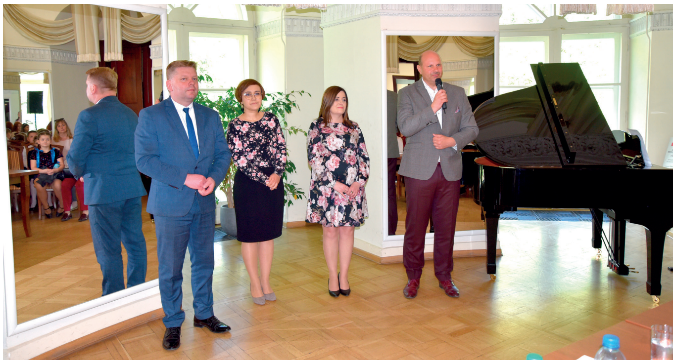
I Międzygminny Konkurs w hołdzie Św. Janowi Pawłowi II

12 maja w Pałacu Dzieduszyckich w Zarzeczcu odbył się I Międzygminny Konkurs w hołdzie Świętemu Janowi Pawłowi II pod hasłem „Miejcie odwagę żyć dla Miłości ...”.